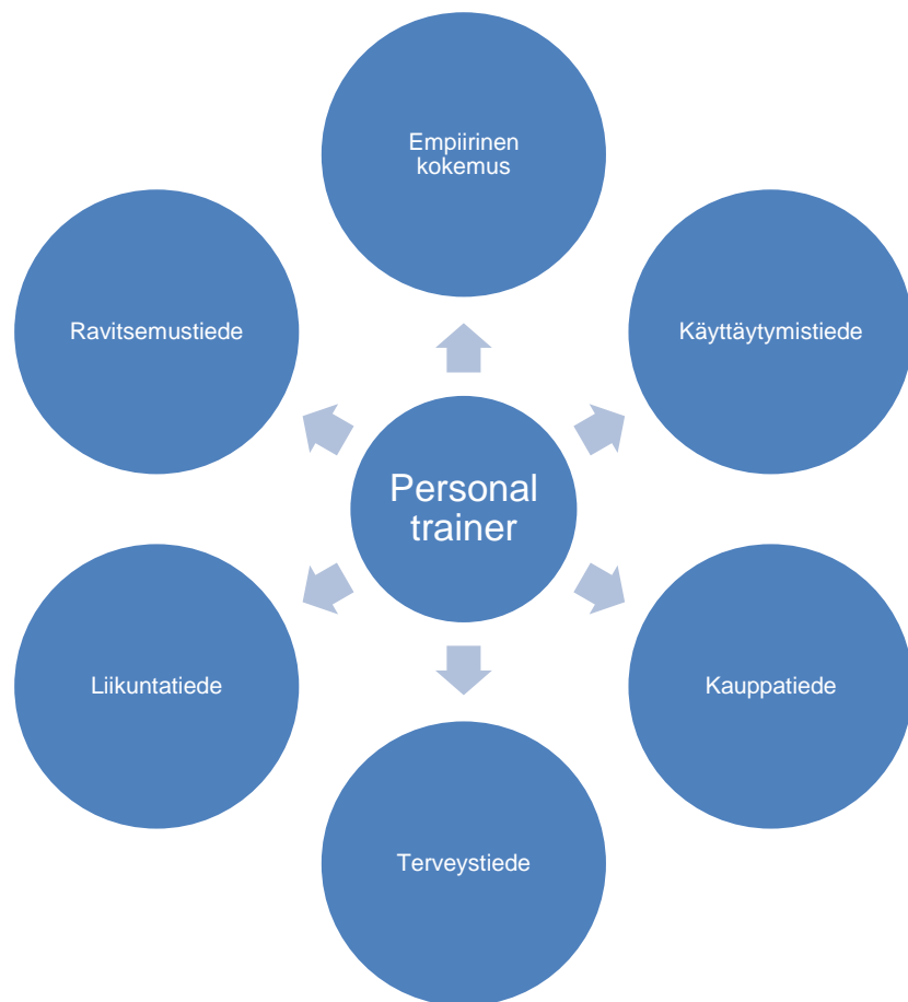
Kuvio 1. (Trainer4you. n.d.a. 4.)

Personal trainer myy monipuolista osaamistaan ja haluaa vaikuttaa positiivisesti kansanterveyteen asiakas kerrallaan. Kuviossa 1 on esitetty alat, joiden välillä personal trainer tasapainoilee työssään. Ammattitaitoinen personal trainer ei kuitenkaan toimi terapeutina tai lääkärinä, vaan ohjaa asiakkaansa eteenpäin tunnistaessaan asiakkaan tarpeen muihin palveluihin. (Trainer4you n.d.a. 4-5.)