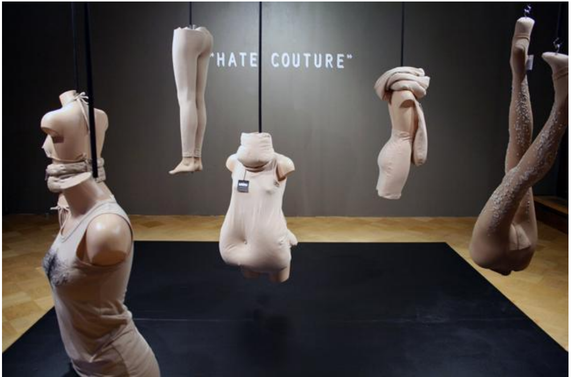
Kuva 2: Tärähtäneet ämmät, Hate Couture

Teoksen nimi muistuttaa termiä “haute couture”, mikä viittaa käsityönä tehtyihin, taideteoksina pidettyihin designvaatteisiin. “Hate”-viha kuvaa yleistä suhdetta teoksessa esiintyviin “virheellisiin” kehon osiin, kuten velttoina riippuviin ikääntyviin rintoihin, muhkeisiin vatsamakkaroihin ja suonikohjuista kirjaviin, röpeliöisiin sääriin. Teoksessa nämä häpeäkohdat on nostettu esiin taideteoksina, esteettisinä pukineina joita kuvissa esitellään ylpeästi kantaen.