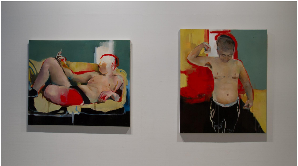
Kuva 9: Opinnäytetyöni “Elmeri” ripustettuna taidekeskus Mältinrannassa.

Teossarjan ripustuspaikaksi valikoitui taidekeskus Mältinrannan galleriatilan takaseinä. Prosessin aikana tilan rajallisuus konkretisoitui tehtyäni pienoismallin seinästä ja maalauksista ripustusta varten; kävi ilmi, että tila oli suunnittelemalleni kolmelle teokselle liian ahdas. Päädyin ratkaisuun, jossa päätin laittaa esille vain kaksi suurempaa maalausta. Koin teosten sekä käsiteltävän aiheen tulevan parhaiten esiin väljällä ripustuksella ja tilan huomioon ottaen kolmannen maalauksen mukana olo ei mielestäni tuonut “mitään lisää” kokonaisuuteen - viesti tulisi selväksi ilmankin.