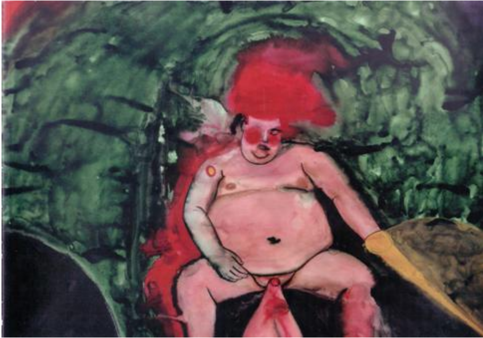
Kuva 7: Jukka Korkeila, Untitled 2002

Akvarellimaalauksessa Untitled, 2002 alaston, lihava mies on asetettu keskelle kuvaa raskasta abstraktia taustaa vasten. Värimaailmaltaan maalaus on raju, tumma vihreä tausta puskee lihaisan pinkkiä ruumista katsojaa kohti. Miehen vartalo on osittain vääristynyt, kivekset on kuvattu luonnottoman suurina, kuvan alareunassa roikkuvina säkkeinä. Kasvojen toinen puoli on punaisen läikän peitossa, mutta katse tuntuu silti kohdistuvan katsojaan ikään kuin häpeämättömyyden osoituksena. Mies näyttää nojaavan hieman taaksepäin, kuin tarjoten itseään katsojan tarkastelun kohteeksi. Suuret kivekset voisi tulkita joko kuvaamaan korostunutta maskuliinisuutta feminiinisen pyöreää kehoa vasten, alleviivaamaan miehen seksuaalisuutta ja libidoa.