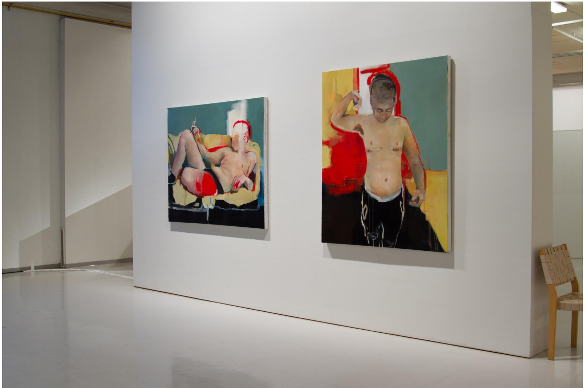
Kuva 10: Opinnäytetyöni "Elmeri" ripustettuna taidekeskus Mäntinrannassa.