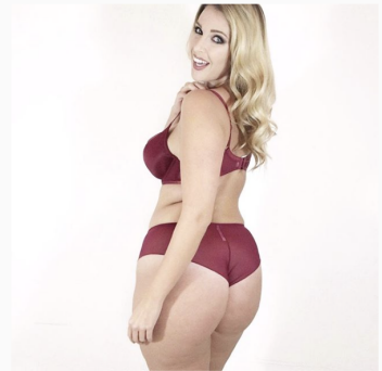
Kuva 1: Instagram hakusanalla #bodypositive 14.12.2016