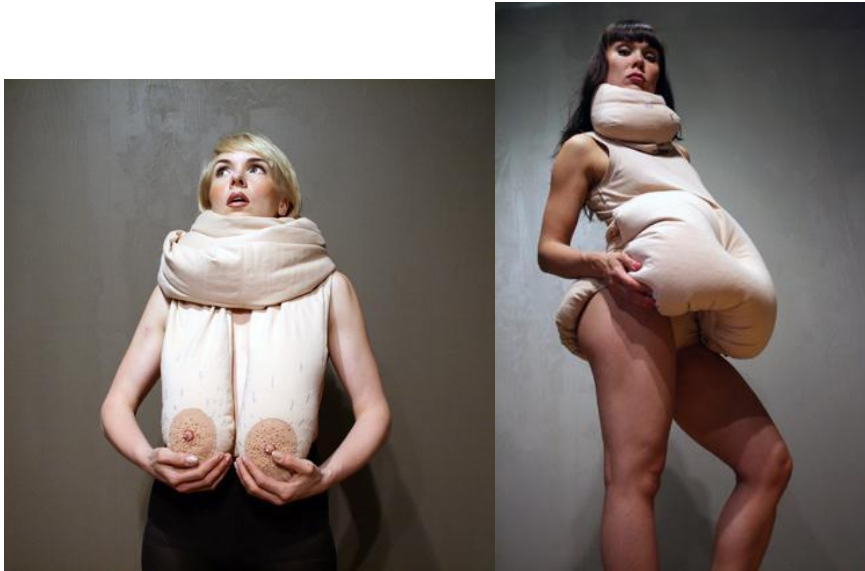
Kuvat 3 ja 4: Tärähtäneet ämmät, Saggy Style/ FatSoFat

“Hate Couture” korostaa näiden ikääntymisen ja elämäkokemusten tuomien muutosten jälkiä merkityksellisinä ja arvostettavina yksityiskohtina, jotka kertovat eletystä elämästä ja kehon kestävydestä.