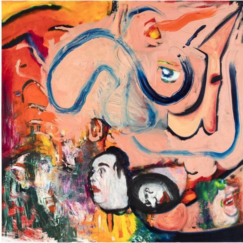
Kuva 8: Jukka Korkeila, Kanin kolo 2016

Maalauksen keskiössä on edelleen miehen seksuaalisuus ja lihava miesruumis, tällä kertaa hyvin rikutussa abstraktissa muodossa. Kuvan keskellä on massiivinen, pelkistetty penis ja hämmentyneen oloisia klovnimaisia kasvoja. Värimaailma on lihallisen pinkki ja keveä. “Kanin kolo” tuntuu viittaavan Liisa Ihmemaassa tyypiseen uuden maailman löytämiseen, mikä teoksessa vertautuu miehen ehkä uusien seksuaalisten ulottuvuuksien etsimiseen ja kasvojen ilmeiden kautta tulkittavissa olevaan positiiviseen yllättymiseen.