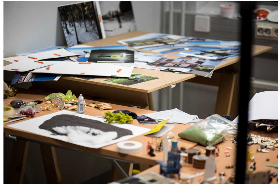
Prosessikuva työhuoneelta Kultainen kosketus - The Golden Touch (2017)

opitusta tiedosta. Kaikki tiedon eri lajit merkityksellistävät arkielämäämme, muodostaen yhdessä käsityksemme tiedosta. Tietoteorioiden tarkastelu nostaa yhden tiedon määritelmän ylitse muiden: tieto on hyvin perusteltu tosi uskomus. (Grebe 2012, 39.)