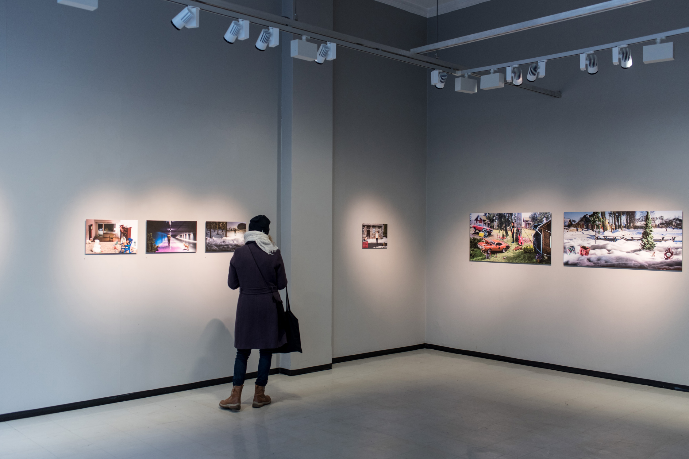
Kultainen kosketus - The Golden Touch (2017), Dibondille pohjustetut näyttelykuvat, Valokuvakeskus Nykyaika, Tampere