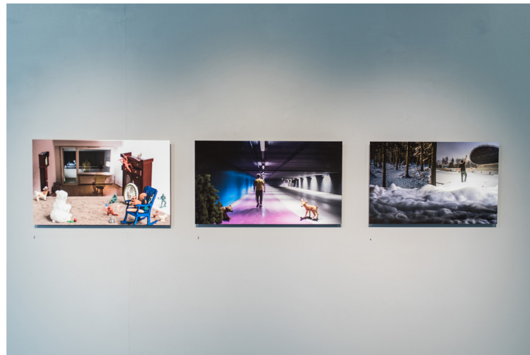
Kultainen kosketus - The Golden Touch (2017) Dibondille pohjustetut näyttelykuvat, Valokuvakeskus Nykyaika, Tampere

olen valmis allekirjoittamaan kuvataiteilijuuden ja käsityöläisyyden yhtäläisyydet. Erojakin ammattikunnissa toki on, mutta aika paljon myös yhteistä. Käsityöläisyys pohjaa yleensä jonkin tarve-esineen, vaateen tai asumuksen valmistamiseen, kun taas kuvataiteilijan teoksella ei useinkaan ole mitään muuta konkreettista funktiota kuin ajatuksen tai tunteen esiin tuominen. Tarvitseeko kuvataidetta perustella sanallisesti? Omassa työskentelyssäni sanallisuudella on merkittävä asema, vaikka teosten katseleminen ei välttämättä vaadikaan minkäänlaista sanallistamista.