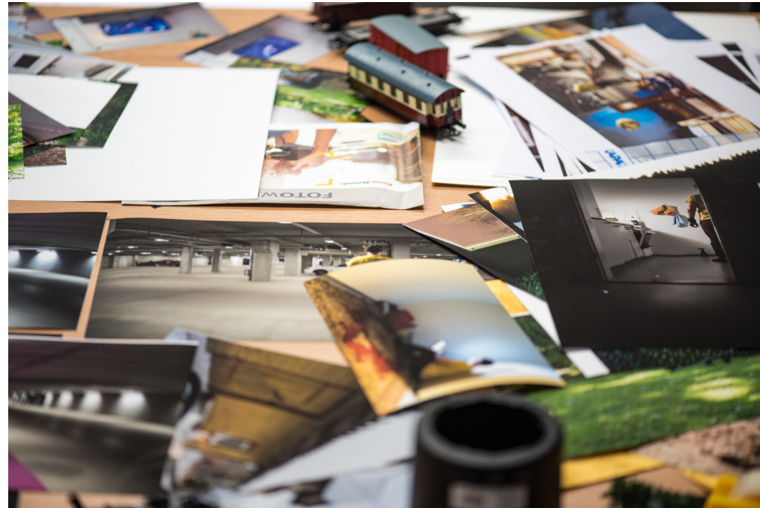
Prosessikuva työhuoneelta Kultainen kosketus - The Golden Touch (2017)