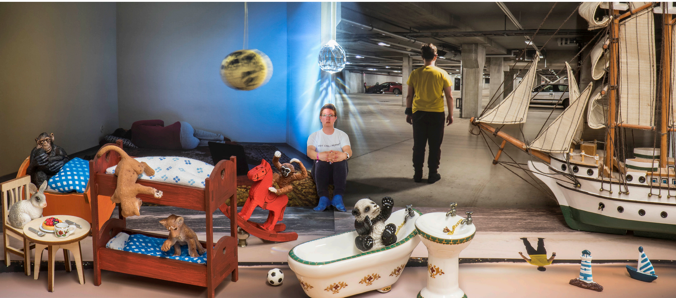
Kullainen kosketus - The Golden Touch (2017)