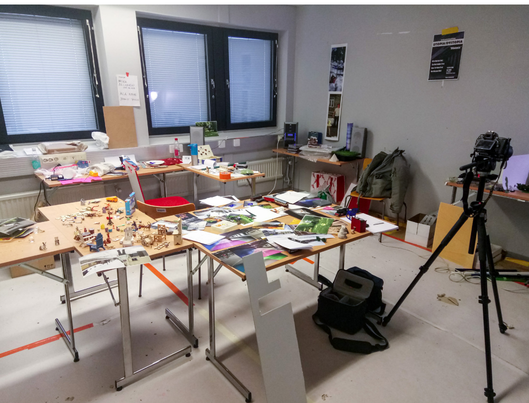
Prosessikuva työhuoneelta Kultainen kosketus - The Golden Touch (2017)

Seuraava aukeama: Prosessikuva työhuoneelta: Kultainen kosketus - The Golden Touch (2017)