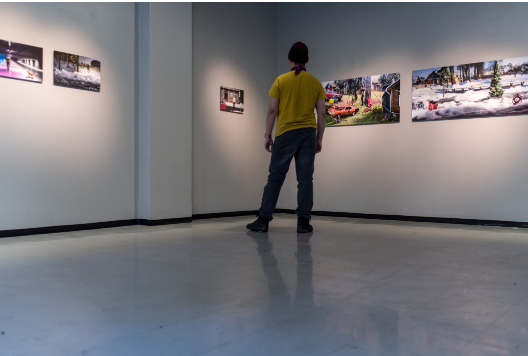
Kultainen kosketus - The Golden Touch (2017) Dibondille pohjustetut näyttelykuvat, Valokuvakeskus Nyky aika, Tampere

Opinnäytetyöni taiteellinen osuus, seitsemän valokuvan sarja kantaa nimeä Kultainen kosketus - The Golden Touch. Tavoitteenani oli rakentaa yllättävä, surrealistisen leikkisä, aavistuksen taianomainen mutta arkinen tarina valokuvien avulla.