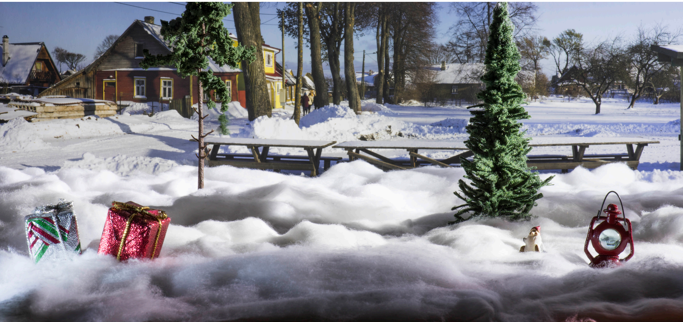
Kultainen kosketus - The Golden Touch (2017)