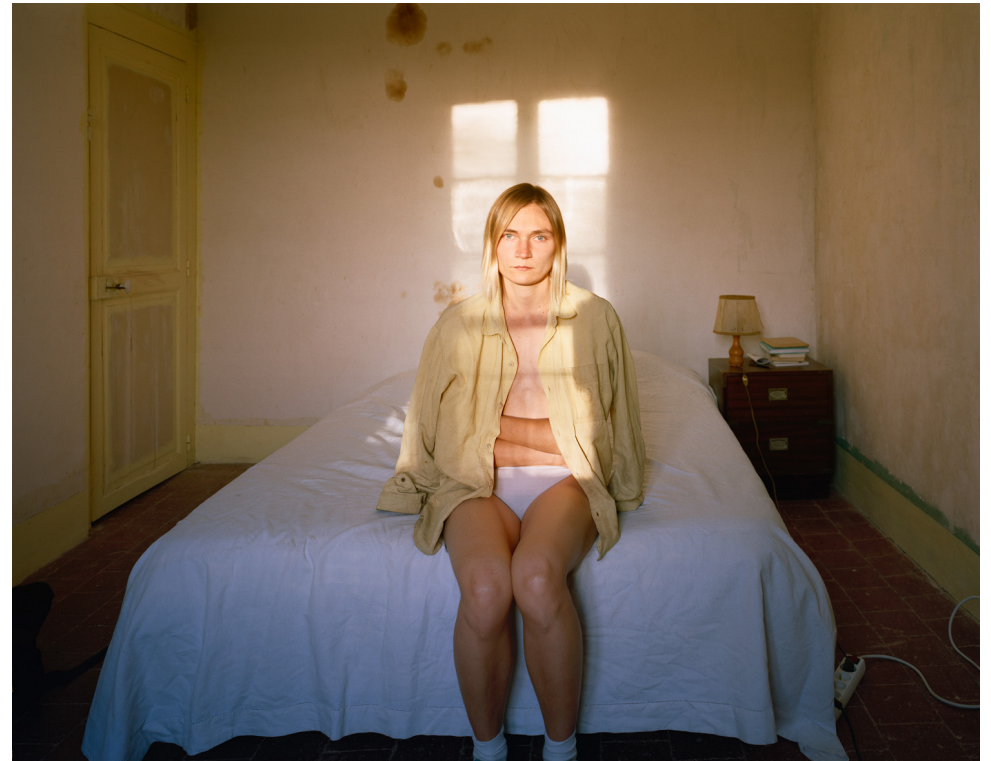
Kuva: Elina Brotherus, Model Study 2 (2003)

”Valokuva on kuin aikakone” , Brotherus sanoo. Brotherus tarkentaa ajatustaan toteamalla, että valokuva tekee näkyväksi muutoksen, ajan kulumisen: ”tuo on ollut, tämä on nyt, ja kohta tätäkään ei enää ole” . Brotherus ei tiedä tarkasti, mistä ideat kuviin tulevat. Uusia kuvia ottaessaan hän ei kerro edes itselleen tekevänsä töitä, ihan vain kokeillakseen kuvaa muutaman valokuvan. (Helsingin Sanomat, kulttuuri. 22.1.2015 Elina Brotherus: Valokuva on kuin aikakone.)