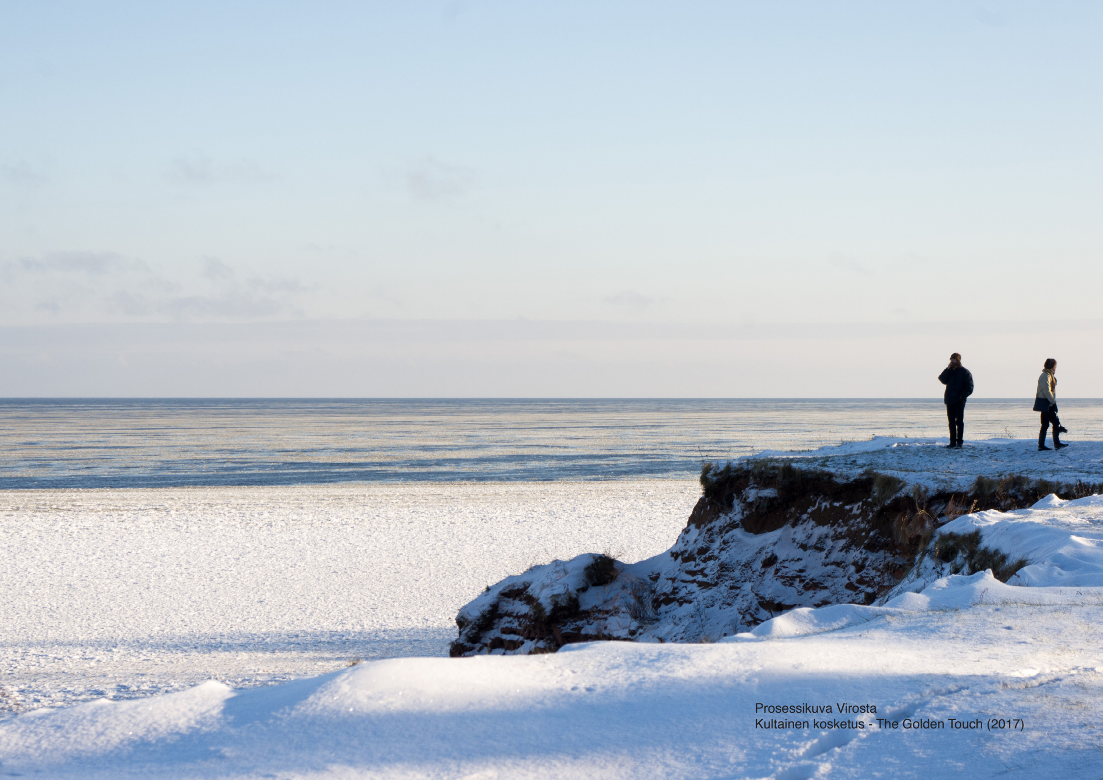
Prosessikuva Virosta Kultainen kosketus - The Golden Touch (2017)