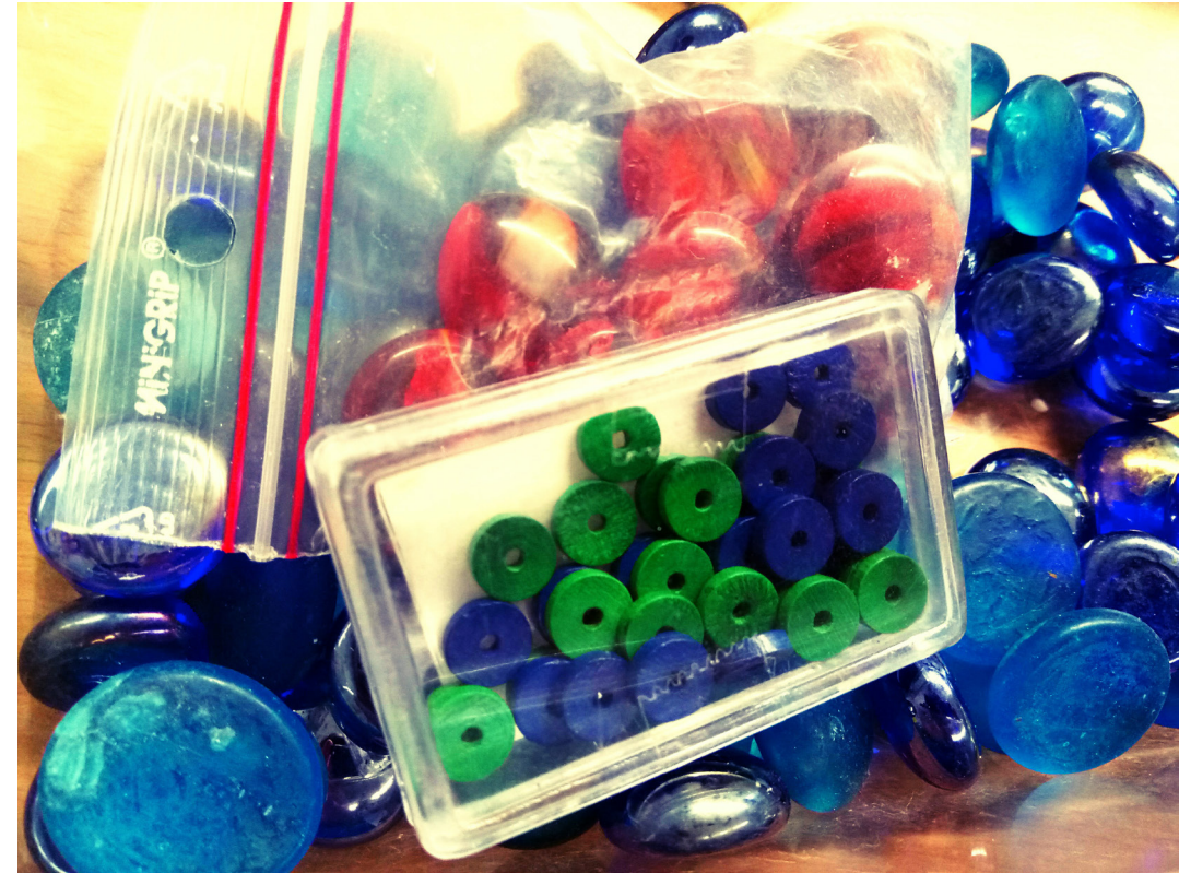
Prosessikuva työhuoneelta Kultainen kosketus - The Golden Touch (2017)