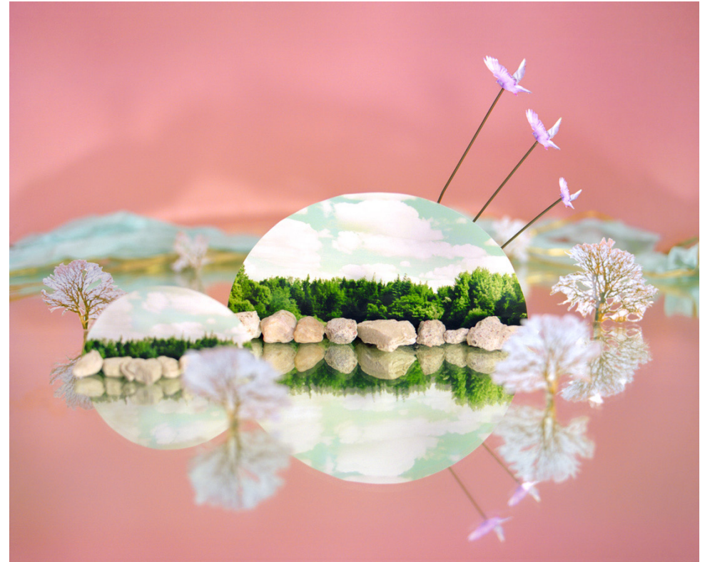
Kuva: Laura Konttinen, Island of No Memory (2014)

pilkkoa valokuva ja koota se uudelleen, haluttuun muotoon. (Konttinen, Muistikuvia : valokuvasarja 2010)