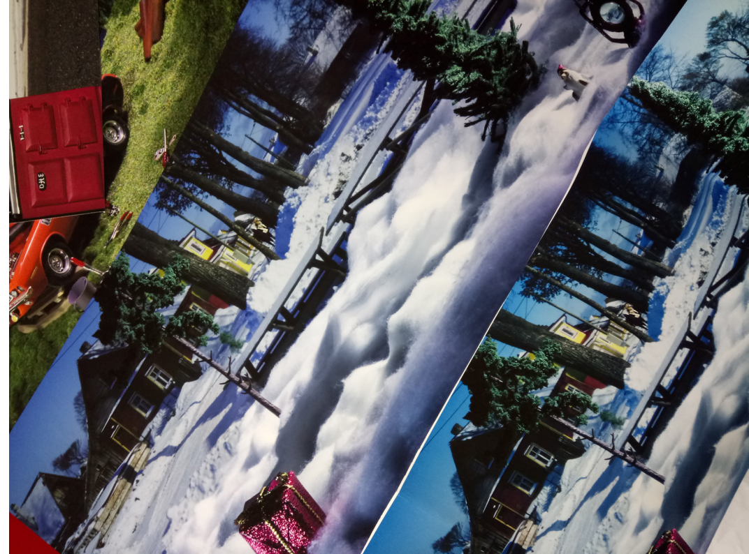
Prosessikuva: Kultainen kosketus - The Golden Touch (2017)

Taiteessa metaforilla on usein vahvoja rooleja. Omissa kuvissani on paljon totutusta poikkeavia kuvallisia kielikuvia, kuten esimerkiksi purjelaiva parkkihallissa tai apina keinuhevossa. Metaforien avulla voi viitata johonkin tunnistettavaan ilmiöön. Toisaalta minua kiinnostaa myös uusien, kokeellisten metaforien kehittäminen valokuvan sisälle. Metafora voi olla monimerkityksinen ja häilyvä, mutta siitä huolimatta vahvan tunnelatauksen omaava.