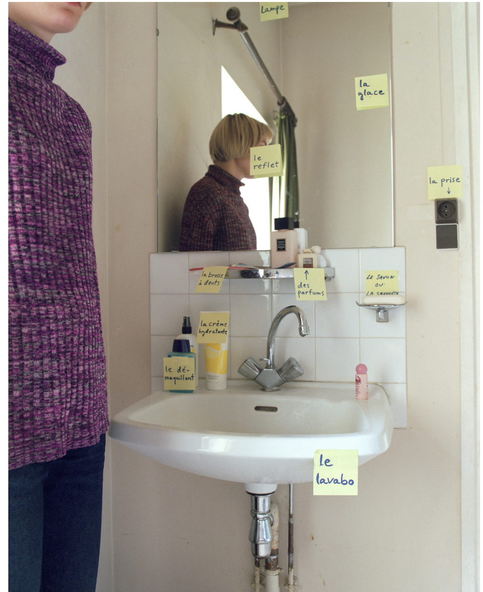
Kuva: Elina Brotherus, Le Reflet (1999)

Brotheruksen kuvat ovat tunteikkaita ja rosoisen viimeistelyjä. Kuvassa olevan henkilön identiteettiin on joskus helpompi päästä sisään, joskus vaikeampi. Valokuvasarjoista löytyy tarttumapintaa useammalla eri tasolla. Nykyvalokuvataide on vapaa väylä luoda tarinoita. Nykyvalokuvataide toisaalta hyödyntää valokuvauksen perinteitä, toisaalta rikkoo niitä.