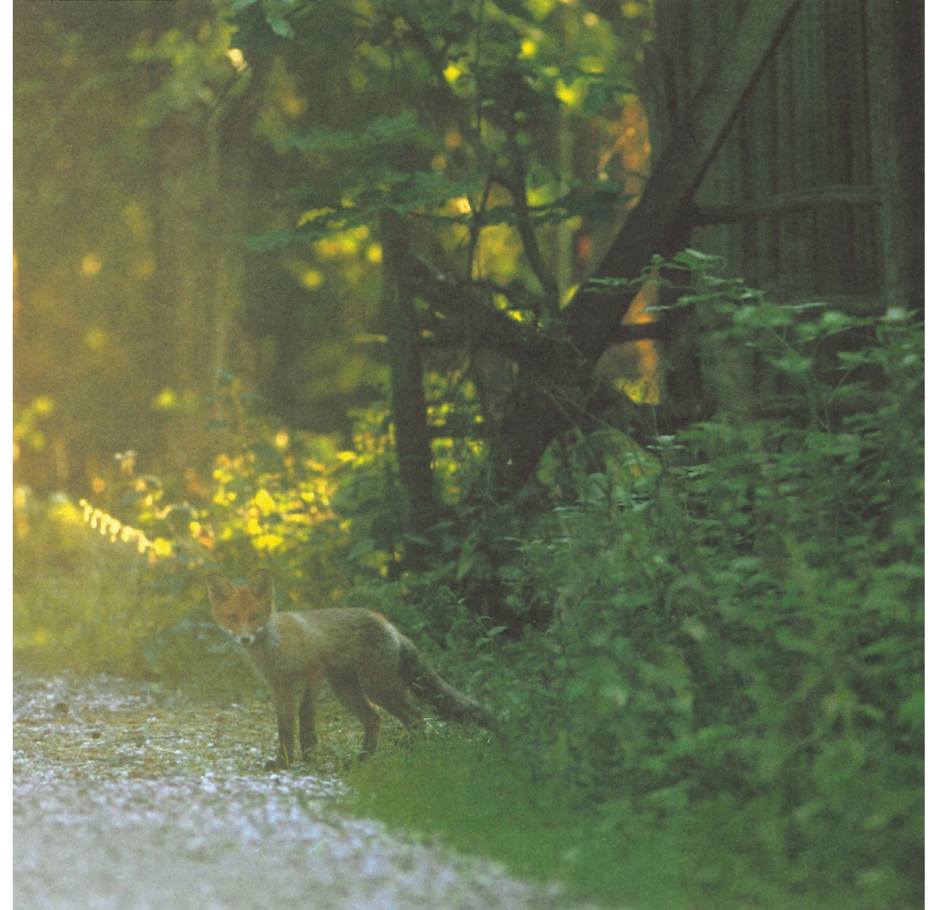
Kuva: Heikki Willamo - Kultaturkki (2000)

Mielikuvitus ja piilotajunta ovat tärkeä osa ihmisen olemusta. Sadut ja tarinat hyödyntävät edellä mainittuja ihmisen ominaisuuksia. Parhaimmillaan sadut ovat maagisia, ihmeellisiä, opettavaisia ja uutta synnyttäviä – mutta samalla myös perinteitä vaalivia.