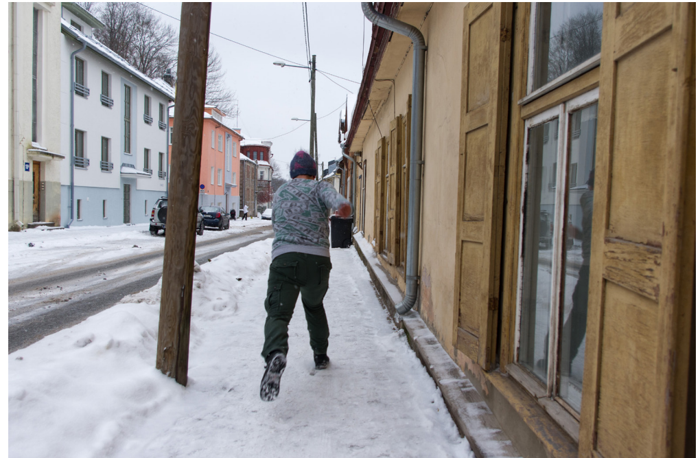
Prosessikuva Virosta Kultainen kosketus - The Golden Touch (2017)

Opinnäytetyöni taiteellinen osuus on seitsemän kuvan valokuvasarja Kultainen kosketus – The Golden Touch. Omassa teoksessani kokeilen tarinallisuuden ilmentymistä kuvista silloin kun teksti puuttuu.