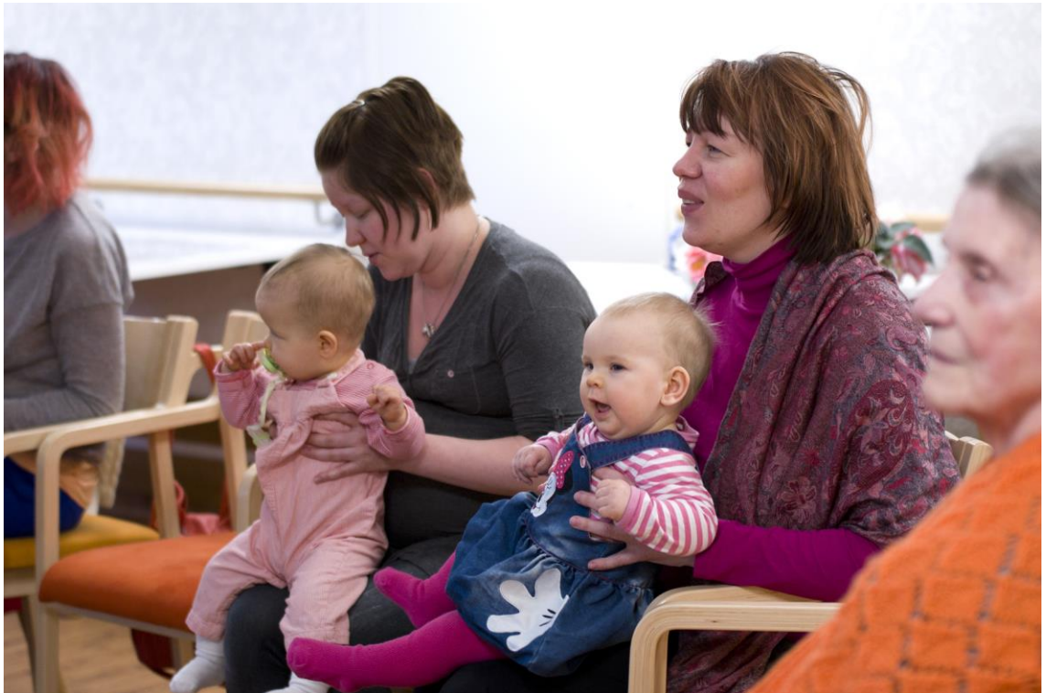
Kuvio 12. Alkulaulu on alkanut.

aina pieniin juoksutuksiin, joita tein elävöittääkseni muuten yksinkertaista laulua. Kuviin oli tallentunut pari otosta kuvailemistani ilmeistä. Itse koin hyvin vahvan muutaman minuutin kestävän läsnäolon tunteen, jossa koin sanatonta vuorovaikutusta ja lämpöä. Yhteinen ilon elämys ja kohtaaminen syntyi kuulo- ja näköaistin avulla. Nainen jätti vahvan viestin minulle, että näkee ja kuulee, vaikkei osallistu kommunikointiin puhumalla tai laulamalla.