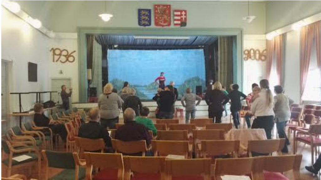
Kuvio 6. Lavis-lavatanssijumppaa tilaisuuden päätteeksi.

Olin erittäin motivoitunut saamaan Tekee mieli oppia -tilaisuuden onnistumaan. Kaiken ennakkosuunnittelun lisäksi pääsin järjestelemään juhlasalia vasta edellisenä iltana myöhään muun opetuksen päätyttyä. Aamulla varhain kuljetin saliin vielä syksyisiä kukkia kotipihaltani ja muuta tarpeellista tavaraa käden ulottuville. Tästä kaikesta olen erittäin kiitollinen perheelleni. Koko perhe auttoi osaltaan kodin töissä, salin järjestelyissä tai tapahtuman taltiointissa. Kukaan ei kyseenalaistanut tapahtuman tarpeellisuutta ja ideaa. Myös äitini osallistui tapahtumaan ystäviensä kanssa.