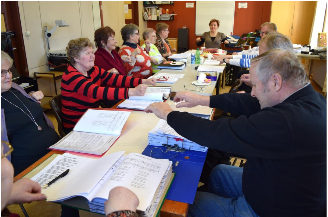
Kuvio 3. Soudetaan mummolaan. Taukoliikuntaa istuen.

Elämänkaaren ryhmän ohjaustyöstä syntyneet kokemukset ovat toimineet innoittavina alkusysäyksen antajina toimintatutkimukselleni. Järjestimme ryhmän kutsumana vanhustenviikolla 40/2016 Tekee mieli oppia -aamupäivätapahtuman, jonka suunnittelua ja toteutusta käsitellen tarkemmin seuraavassa luvussa. En käsittele ryhmän arkitoimintaa yksityiskohtaisemmin. Alkuperäinen tarkoitus oli toteuttaa heidän kanssaan haastattelu. Syksyn 2016 aikana pohdin, missä määrin ohjaajan suorittama haastattelu saattaisi häiritä ryhmän toimintaa luottamuksen ja vapautuneen ilmapiirin näkökulmasta. Haastattelun sijaan ryhmäläiset ovat voineet halutessaan kirjoittaa kokemuskirjaan osallistuessaan yhteistyöhön 7B-luokan kanssa, Tekee mieli oppia -tilaisuuteen tai Iloa musiikista -tapahtumaan. Liitteessä 1 esittelen kaksi erilaista lukukausisuunnitelmaa ja ryhmän arjesta esittelen ohessa kaksi valokuvaa.