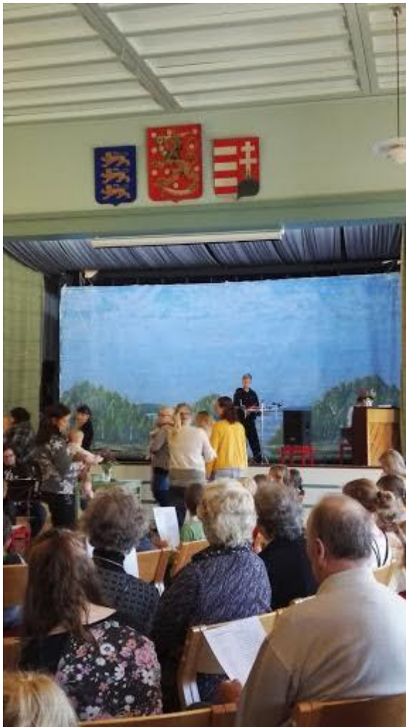
Kuvio 14. Juokse sinä humma.