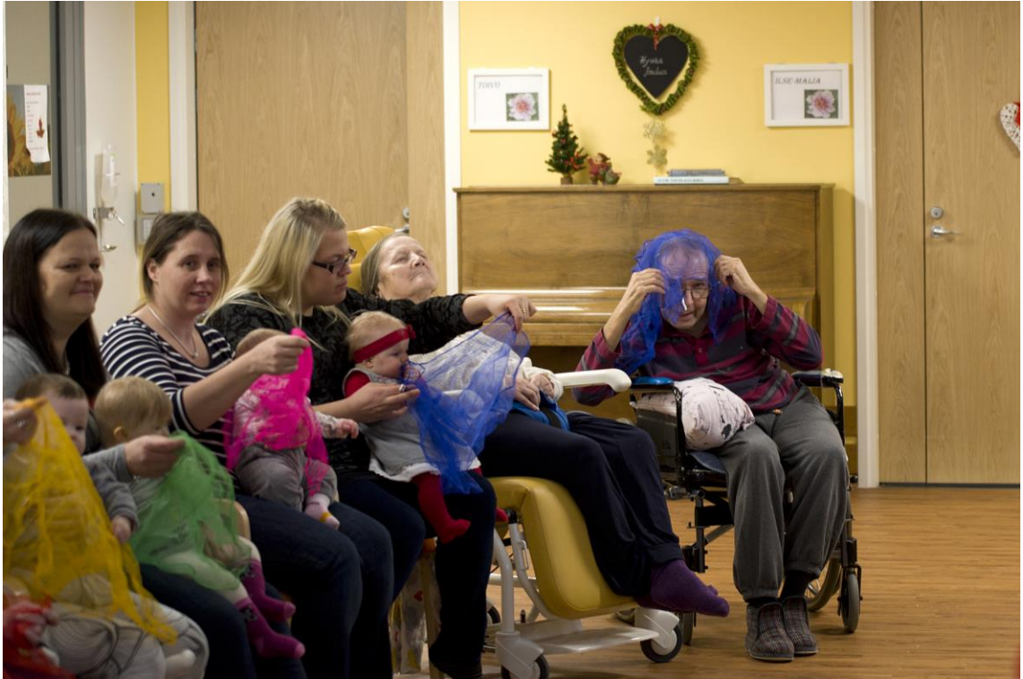
Kuvio 11. Huivi tanssii ja huivin alla piilossa.

Tämän kerran tähtihetki muodostui toisen ryhmän tunnille osallistuneen oranssihuivisen naisen ja minun välisestä katsekontaktista. Alotan minä laulamaan -laulu toistettiin kahdeksan kertaa. Vieressäni oikealla puolella pyörätuolissa istuvan naisen ja minun katseet kohtasivat. Hän on osallistunut tunneille aiemminkin ja on ollut perusilmeeltään vakava. Irrotin katseen hänestä vilkaisten välillä muualle, mutta huomattessani naisen tuijottavan minua, jatkoin säästystä samalla katsoen häntä. Vilkuilin edelleen ryhmän suuntaan muutamaan kertaan varmistaakseni olevani tilanteen tasalla Outiin ja muuhun ryhmään nähden. Koin kuitenkin olevani tärkeä tuossa katsekontaktissa.