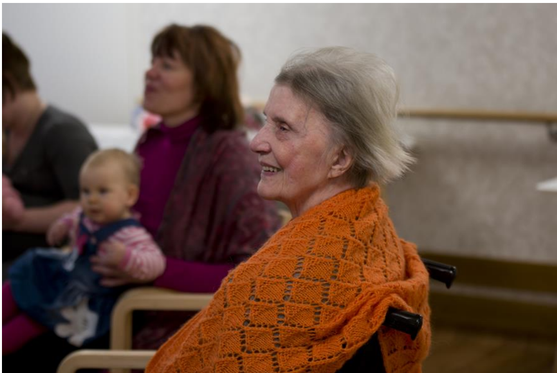
Kuvio 13. Hymyn riemukas hetki.