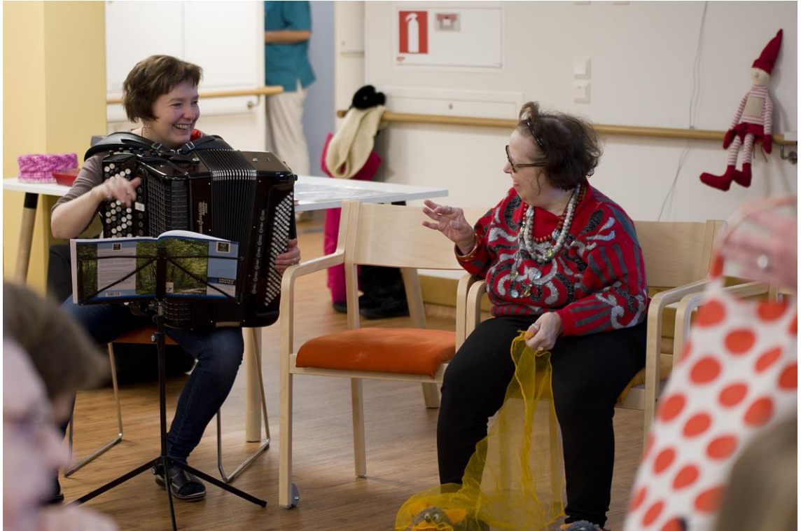
Kuvio 9. ”Tämä on ihanaa terapiaa!”