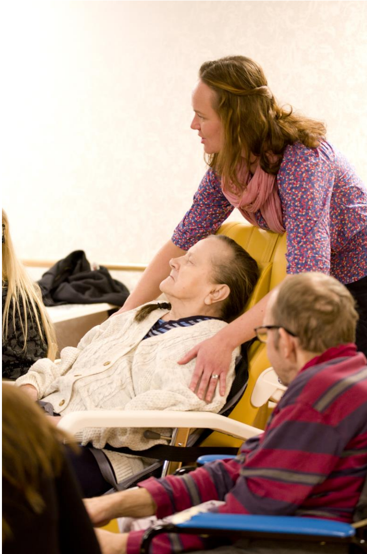
Kuvio 7. Joulusauna.

Joululauluja tanssittiin piirissä ja lopuksi leivottiin leivonnaisia. Outin lorussa leivottiin erilaisia leivonnaisia, joita nousi esimerkiksi käsistä, vatsasta tai selän takaa, ja niiden päälle ripoteltiin sokeria ja kanelia. Tämä laulu ei tarvinnut säestystä, ja huomasin toisen ryhmän kohdalla ehtiväni laskea harmonikan sylistäni ja avustaa leipomisessa. Aluksi kysyin vanhuksilta luvan, saako tulla leipomaan. Silittelin ja pyörittelin pullia heidän käsistään, selästään ja polvistaan ripotellen lopuksi mausteita päälle. Tätä lorua uusittiin moneen kertaan ja lähes kaikki vanhukset saivat leipomissilityksiä.