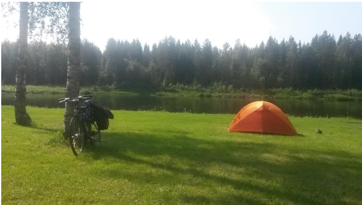
Kuva 6 Leiri Simossa

Matka Rovaniemelle pitää sisällään yhden Suomen pisimmistä tiesuorista, runsaasti hiekkateitä, kokemuksen ukkosta karkuun ajamisesta sekä edelleen aktivistiviestintää pitkin matkaa. Valitsemani huumorilinja tuntuu pysyvän loppuun asti. Hauskaahan tämä kumminkin lopulta on. Perille päästyäni tapaan monipuolisen aktivistijoukon heidän kaupunkiviljelypalstallaan. Rovaniemen paikallisryhmän toiminta poikkeaa totutusta siinä mielessä, että eri järjestöjen ja yhteenliittymien ihmiset toimivat isomassa porukassa. Eli kasvimaallakin suurin osa tapaamistani ihmisistä oli paikalla muuten kuin Maan ystävien kautta. Järjestörajat ylittävää yhteistyötä siis! Tälle olisi varmasti tilausta myös muilla paikkakunnilla. Samankaltaisten asioiden parissa nämä eri ryhmittymät kumminkin toimivat.