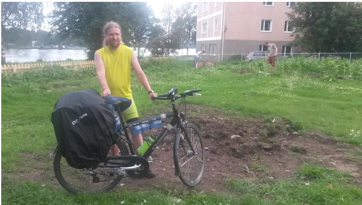
Kuva 7 Perillä on helppo hymyillä