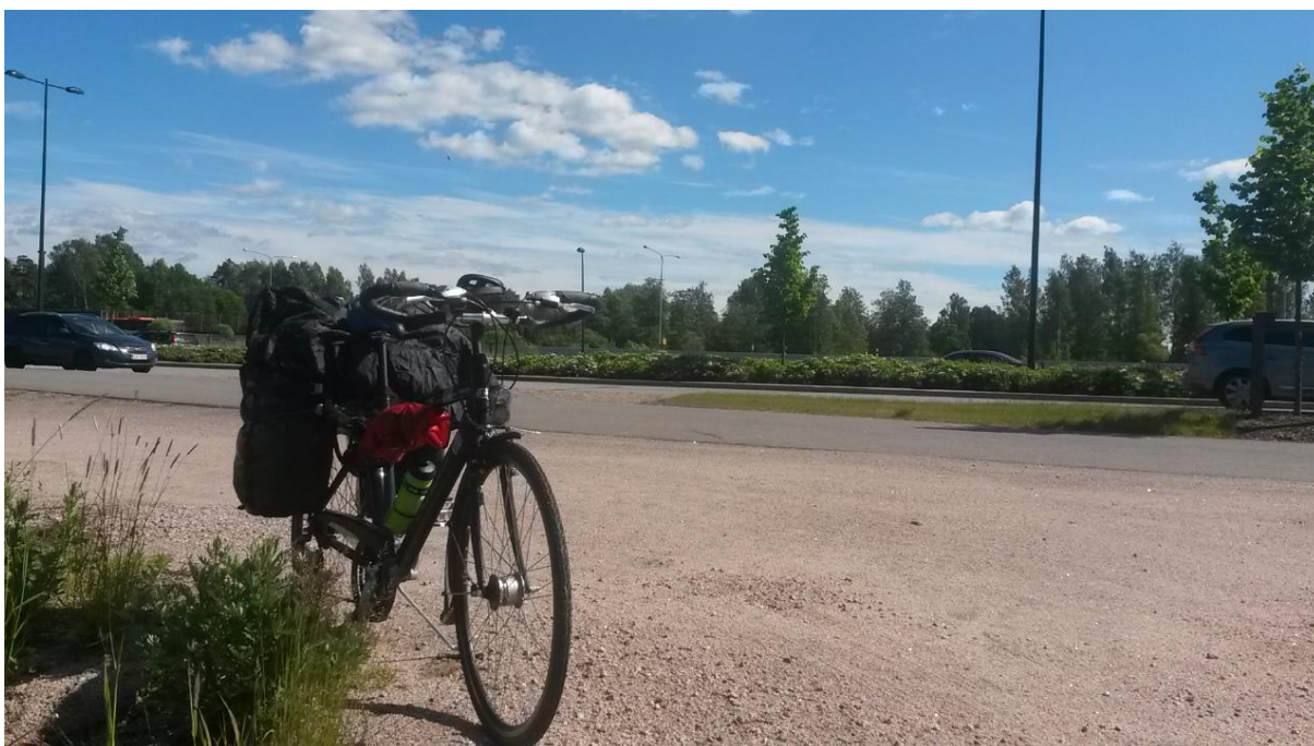
Kuva 3 Tauolla Espoossa

sekä Maan ystäville yleensä. Eikä tempauksen mukana lanseerattu rahoituskampanjakaan suinkaan vähennä viestinnän tarvetta. Erilaiset tempaukset ovat nykyisin sosiaalisen median aikakaudella merkittäviä välineitä huomion herättämisessä. Niinpä nykyaktivismiinkin liittyy median huomion vangitsevat tempaukset. (Metsämäki & Nisula 2006, 341) Tutkimuksen mukaan vuosi 2014 oli käännteentekevä sosiaalisen median käytössä järjestömaailmassa. Tuona vuonna viestintä sekä osallistuminen niin järjestönä kuin myös järjestön edustajina lisääntyi ja tavoitteellistui sosiaalisessa mediassa. (Seppälä 2015.)