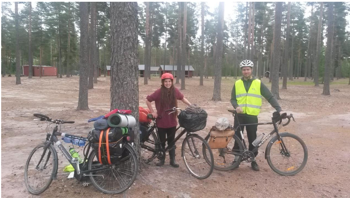
Kuva 4 Kohti Poria

Porin tapahtuma rakentuu paljolti toimijaoppaan esittelyn varaan. Tähän päädyttiin, koska kaikki osallistujat olivat jo kokeneita toimijoita Maan ystäväissä. Keskustelut oppaan tiimoilta ja muutenkin olivat hyvin antoisia. Ehkä tässä tapahtumassa tuli hyvin esille se, kuinka erilaisten ihmisten kanssa vapaaehtoistoiminnan piirissä ollaankaan tekemisissä. Vaikka järjestö on kaikille sama. Tämä on hyvä pitää mielessä tulevissa tapahtumissa. Kuinka rakennetaan innostava ja toimiva esittelytilaisuus, joka pysyy kasassa loppuun saakka. Yhteisöpedagogin perustaitoja.