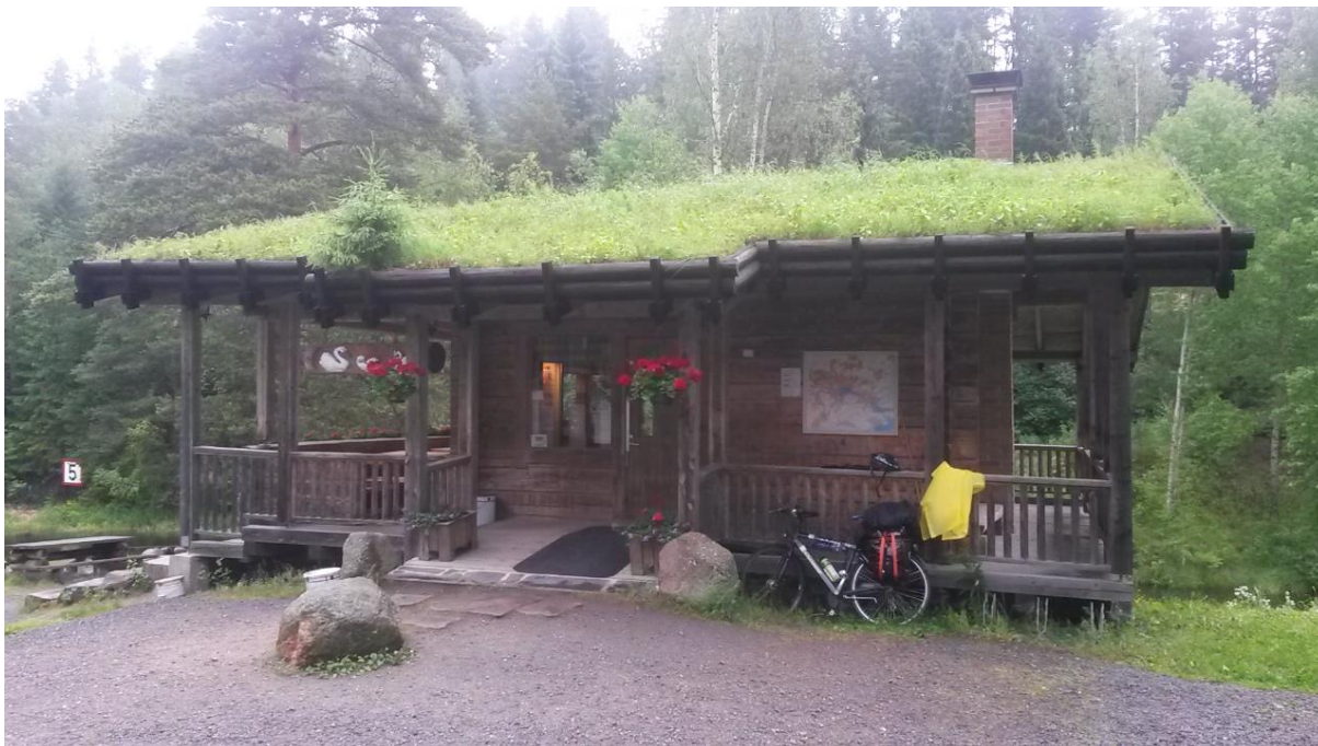
Kuva 5 Sateisen pyöräilypäivän tauko Nokian Siurossa

Tamperelaisten kanssa olimme suunnitelleet ulkoilmatapahtumaa. Voisimme mennä jonnekin puistoon piknikille ja rupattelemaan Maan ystävistä sekä toimijaoppaasta. Säänhaltija päätti kumminkin toisin ja ilman viileys sekä sateen mahdollisuus pitävät meidät sisällä. Paikalle on tullut mukavasti ihmisiä, joten paikallisryhmä on onnistunut hienosti omassa markkinoinnissaan! Tapahtuma muodostuu lämminhenkiseksi rupattelutuokioksi, jonka aikana pääsen myös ensimmäistä kertaa esittelemään järjestön perustoimintaa. Hyvä haaste myös tällä rintamalla.