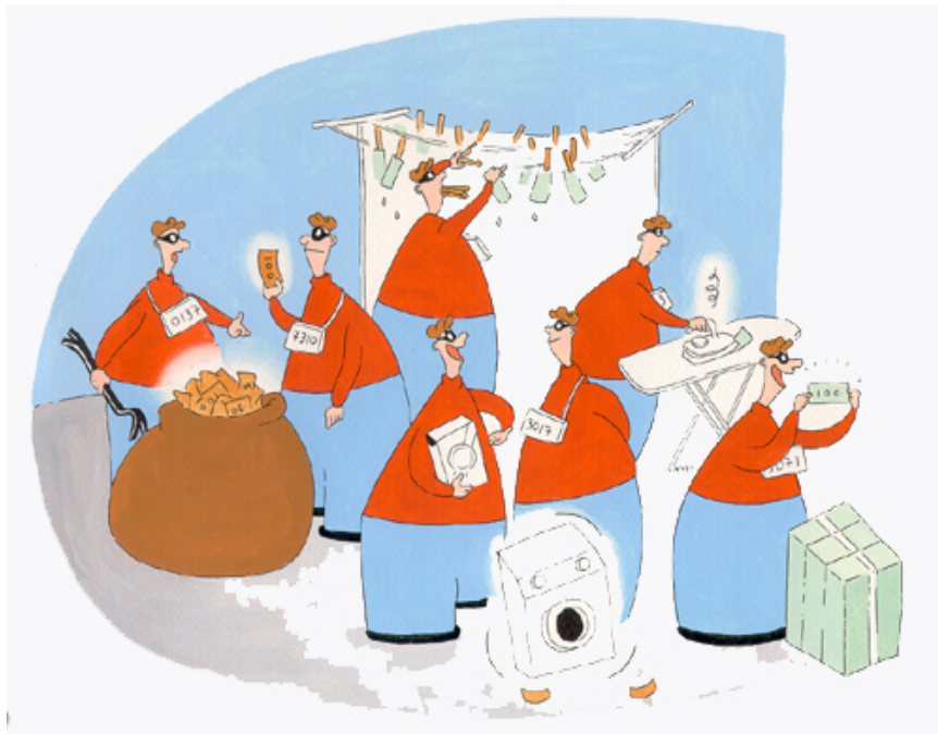
Kuvio 1. Mielikuva rahanpesusta (Poliisilehti 4/2001).