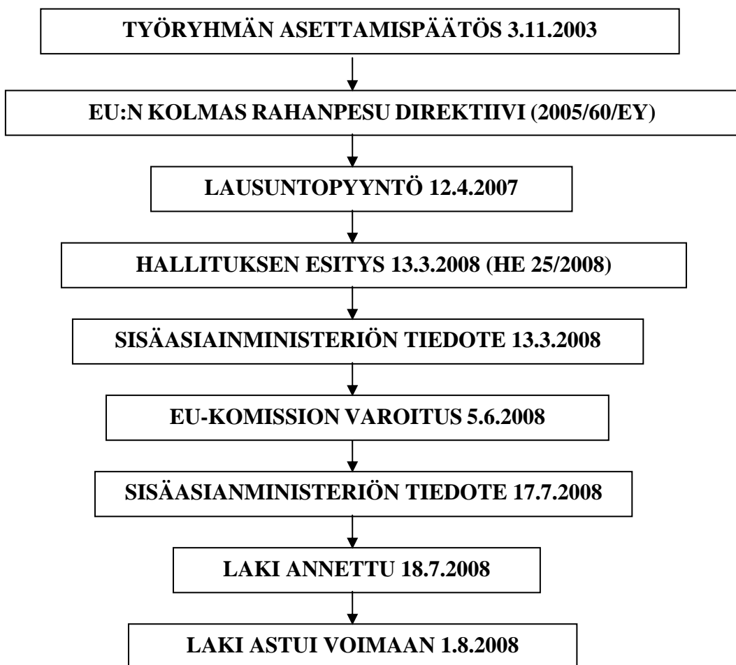
Kuvio 3. Lainsäädäntöprosessin eteneminen.

Alla oleva kuvio esittää lainsäädäntöön liittyvän prosessin. Kuviossa on käyty läpi kaikki uuteen rahanpesulakiin vaikuttaneet asiat. Jo ennen kolmannen rahanpesudirektiivin voimaantuloa sisäasianministeriön poliisiosasto asetti työryhmä pohtimaan uutta lakia. Seuraavilla sivuilla on tarkemmin kuvattu lainsäädäntöprosessin kulkua.