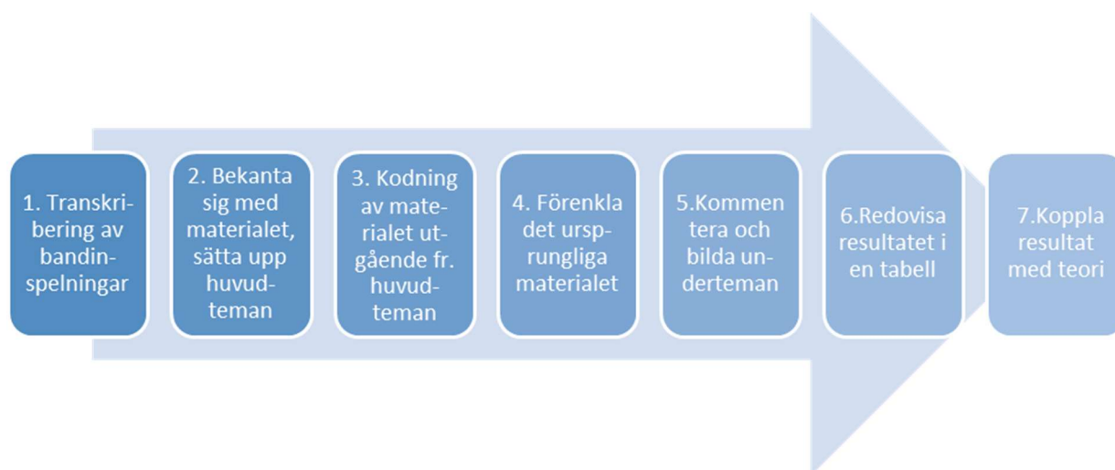
Figur 1. Analysprocessen

Efter transkriberingen börjar man analysprocessen med att bekanta sig noga med det insamlade materialet (Eskola & Suoranta, 1998, 151). Det var även så analysprocessen i arbetet påbörjades. Figur 1 visar, steg för steg, hur analysprocessen i arbetet har framskridit och fungerar som ett stöd för beskrivningen av analysprocessen.