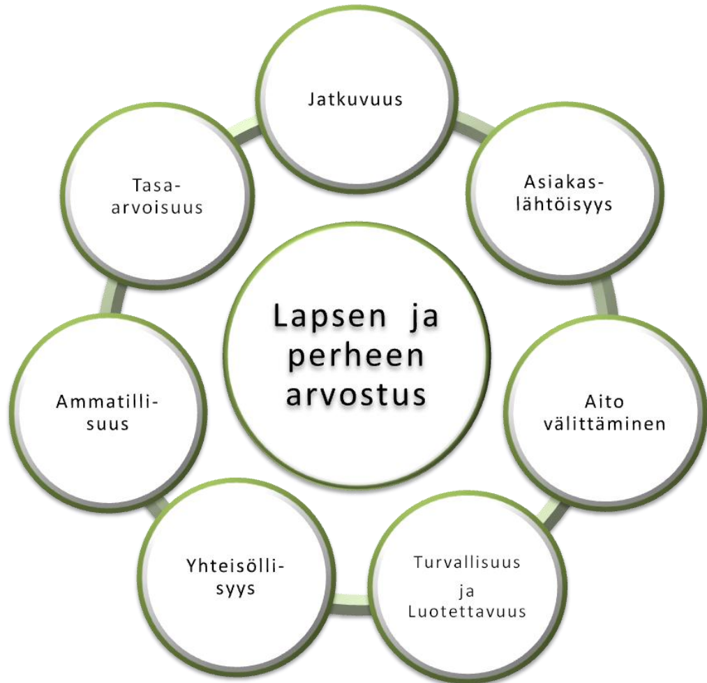
KUVIO 1. Jämsän Nuorisokodin arvot

Nuorisokodin arvojen keskiössä on lapsen ja perheen arvostus (Kuvio 1.). Nuorisokodin arvoja käydään säännöllisesti läpi työntekijöiden yhteisillä kehityspäivillä.