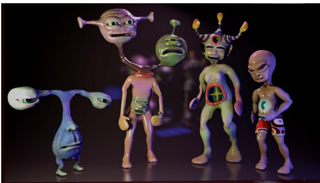
Kuva 5. Pelinäkömää Alien Afterlife -tietokonepelistä.

Visuaalisesti Alien Afterlife on hyvin kiinnostava ja voisin kuvitella tulevaisuudessa palaavani sen pariin. Sen kirjavat maisemat ja eriskummallinen maailma ovat kuin aistiharhoja, jotka pelaaja voi kokea ilman päihteidenkäyttöä. Pelaisin jatkossa hallusinaatio- ja ruumiista irtautumis -simulaattoreita mielelläni lisää. Isoisäni oli kiinnostunut ufoista. Muistan utuisesti hänen ihmetelleen Pääsiäissaaren Moai-patsaita. Hän ilmeisesti epäili niiden olevan avaruusolentojen aikaansaannoksia. Mietin tätä tekstiä kirjoittaessani, että mitköhän isoisäni olisi tästä pelistä ajatellut?