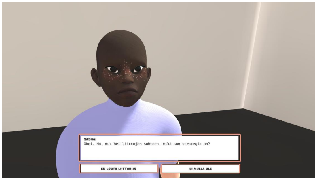
Kuva 6. Pelinäkömää Survivor-tietokonepelistä.