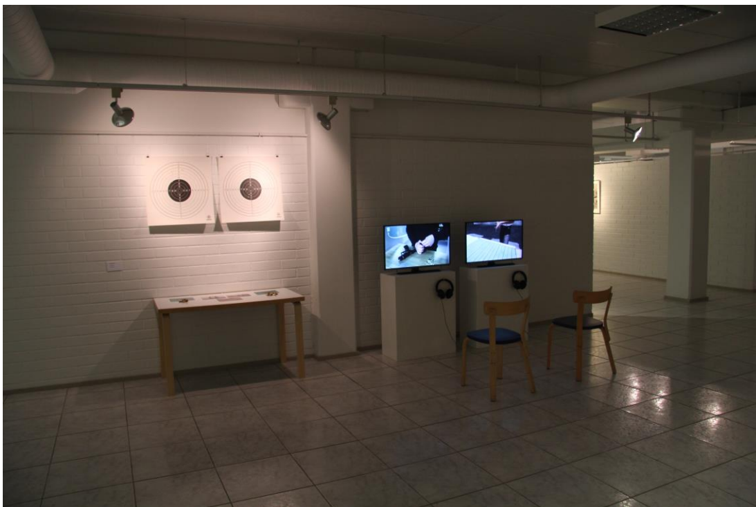
Kuva 7. Wahala, Ilkka: 92 laukausta. Installaatio, 2017

oksessani olen asettanut vierekkäin videodokumentaatiot itsestäni ampu- massa fyysisessä, sekä virtuaalisessa tilassa. Edellä mainittu suoritus tapah- tui Helsingissä Osuvan Albertinkadun ampumaradalla ja jälkimmäinen ArmA III -pelissä (Bohemia Interactive 2013). Vaikkei kyseisen pelivideon grafiikka edes lähentele fotorealismia, saattaa sitä silti erehtyä luulemaan kameralla kuvatuksi. Toisaalta taas ampumaradalla kameralla kuvattu video voi paikoit- tellen vaikuttaa jonkin videopelin kentältä.