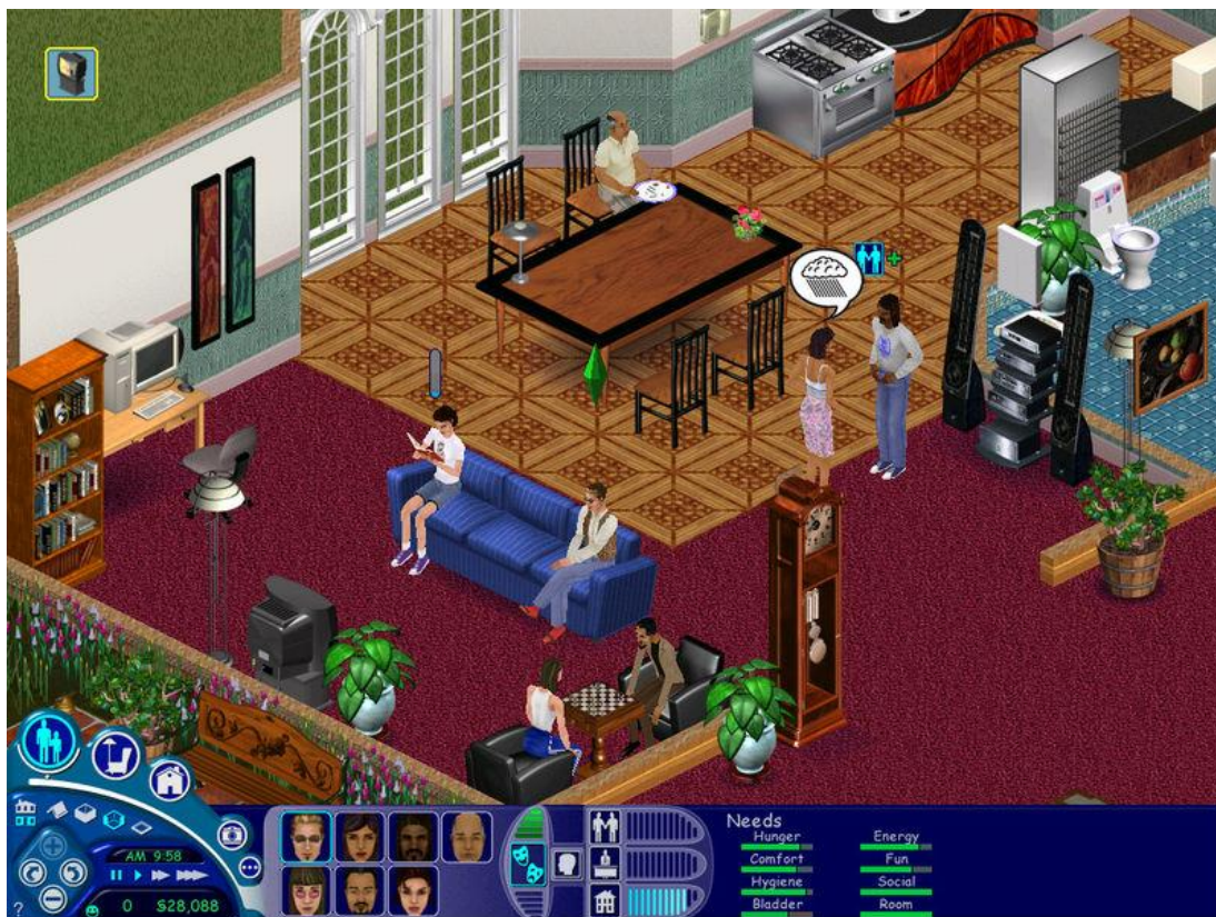
Kuva 2. Ruutukaappaus The Sims -pelistä.