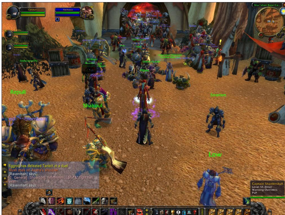
Kuva 3. Ruutukaappaus World of Warcraft -pelistä.