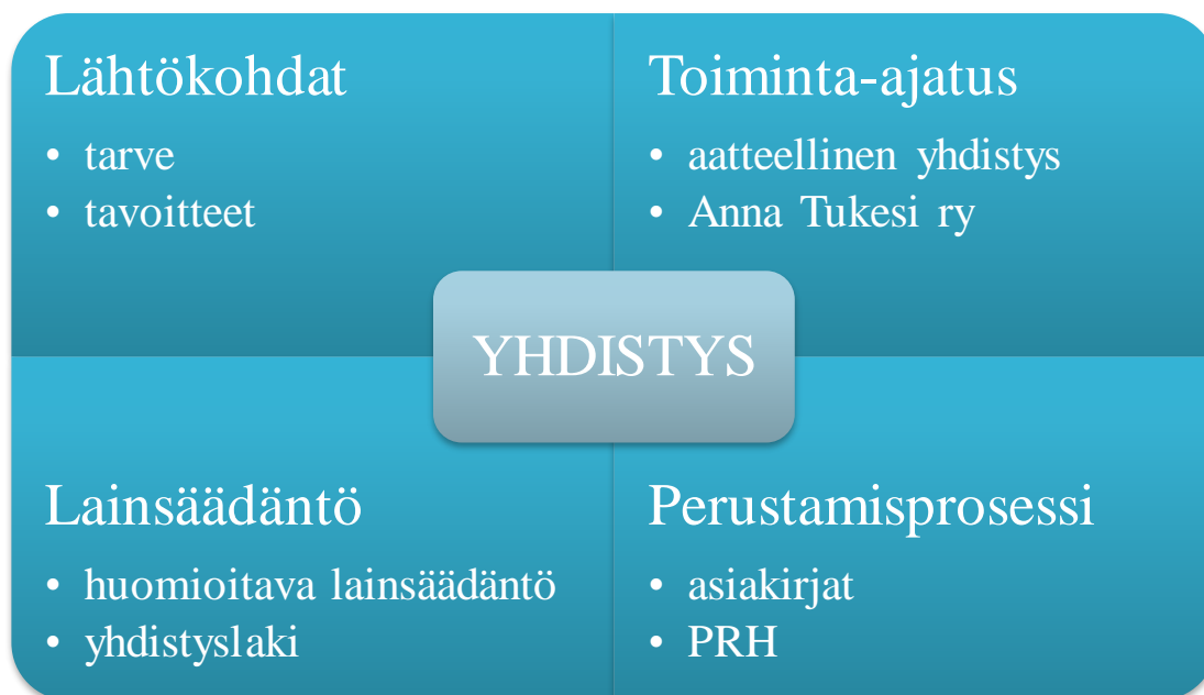
Kuva 1. Opinnäytetyössä käsiteltävä aihealue.