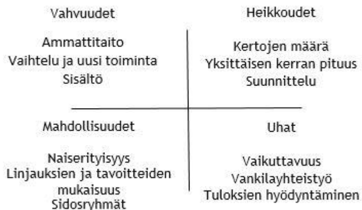
Kuvio 2: Nelikenttäanalyysi ryhmätoiminnasta

Yllä olevassa kuviossa on kuvattu nelikenttäanalyysillä tehty tarkastelu toteutuneesta ryhmätoiminnasta. Tehdyn analyysin perusteella ryhmän vahvuuksia olivat ohjaajien ammattitaito, ryhmän tuottama uudenlainen toiminta ja sen tarjoama vaihtelu naisille sekä sisältö, jossa oli pystytty huomioimaan nais erityisyys. Heikkouksia olivat ryhmäkertojen liian vähäinen määrä ja yksittäisen kerran kesto. Heikkoudet olivat osittain samoja tekijöitä, jotka nousivat esille naistenkin kehitysideoissa. Tämän lisäksi ryhmän suunnitteluun olisi tullut panostaa enemmän.