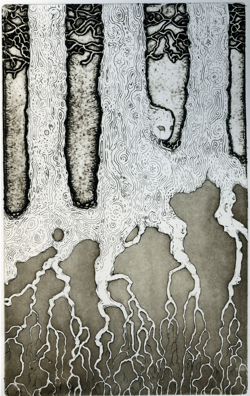
Riikka Puumalainen "Puiden kuviot", 2017 27,2 x 17,2 cm etsaus, akvatinta, pintasyövytys