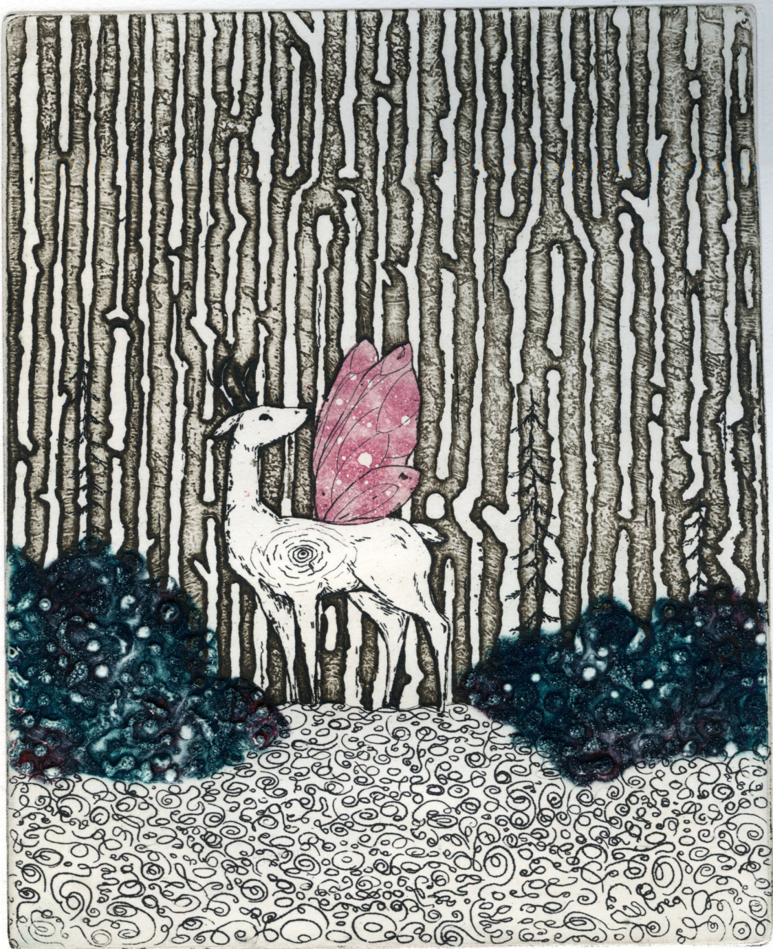
Riikka Puumalainen "Keijupeura", 2017 18 x 14,7 cm etsaus, pintasyövytys, carborundum