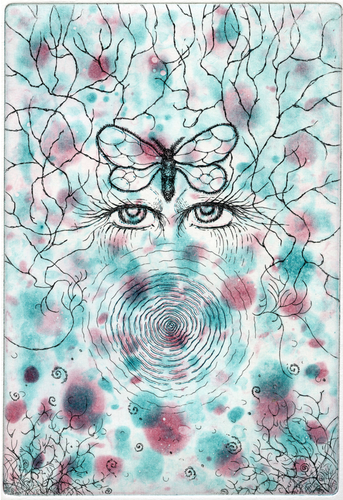
Riikka Puumalainen "Silmät syvällä metsässä", 2017 23,7 x 16,2 cm etsaus, akvatinta