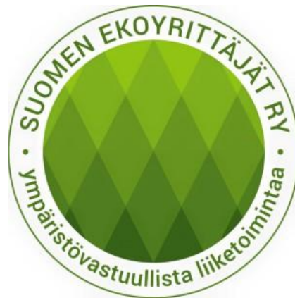
Kuva 4. Suomen Ekoyrittäjät ry- logo (Suomen Ekoyrittäjät ry 2017d)