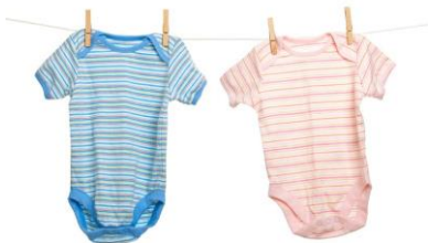
Figure 22. Pojk och flickfärger.

I västvärlden associerar vi ljusblå med pojkar och rosa med flickor. (Maglaty, 2011; Paolotti 2012)