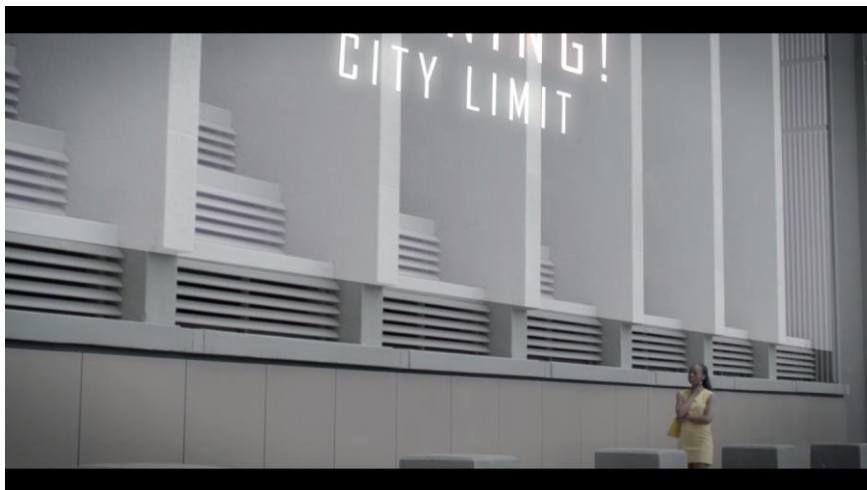
Figur 33. Silvia i gult. Fotograf: Jonas Murstam (Nature, 2015)

GUL representerar känslotillståndet glädje.