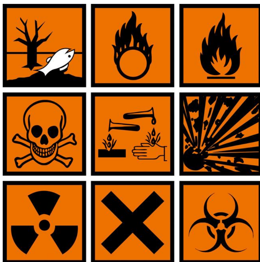
Figur 30. Kemiska varnings symboler.

Orange är färgen för symboler som står för risk/fara när det gäller kemiska ämnen. Att Silvia beger sig in i skogen i en klänning av denna färg är intressant/ironiskt/komiskt? eftersom det samhälle hon representerar är en risk för naturen.