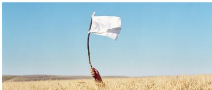
Figur 32. Vit flagga.

Commented [JT83]: Slå till en rad så brödtexten inte är så fast i bilden.