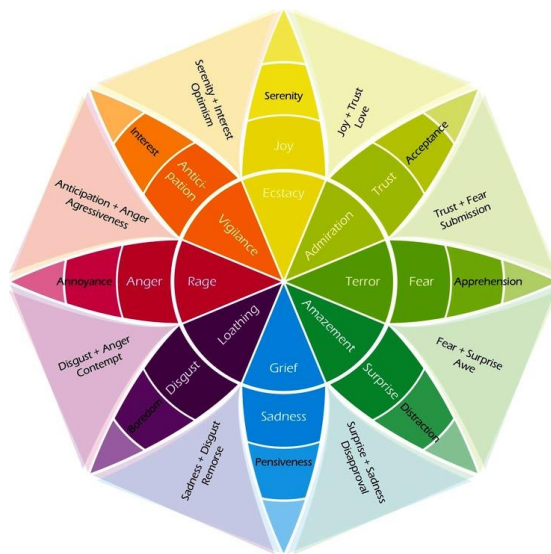
Figur 24. Robert Plutchiks känslorhjul. (användaren zuilserip på reddit 01 Jun 2015 https://www.reddit.com/r/Infographics/comments/380zah/robert_plutchiks_wheel_of_emotions_like_colors_8/ )