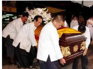
Figur 20. Västerländsk begravning och kinesisk begravning

Commented [JT40]: Denna kommentar hör till bildtexten som var i en konstig låda som inte gick att kommentera. Du saknar parentes runt källhänvisningen.