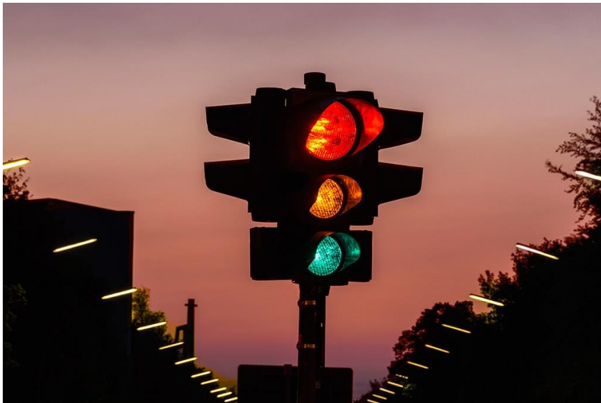
Figur 19. Trafikljus.

Till exempel inom trafiken betyder rött stop, gult betyder varning och grönt betyder gå.