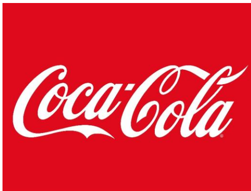
Figur 18. The Coca Cola Company's logo. (Alex Neman, The Logo Company)

Commented [JT38]: Figur på svenska. Kolla även alla andra bildtexter att du skrivit på svenska.