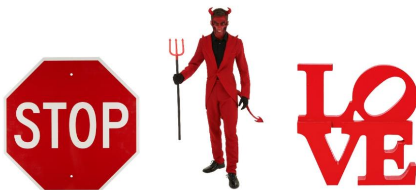
Figur 28. Stop märke, djävul och love sign.

Enligt västerländska normer och färgteori representerar röd passion, styrka, kärlek men även djävulen, stop, fara och stress eftersom synen av rött anses få pulsen att stiga. (Wright, 2008; Andersson, 1984)