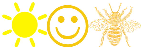
Figur 34. Gul sol. ( openclipart.org ) Gul smiley. ( clipartkid.com ), Gult bi. ( https://encrypted-tbn3.gstatic.com/images?q=tbn:ANd9GcRiWkiuYdCuuDMYi9XKLScl-_kDPb7MyBKN8FmUeto5iltWPIDg )

I naturen representerar gult ofta fara/akta hos t.ex. getingar. Vi kan här jämföra Silvia från scenen ett som är en del av staten i sin röda klänning till Silvia i sista scenen som i sin gula klänning är ett hot mot staten.