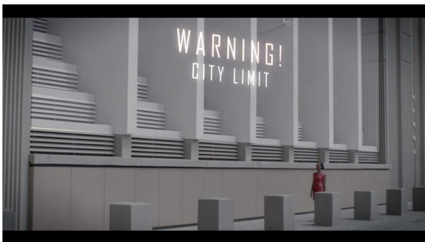
Figur 27. Silvia i röd klänning Fotograf: Jonas Murstam (Nature, 2015)

RÖD symboliserar känslotillståndet frustration.