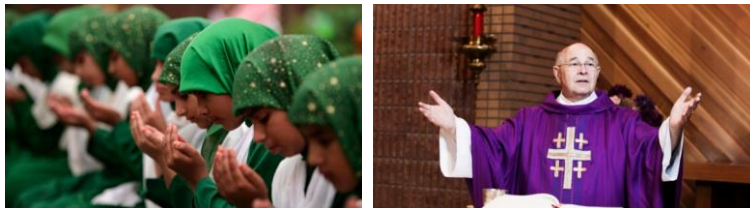
Figur 23. Muslimska flickor i grönt. Lutheranskpräst i lila.

I många länder har även religiösa anknytningar till färg symboliskt värde, t.ex. grön är färgen för Islam (Wright, 2008) och används mycket i moskéer, lila är färgen som används i den Evangelisk-Lutheranska kyrkan på påsken (svenskakyrkan.se) och är därför närvarande i mycket påsk dekorationer i Finland.