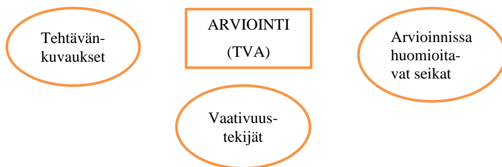
KUVIO 2. Tehtävän vaativuuden arviointijärjestelmä (mukaellen KVTES 2014-2016.)

Kunta-alan palkkausjärjestelmä koostuu tehtäväkohtaisesta palkasta, palvelusajasta, joka maksetaan työkokemuslisänä sekä ammatinhallinnasta ja työssä suoriutumisesta, joka maksetaan mahdollisena henkilökohtaisena lisänä. Joissakin kunnissa on myös käytössä tulospalkkio. Pääpaino palkkauksessa on tehtävien vaativuudessa ja tämä arviointityö perustuu tehtävänkuvauksiin. Tämänkin vuoksi on tärkeää saada kuntamme kasvatusohjaajan työhön virallinen tehtävänkuvaus.