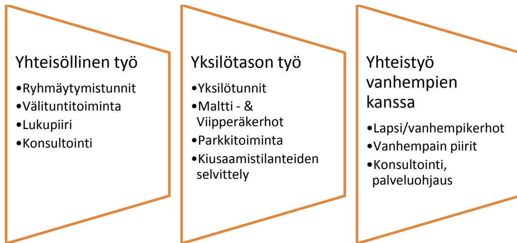
KUVIO 3. Kasvatusohjaajan työn tasoja

Näillä kaikilla tasoalueilla pyritään samaan päämäärään, tukemaan oppilaan sosiaalista hyvinvointia, toimintakykyä ja elämänhallintaa. Kartoitetaan oppilaiden riskitekijöitä ja ohjataan heitä vahvistamaan taitojaan haastavilla osa-alueilla.