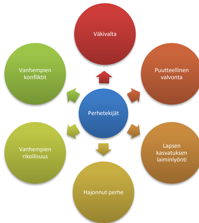
Kuvio 2. Keskeiset perheen riskitekijät (Farrington 2005, Meriläisen 2013, 25 mukaan.)

Opinnäytetyömme kannalta rikollisuuden perhetason tekijät ovat omalta osaltaan tutkimuksen keskiössä. Perhetekijöiden vaikutusta rikollisen käyttäytymisen riskitekijänä on tutkittu paljon. Seuraavaan kuvioon 2. on mallinnettu riskitekijöistä keskeisimmät. (Farrington 2005, Meriläisen 2013, 25 mukaan.)