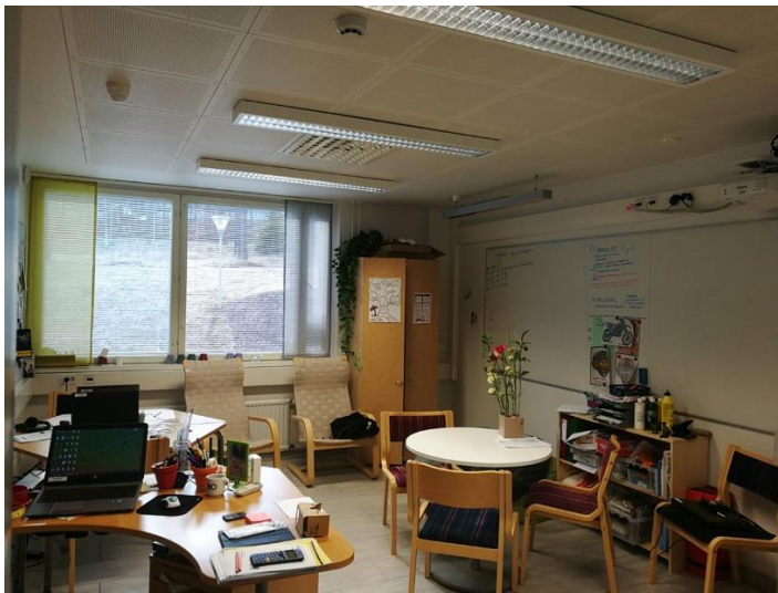
Kuva 1. Valokuva Paussipaikasta

Paussipaikka on yksi Jämsän ammattiopiston ohjaus- ja tukipalveluiden muoto, jota voisi kuvata pajamaiseksi toimintaympäristöksi. Paussipaikka toimii vaihtoehtoisena oppimisympäristönä erilaisia toimintamalleja ja -tapoja hyödyntäen pienryhmässä, pari- tai yksilötyöskentelynä. Paussipaikan fyysisenä tukikohtana toimii sosiaali- ja terveystalon rakennuksessa yksi pienluokka, joka on sisustettu viihtyisäksi ja helposti muokattavaksi.