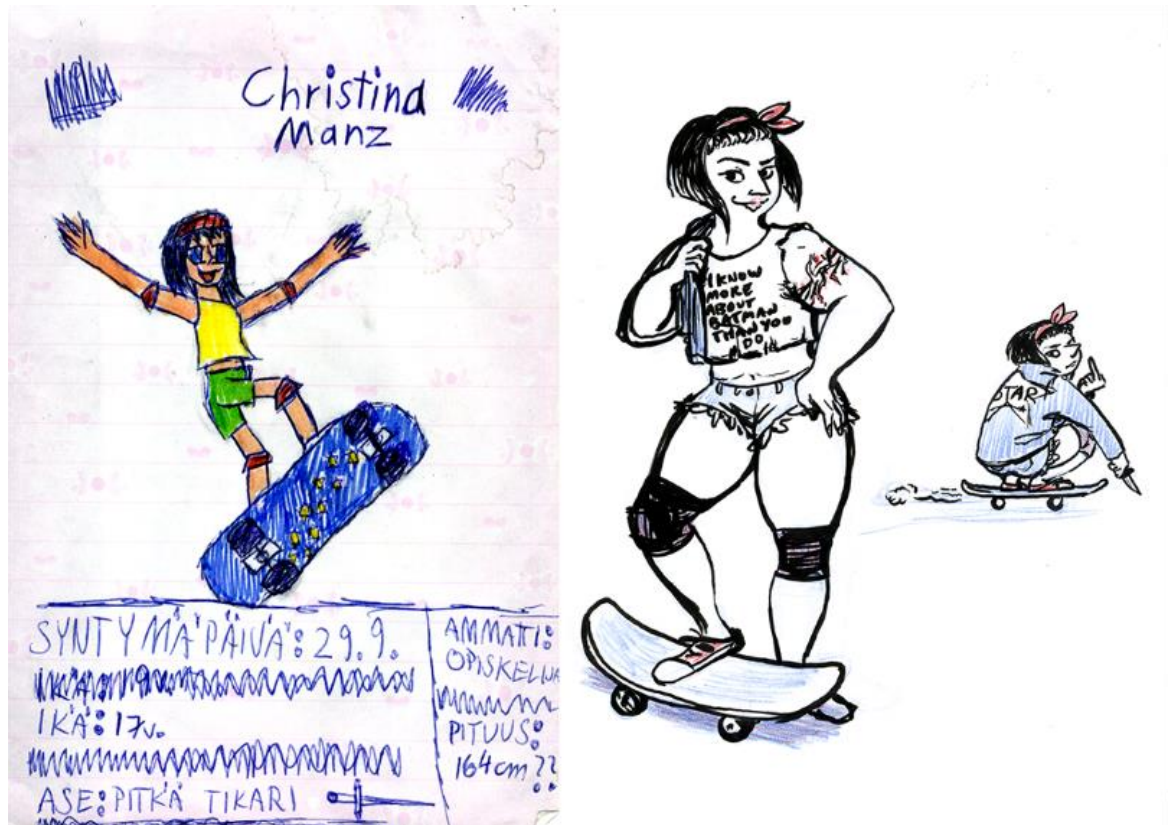
Kuva 5. Varhainen hahmosuunnitelma, josta tein pikaisen päivitetyn version huhtikuussa 2017. Pyrin rakentamaan hahmon annetusta tiedosta.

Mielestäni on siistiä ja kiinnostavaa nähdä, miten hahmot elävät vierellä ja miten kaikki muutokset ja tyyliaikakaudet kerääntyvät kerroksiksi. Niistä voi nähdä oman näkökulmansa, ja miten on muuttunut noiden kerrostumien välillä. Koehlerin pohdinta havainnointikyvyistä on tuttua, ja luulen sen olevan relevanttia monien hahmosuunnittelijoiden kohdalla. Palaan vanhojen hahmosuunnitelmien pariin usein nähdäkseni, miten erilaisesti tarkastelen heitä sen hetkisellä tieto- ja taitotasollani. Saan uudelleen suunnittelusta myös henkistä tyydytystä, ikään kuin olisin onnistunut antamaan heille uuden elämän. Koen vanhojen hahmojen tarkastelusta ja uudelleen suunnittelusta olevan apua hahmosuunnittelijalle. Se auttaa tiedostamaan, missä taidot ovat kehittyneet vuosien varrella, sekä ymmärtämään hahmosuunnittelun parissa kuljetun matkan ja sen merkityksen. Tällöin voidaan estää tilanne, jossa omalle kehitykselleen ja taidoilleen sokeutunut ei osaa tarkastella itseään rakentavasti ulkopuolisen silmin.