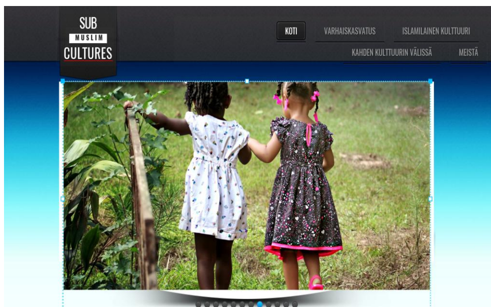
Kuva 1. Subcultures etusivu

Verkkosivuston aineiston valinnassa keskityin hakemaan tietoa muslimien tavallisesta arjesta, tavasta pukeutua, kommunikoida, viettää juhlapäiviä ja syödä. Islamin juuriin paneutumisen koin menevän paitsi laajaksi, mutta myös ohi aiheen, jonka tarkoituksena on perehdyttää työntekijää muslimimaahanmuuttajan arkeen. Aineistoon keräsin tietoa muslimin perusarkisista asioista juhlapäiviin, jonka tarkoituksena on muodostaa verkkosivuston sisällön. Eri aineistojen avulla saatua tietoa pyrin valitsemaan tarkasti ja tarkistaen asian paikkansapitävyyttä muista olemassa olevista lähteistä. Erityisesti internetlähteitä on tarkistettu muista kirjallisuuslähteistä. Aineiston sisältöjen pohjalta rakentuneita tapakulttuurin eri teemoja on viety sivustoon sellaisenaan, joskin tekstiä helppolukuisemmaksi muokaten.