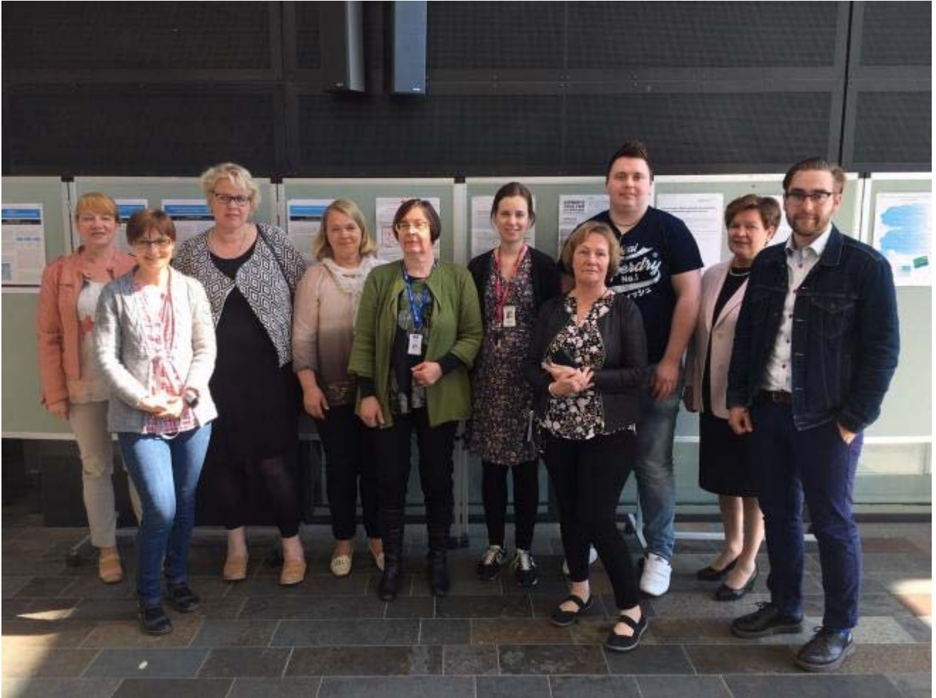
Kevään DeDiWe-hankeen seminaari välitettiin kaikille osallistujille verkossa. Arcadassa paikalla oli luennoitsijoita, hankekumppaneita, lehtoreita ja opiskelijoita.