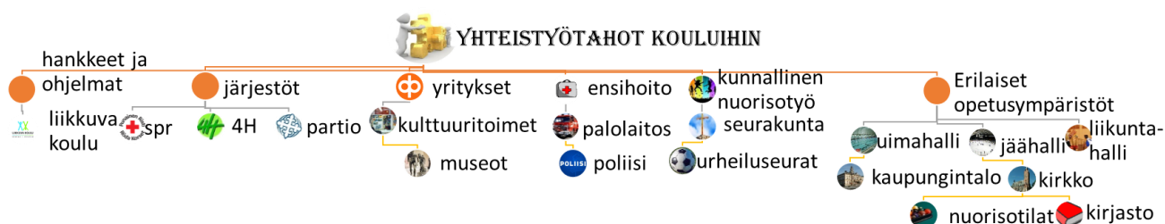
Kuvio 1. Koulun yhteistyömahdollisuudet.

Koulut tekevät yhteistyötä erilaisten toimijoiden kanssa, jotka ovat kuvattuna kuviossa 1. Lisäksi kuviossa 1 on kuvattu mahdollisuuksien kirjo erilaisista oppimisympäristöistä. Erilaisten yhteistyötahojen kanssa on mahdollisuuksia muuttaa opetusta käytännönläheisempään ja toiminnallisempaan muotoon. Yhteistyötahot voivat järjestää teemapäiviä, vierailuja tai he voivat tulla pitämään oppitunnin heidän työtään koskevasta aiheesta. Opinnäytetyössäni keskityn vain yläkoulujen ja nuorisotyön yhteistyöhön, toiminnallisuuden ja fyysisen aktiivisuuden lisäämisen näkökulmasta. Nuorisotyön monimuotoinen työote, ohjaamistaito ja nuorten kohtaamistaito ovat hyvä lisä opettajien vankkaan opetustaitoon. Yhdessä näillä tahoilla on enemmän mahdollisuuksia tuottaa oppilaille kouluympäristöstä ja erilaisista opetusmenetelmistä oppilaita aktiivisia ja toiminnallisempia oppimiskokemuksia.