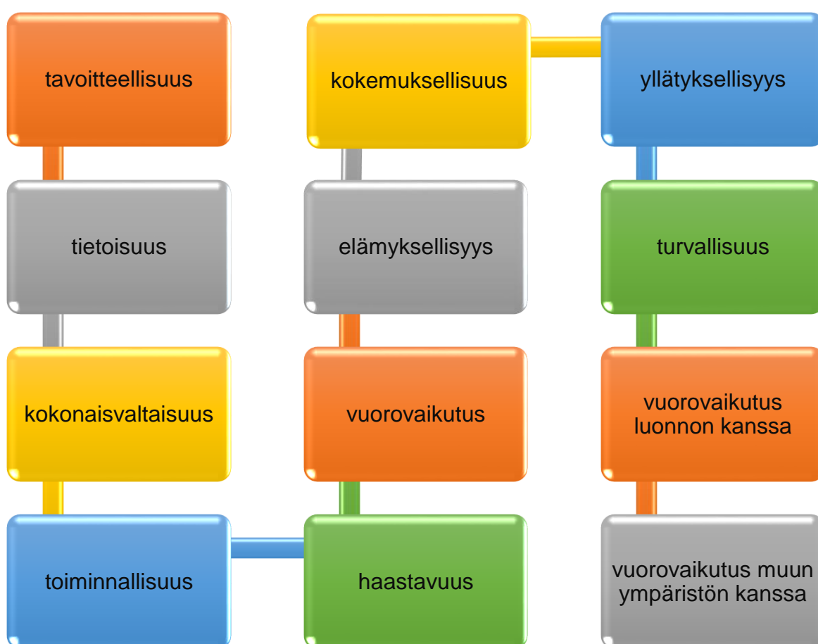
Kuvio 2. Seikkailukasvatuksellista toimintaa määrittävät tekijät. (Kivelä & Lempinen 2009, 19.)

ottamista ja koetun pohdintaa. Seikkailukasvatuksessa painottuu ryhmätoiminnan ja yksilön kohtaamisen merkitys (Pulkamo 2007, 498). Seikkailukasvatukselle on löydetävissä useita määritelmiä. Seikkailukasvatusta voidaan luonnehtia oppimisen prosessiksi, jossa mahdollistuu uudet ajattelu- ja toimintatavat toiminnan ja reflektoinnin kautta. (Kivelä & Lempinen 2009.) Seikkailukasvatuksen teoria- ja menetelmäpohjia voi käyttää hyvin toiminnallisuuden luomisessa, sen harjoittelemisessa ja aloittamisessa. Kuviossa 2. olen kuvannut seikkailukasvatuksellista toimintaa määrittävät asiat, joita Kivelä & Lempinen (2009), pitävät seikkailukasvatuksen reunaehtoina ja määritelminä. Kuviossa 2. mainitut tekijät ovat sellaisia, jotka ovat tärkeitä tekijöitä oikeastaan kaikenlaisessa toiminnallisessa tekemisessä. Toiminnalliset menetelmät muodostuvat, kun nämä tekijät otetaan huomioon. Silloin saadaan osallistujat aktivoitua ja tuotettua osallistujille mielekäs oppimiskokemus.