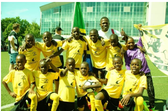
FC Vito Boys Lindi Rural 2017 Helsinki Cupissa.

Joukkueet viettävät noin kaksi viikkoa Suomessa. Ensimmäinen viikko harjoitellaan Eurassa Euran Pallon vieraana. Noin viikon harjoittelun jälkeen FC Vito -joukkue matkustaa Helsinkiin, missä pelataan jalkapalloturnaus. Suoritin syventävän harjoitteluni vuoden 2017 FC Vito Lindi Rural -joukkueen parissa ja vietin tiimin kanssa mahtavat kaksi viikkoa. Tansanialaisille nuorille mahdollisuus osallistua turnaukseen Suomessa on ainutlaatuinen kokemus. Monet pelaajista eivät olleet ennen matkaa poistuneet kotikyläänsä pidemmälle. (mt.)