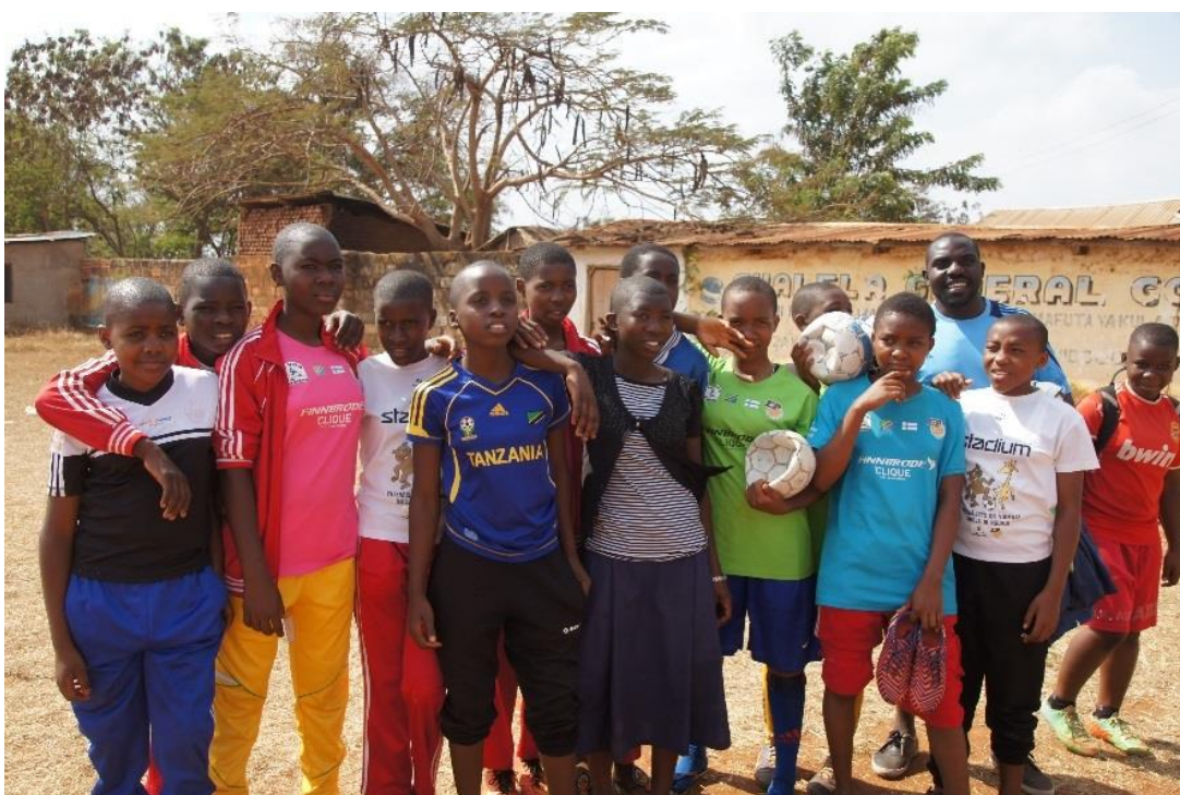
FC Vito Girls Nachingwea 2016.

Yksi suurimmista FC Vito -projektin haasteista on, kuinka tehdä toiminnasta kestävää ja saada nuoret jatkamaan urheilua sekä opiskelua. Kun matkustin syksyllä 2017 Tansaniaan haastattelemaan pelaajia, niin Mtaman, Nachingwean, Ruangwan, Kilwan sekä Lindi Ruralin FC Vito -joukkueet harjoittelivat vielä kaikki yhdessä. Vanhemmat olivat kiitollisia, kun he tiesivät mitä lapset tekevät ja missä he ovat, kun oli jalkapalloharjoituksia. Vanhempien mukaan lapset ovat turvassa riskikäyttäytymiseltä ja tytöt eivät tule raskaaksi teineinä niin kauan kun he ovat osa joukkuetta. Haastatelluissa kävi ilmi, että vanhemmat todella toivovat ohjelman jatkuvan ja useat vanhemmista ehdottivat, että nuorille olisi hyvä järjestää FC Vito -leirejä, missä he voisivat jakaa hyviä muistoja ja kokemuksia muiden pelaajien välillä.