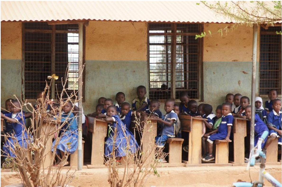
Ala-asteen oppilaita Kilwassa.

Hyvin koulutetut ja pätevät opettajat korreloivat luonnollisesti myös opetuksen laatua. Vuonna 2013 Dar es Salaamissa oli yli 11 000 opettajaa, joilla oli diplomin paperit. Vertailun vuoksi Lindin läänissä toimi alle 200 opettajaa, joilla oli vastaava opettajan-koulutus. Tämä antaa ymmärtää, että alueet, missä on korkealuokkaista taloudellista kehittymistä, on myös parempi mahdollisuus ammatilliseen kehittymiseen. (Ministry of education and vocational training 2014, 39.) Lasten koulunkäyntiä heikentää opetuksen heikon laadun lisäksi myös koulujen puute sekä ylisuuret luokkakoot (Ulkoministeriö 2013), opettajia ei aina ole riittävästi ja siksi koulunkäynti keskeytyy liian monelta (Virtanen 2013, 33).