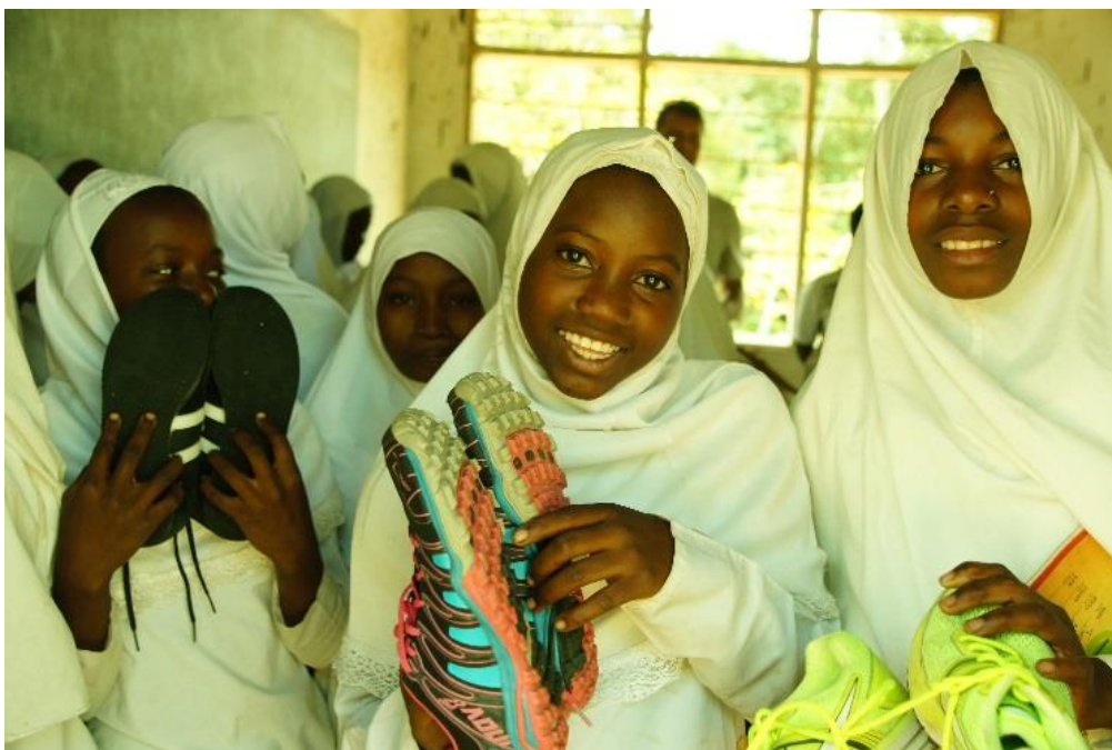
SDA:n jakamia käytettyjä kenkiä Suomesta.

Suuri osa SDA:n rahoituksesta tulee LiiKe ry:ltä (Suomen ulkoministeriöltä) ja urheiluvälineitä saadaan lahjoituksina Suomesta asti. Paikalliset sekä suomalaiset sponsorit kustantavat Helsinki Cupiin lähtevän joukkueen kulut sekä joitain pienempiä tapahtumia. SDA on eteläisen Tansanian alueella melko tunnettu ja se tekee yhteistyötä paikallisten viranomaisten kanssa. (mt.)