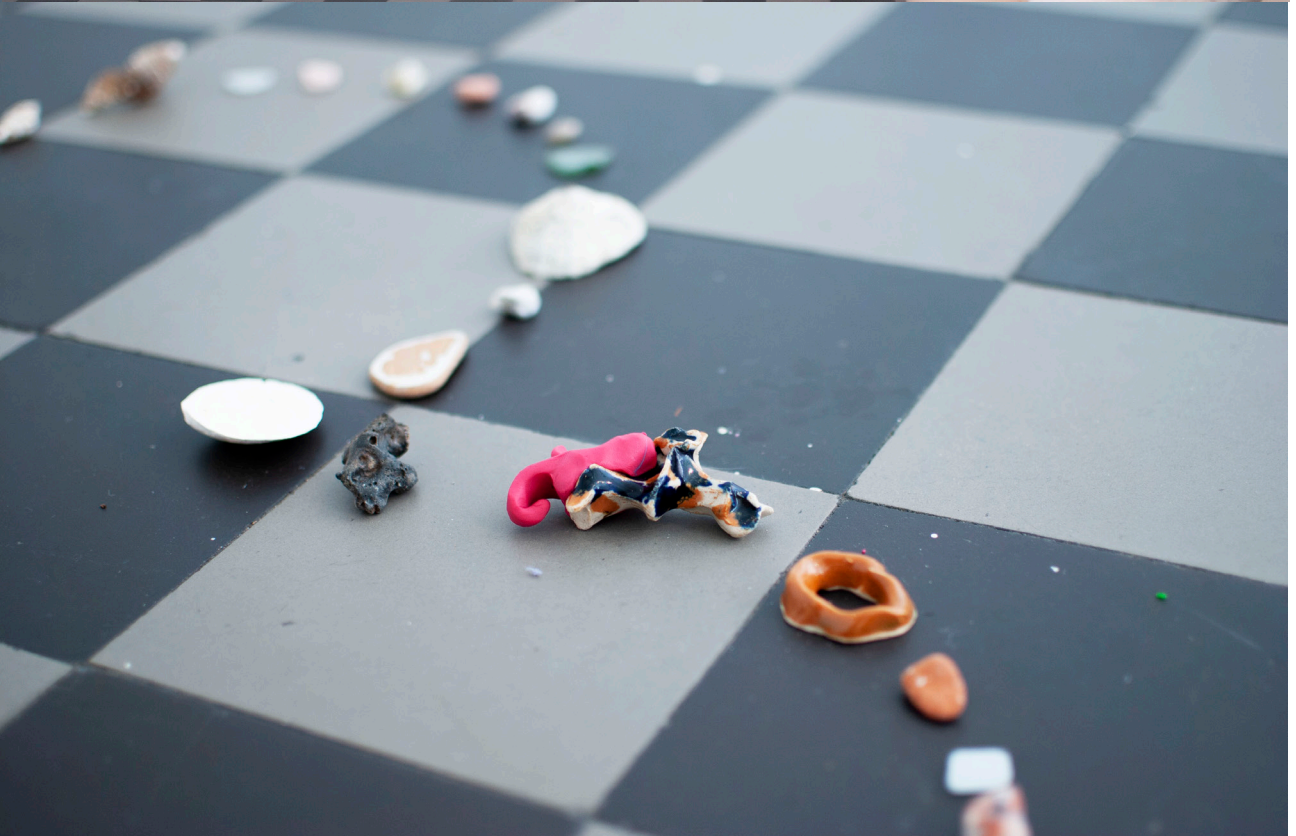
Kuva 4 ja kuva 5: haus de pnojekt: Happy Dirt Bay (2018), B-galleria, Turku.