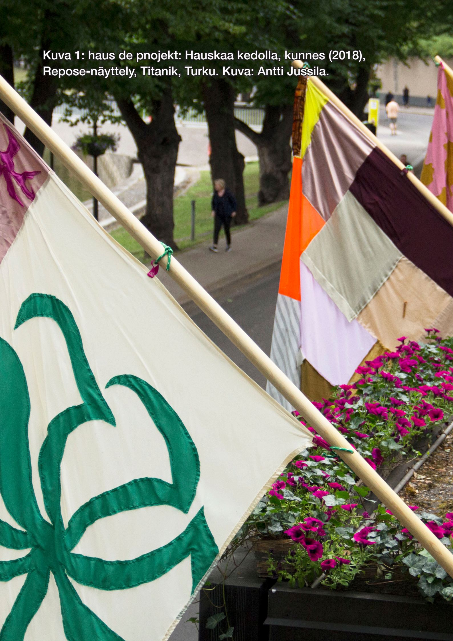
Kuva 1: haus de projekt: Hauskaa kedolla, kunnes (2018), Repose-näyttely, Titanik, Turku.