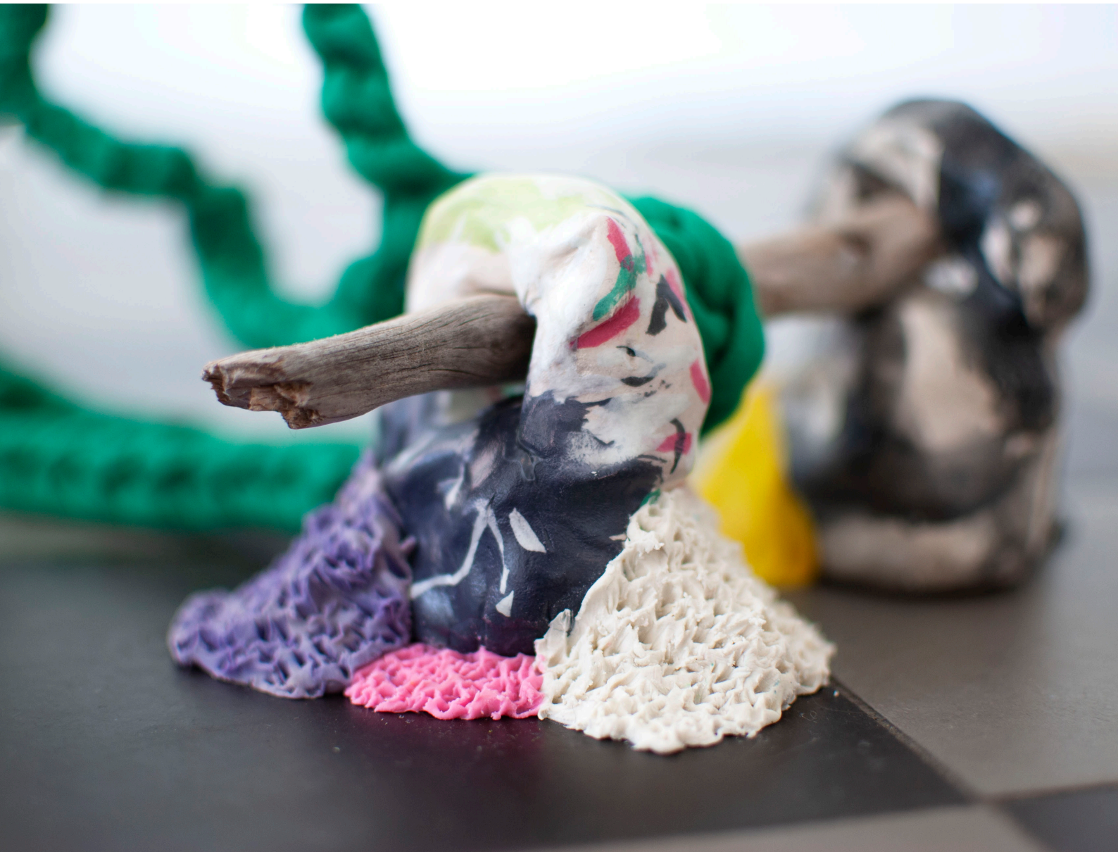
Kuva 2: haus de pnojekt: Happy Dirt Bay (2018), B-galleria, Turku.