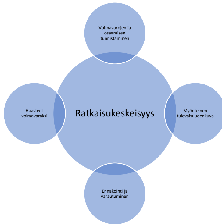
Kuvio 2. Ratkaisukeskeisyyden osa-alueet (Valtiokonttori 2005).

Ratkaisukeskeisessä ajattelutavassa keskitytään käytössä olevien voimavarojen tunnistamiseen sekä hyödyntämiseen, ennakoimaan hankaluuksia ja varaudutaan niihin mahdollisimman hyvin. Esiin nousseet haasteet käännetään tavoitteiksi ja voimavarat keskitetään myönteisiin asioihin. Yksi tärkeimmistä asioista ratkaisukeskeisessä ajattelutavassa on luoda myönteistä tulevaisuudenkuvaa kehitettävästä asiasta ja keskittyä myönteisiin muutoksiin. (Valtiokonttori 2005, 2.)