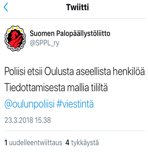
Kuva 1. Kaksi Raksilan koulu-uhkatilanteeseen liittyvää Twitter-viestiä.