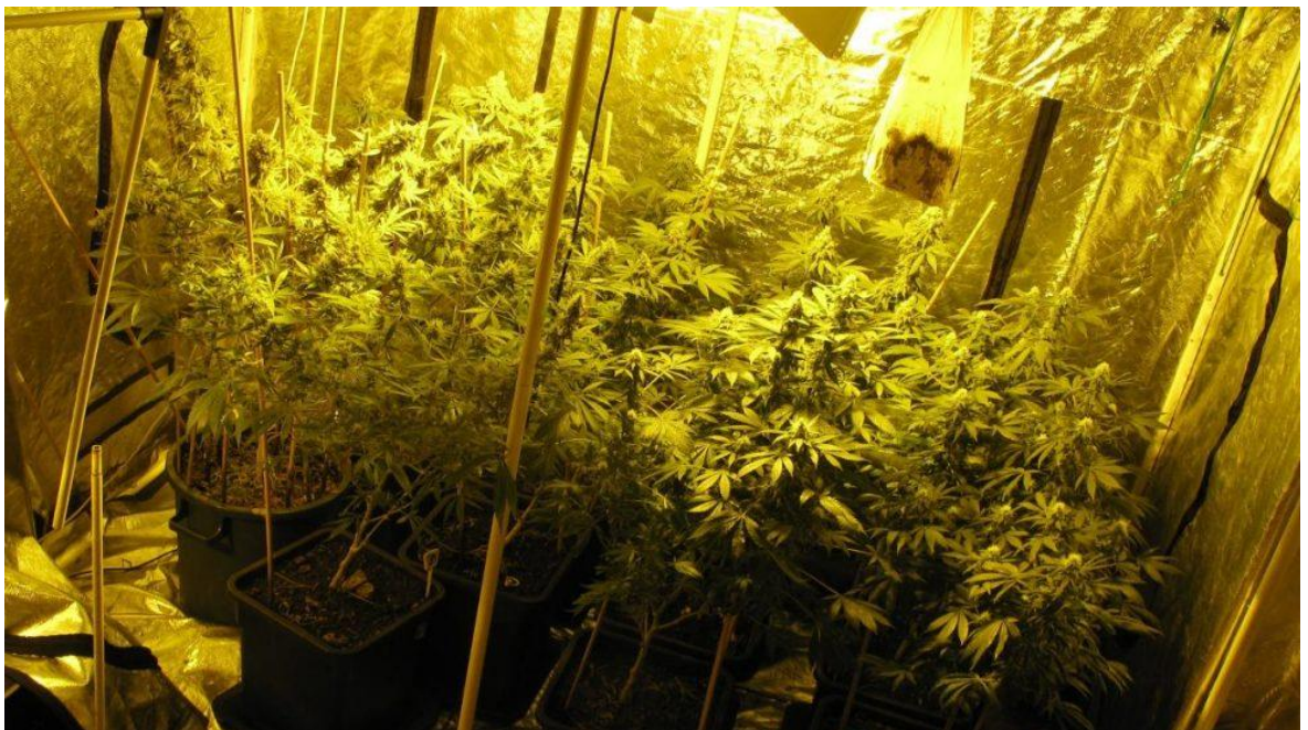
Kannabiksen kasvusteltta (Hämeen sanomat, 25.6.2018)

Alla olevassa kuvassa näkyy hyvin teltassa kasvaneet Cannabis sativa kasvit. Kuva on Hämeen sanomista ja liittyy tapauksessa kerrottavaan kannabiksen kotikasvattamo - oikeustapaukseen. Tapaus on mielenkiintoinen, sillä siinä kannabiksen kasvattamisen katsottiin olleen ammattimaista. Tuomiossa 127 cannabis kasvin tuotoksi arvioitiin peräti 3175 grammaa. (Hämeen sanomat, 25.6.2018.)