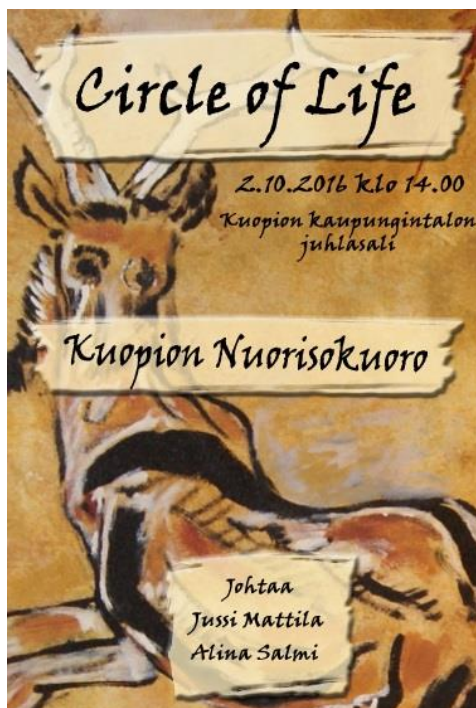
Kuva 12. Ote käsiohjelman kansilehdestä.