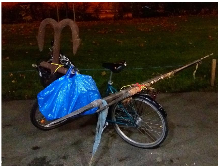
Kuva 13. Rekvisiitankuljetusmatka.

esityksen aikana rekvisiittaa ja asuja vaihdettiin kappaleiden teemojen mukaisesti. Esimerkiksi antiikin Kreikkaan liittyvissä kappaleissa kuorolaisilla oli päällään lakanasta käärityt toogat. Yksi kuorolaisista oli ottanut vastuulleen varmistaa, että kaikille kuorolaisille oli lakanat. Hän oli selvittänyt ja opetti muille, kuinka toogat kääritään parhaiten. Konserttipäivänä kuorolaiset tekivät kasvomaalauksia itselleen ja toisilleen. Koin erilaisten asujen ja rekvisiitan sopivan tähän konserttiin (ks. Kuva 14). Nuoret tuntuivat olevan innoissaan, kun saivat pukeutua ja laittautua konserttia varten. Mielestäni yhdessä tekeminen myös lisäsi kuorolaisten yhteenkuuluvuuden tunnetta.