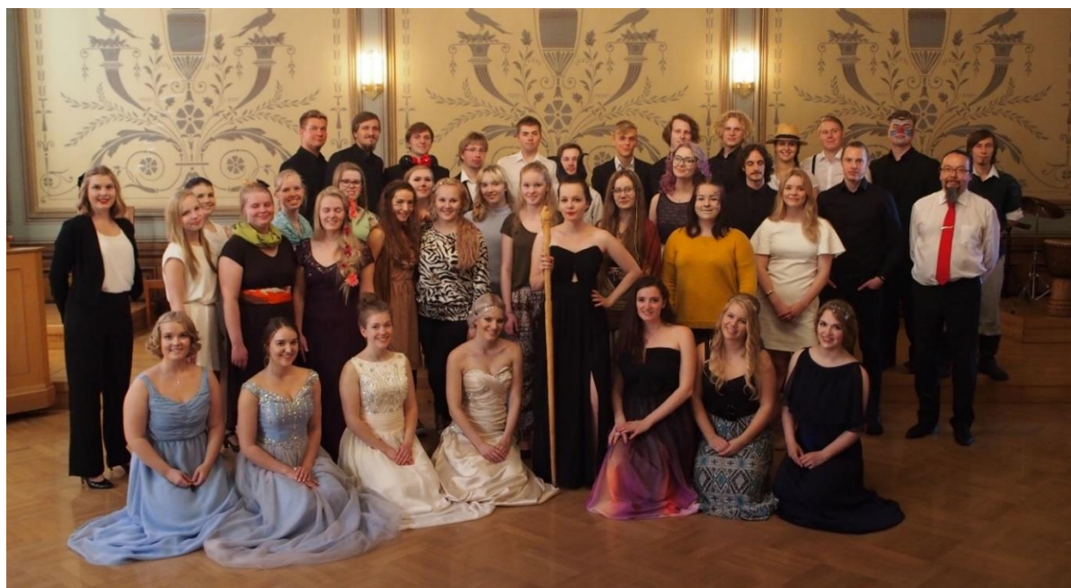
Kuva 14. Kuopion Nuorisokuoro konsertin jälkeen.

esityksen aikana rekvisiittaa ja asuja vaihdettiin kappaleiden teemojen mukaisesti. Esimerkiksi antiikin Kreikkaan liittyvissä kappaleissa kuorolaisilla oli päällään lakanasta käärityt toogat. Yksi kuorolaisista oli ottanut vastuulleen varmistaa, että kaikille kuorolaisille oli lakanat. Hän oli selvittänyt ja opetti muille, kuinka toogat kääritään parhaiten. Konserttipäivänä kuorolaiset tekivät kasvomaalauksia itselleen ja toisilleen. Koin erilaisten asujen ja rekvisiitan sopivan tähän konserttiin (ks. Kuva 14). Nuoret tuntuivat olevan innoissaan, kun saivat pukeutua ja laittautua konserttia varten. Mielestäni yhdessä tekeminen myös lisäsi kuorolaisten yhteenkuuluvuuden tunnetta.