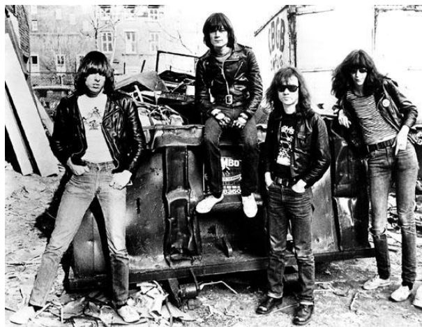
KUVIO 1. Ramones (Line 1997).

hakaneula. Tyttöjen pukeutumisen hajonta oli suurempaa. (Söderholm 1987, 54.) Itsetekemisen idea näkyi punkmusiikin lisäksi pukeutumisessa: nahkatakkeja kustomoitiin liittämällä niittejä, bändimerkkejä ja rintanappeja. (Polhemus 1994, 90.) Myös yhtyeiden tyyliä jäljiteltiin jonkin verran. Yhdysvaltalaisen Ramonesin tyylistä muodostui univormu kannattajien keskuudessa ja sitä näkee vielä nykyäänkin. Ramones tyyliin kuuluivat kapealahkeiset farkut, tennarit ja nahkatakki (ks. kuvio 1).