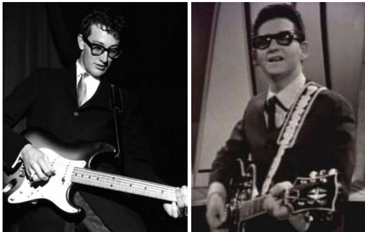
KUVIO 5. Buddy Holly (vas.) (Francis, B.) ja Roy Orbison (oik.) (The Heart of Rock and Soul - Roy Orbison).

Video alkaa esiripun sivuun vetämisellä ja Elvistä muistuttavan henkilön lii- kehennällä. Kuva on mustavalkoinen ja tarkasti katsomalla Elvis paljastuu RHCP:n keulahahmoksi, Anthonyksi. Vanhaan rock and roll pukeutumiseen kuului puku. Myöhemmin, osaksi Marlon Brandon ja James Deanin vaikutuk- sesta, rockabilly tyyliin kuului myös farkku- ja nahka-asut (Polhemus 1994, 43). Seuraavaksi siirrytään Flean edellä mainittuun britti-invaasion aikaan. Sieltä video nostaa esiin Buddy Hollya muistuttavan silmälasipäisen henkilön. Vaikkakin Buddy Holly oli amerikkalainen laulaja ja lauluntekijä, katsotaan hä- nen vaikuttaneen suuresti brittiläisten The Beatlesin ja The Rolling Stonesin musiikkiin (Buddy Holly 2006). Jo The Beatlesin nimi on kunnianosoitus Buddy Hollyn The Crikets -yhtyeelle. The Beatles esiintyi alkuaikojen nahka-asujen jälkeen usein puvuissa. Toisaalta RHCP jäsenissä on videolla myös toisen yhdysvaltalaisen artistin, Roy Orbisonin, jonka tavaramerkiksi nousivat juuri silmälasit, näköä.