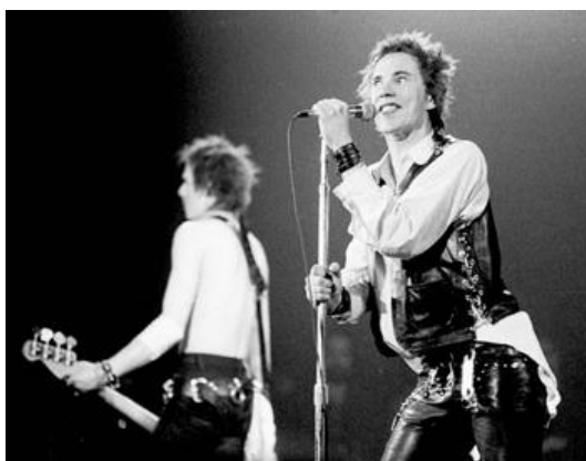
KUVIO 8. The Sex Pistols (1978 Sex Pistols).

Iggy Popin jälkeen lavan taakse on levitetty Britannian lippu ja lavalle näyttäisi nousseen ehkä Britannian tunnetuin punkrockyhtye The Sex Pistols. Ajallisesti ollaan 70-luvun loppupuolella. Viittauksen The Sex Pistolsiin tunnistaa pukeutumisen lisäksi aggressiivisuutta ja toisaalta ilveilyä huokuvasta lavaesiintymisestä (Ks. Söderholm 1987, 72). Yhtyeen laulajalla Johnny Rottenilla on keikkataltioinneissa usein yllään valkoinen paitapusero, kuten Kiedisillä videossa.