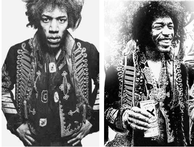
KUVIO 6. Jimi Hendrix

Video esittelee seuraavaksi funk-tyylin. Basisti Flea on siinä pukeutunut Bootsy Collinsin näköiseksi. Funkin suurien nimien lavaesiintymiseen liittyi usein hassut asut ja he usein näyttivätkin toisesta galaksista tulleilta avaruusolioilta (Polhemus 1994, 73). Videossa tätä mielikuvaa tukien lavalle laskeutuu ufo.