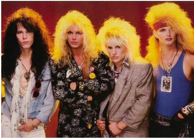
KUVIO 10. Poison (Images of The Man).

Seuraavaksi RHCP:n jäsenet astuvat Hair Metal -yhtyeen rooliin. Yhtye muistuttaa erehdyttävästi yhdysvaltalaisista Poison -yhtyettä. Ajallisesti siirrytään 80-luvun puoliväliin. Heidän pukeutumisensa on glamrock -henkistä. Yhtyeen yllä nähdään eläinkuoseja, tiukkoja vaatteita, asusteiden runsautta, vahvoja meikkejä ja kirkkaita värejä.