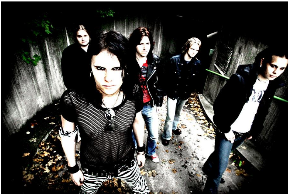
KUVIO 19. Rogue Angel. Promo 2006. (Kautto, J.).