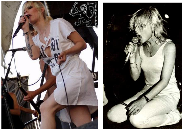
KUVIO 2. The sounds (vas.) ja Deborah Harry 1977 (Blondie - Cautious Lip).