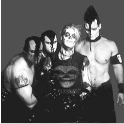
KUVIO 9. Misfits (Chart Magazine 1999).

Seuraavaksi RHCP:n jäsenet astuvat Hair Metal -yhtyeen rooliin. Yhtye muistuttaa erehdyttävästi yhdysvaltalaisista Poison -yhtyettä. Ajallisesti siirrytään 80-luvun puoliväliin. Heidän pukeutumisensa on glamrock -henkistä. Yhtyeen yllä nähdään eläinkuoseja, tiukkoja vaatteita, asusteiden runsautta, vahvoja meikkejä ja kirkkaita värejä.