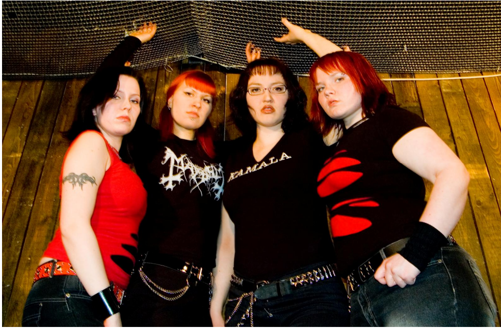
KUVIO 21. Kamala. Promo 2006. (Erkkilä, S.).