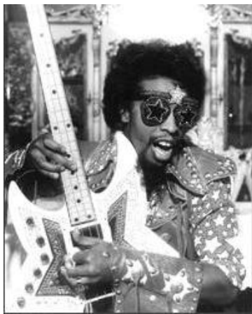
KUVIO 7. Bootsy Collins.

Video esittelee seuraavaksi funk-tyylin. Basisti Flea on siinä pukeutunut Bootsy Collinsin näköiseksi. Funkin suurien nimien lavaesiintymiseen liittyi usein hassut asut ja he usein näyttivätkin toisesta galaksista tulleilta avaruusolioilta (Polhemus 1994, 73). Videossa tätä mielikuvaa tukien lavalle laskeutuu ufo.