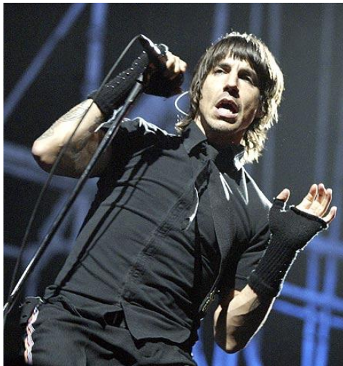
KUVIO 11. Anthony Kiedis (Montes, M. 2003).

Lopuksi bändi saapuu lavalle Red Hot Chili Peppersinä. Heidän oma pukeutumistyyli on melko tavallista ja vaatimatonta eikä edusta tiettyä tyyli-suuntausta yhtä selvästi kuin videolla läpikäytyt aikakaudet. Heidän tyyliinsä on vain yksi esimerkki rockbändin tyylistä 2000-luvulla. Kiedis on pukeutunut mustaan paitaan ja mustiin, vajaamittaisiin housuihin. Myös sukat, tennarit ja sormetomat hanskat ovat mustat ja kaulassaan hänellä on puna-musta kravatti. Kiedisin tyyliissä voi nähdä punkrockvaikutteita. Esiintymisasut ovat yleensä samaa pelkistettyä linjaa: Kiedisillä väreinä toistuvat pääosin musta, valkoinen ja punainen, ja vaatteet ovat usein perusvaatteita. Kitaristi Frucianten tyyli muistuttaa grunge -tyyliä ruudullisine flanellipaitoineen. Flea usein esiintyy ilman paitaa, ja rumpali Smithin tunnusmerkiksi on muodostunut väärinpäin käännetty lippalakki, mikä huokuu poikamaisuutta. Lavaesiintymisessä on energiaa. Bändin tyyli on muuttunut vain hiukan ajan kuluessa. Tosin aikoinaan RHCP esiintyi usein ilman vaatteita vain sukka strategisten paikkojen suojana.