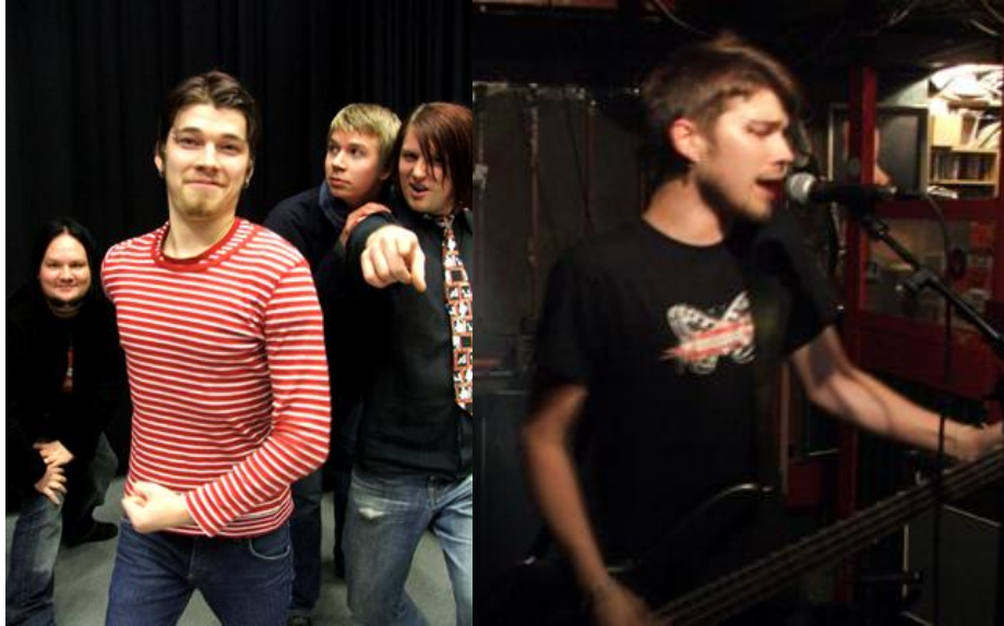
KUVIO 17. Turpo. Promo 2005 (vas.) ja keikalla (oik.) (Lapio, P).

musta t-paita, bändipaita tai musta kauluspaita. Pukeutuminen ei muuten juuri eroa tavallisesta pukeutumisesta, vaan eron tekee Petruksen mukaan enemmän tunnelma. Keikkamatkoilla mukavuus on tärkeää, matkat tapahtuvat autolla. Vaatteet kuitenkin vaihdetaan keikkapaikalla ennen keikkaa. Turpon jäsenten mielestä tämä korostaa sitä, että paikalle on tultu yleisöä varten ja vaatteiden vaihto tekee tilanteesta erityisen. Ennen keikkaa siis liikutaan yleisössä eri vaatteissa kuin missä nouseaan lavalle.