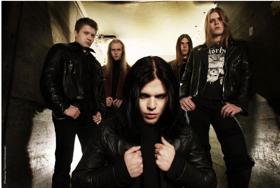
KUVIO 20. Machinen Men. Promo 2005. (Anttonen, T.).

kantajalleen ja osalla bändin jäsenistä ei ole tietoa itselle sopivista malleista. Tässä ulkopuolinen voisi auttaa.