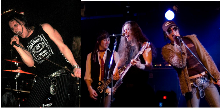
KUVIO 18. Rogue Angel keikalla. (Oikealla oleva kuva Erkkilä, S.).