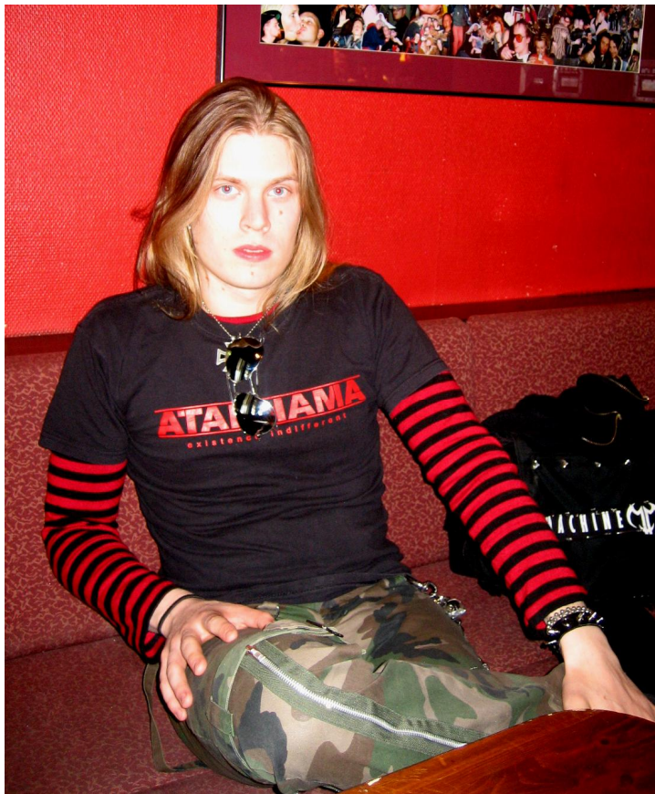
KUVIO 13. J.V.:n tyyliä.

Haastattelupäivänä J.V.lla oli yllään naisten maastokuvioiset housut, oman bändin, Atakhaman, paita ja punamustaraitainen paita sekä asusteina rautaristi kaulassa, pilottiaurinkolasit ja koruja ranteessa. (Ks. kuvio 13.) Hän pukeutuu yleensä samaan tyyliin. Ainoastaan keikalle lisätään vähän enemmän asusteita ja näyttävyyttä.