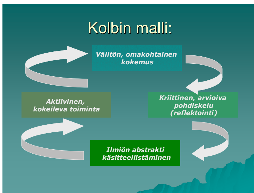
Kuva 1: Kolbin malli (1984; sit mm. Ojanen 2000)

Mallinnettuna kokemuksellinen oppiminen voidaan kuvata neljän päävaiheen kautta, ns. Kolbin malli (kuva 1). Ensimmäisessä vaiheessa pääosassa on välitön, oma-kohtainen kokemus. Toiseksi malli perustuu kriittiseen, arvioivaan pohdiskeluun eli kokemusten reflektointiin ja kolmanneksi ilmiön abstraktiin käsitteellistämiseen. Viimeinen, neljäs vaihe, merkitsee käsitteiden soveltamista takaisin käyttöön.