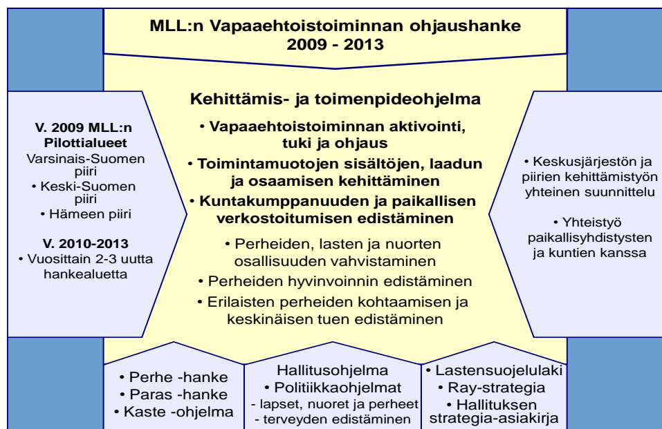
Kuvio 1 MLL:n Vapaaehtoistoiminnan ohjaushankkeen lähtökohdat (Kalliomaa & Viinikka 2009, 9).

tään systemaattista toiminnan vaikutusten arviointia, ja lisätään tietämystä vapaaehtoisvoimin tehtävän ehkäisevän perhetoiminnan vaikutuksesta perheiden arkeen. (Kalliomaa & Viinikka 2009, 8–10.)