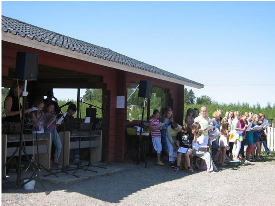
Kuva 4 Paviljonki