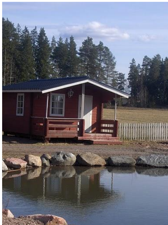
Kuva 2 Kanniston kotieläintilan pihapiirissä on kymmenen aittaa