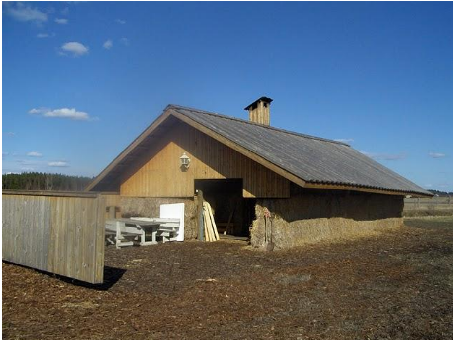
Kuva 3 Olkisavusauna