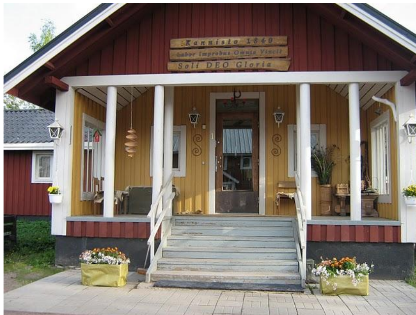
Kuva 1 Päärakennus