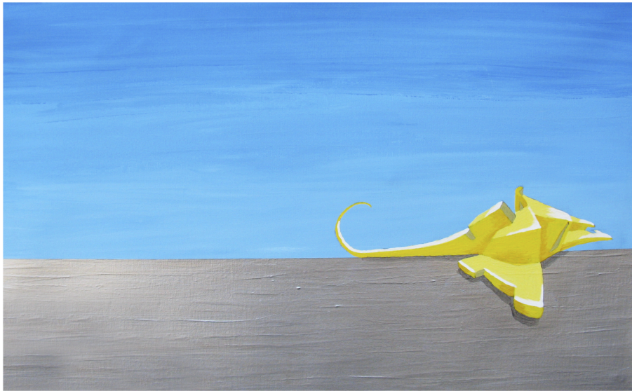
VILEÄ HENKÄYS 2009 akryyli kankaalle 50 x 80 cm