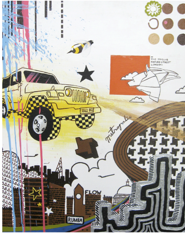
TAKE A RIDE 2005 akryyli kovalevyllle 80 x 60 cm