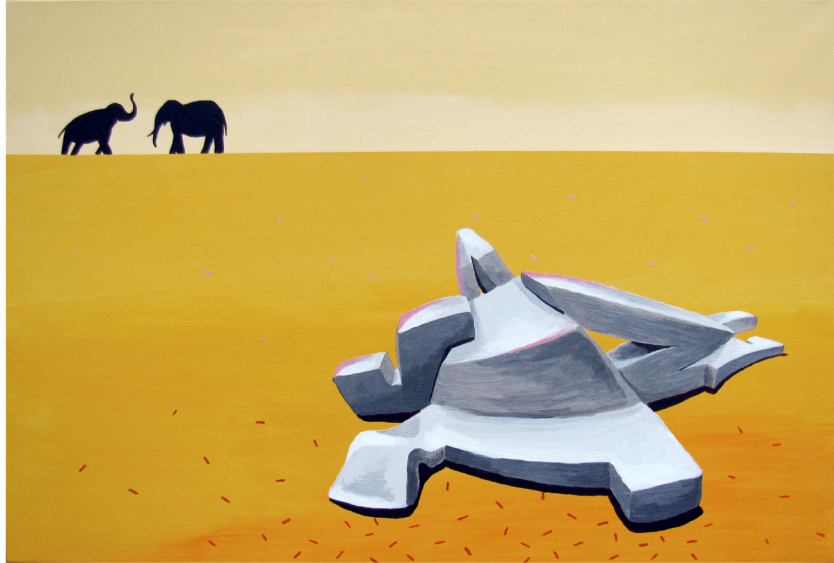
CONNECTING 2010 akryyli kankaalle 80 x 120 cm