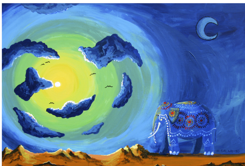
LUMOUS 2010 akryyli kankaalle 70 x 100 cm