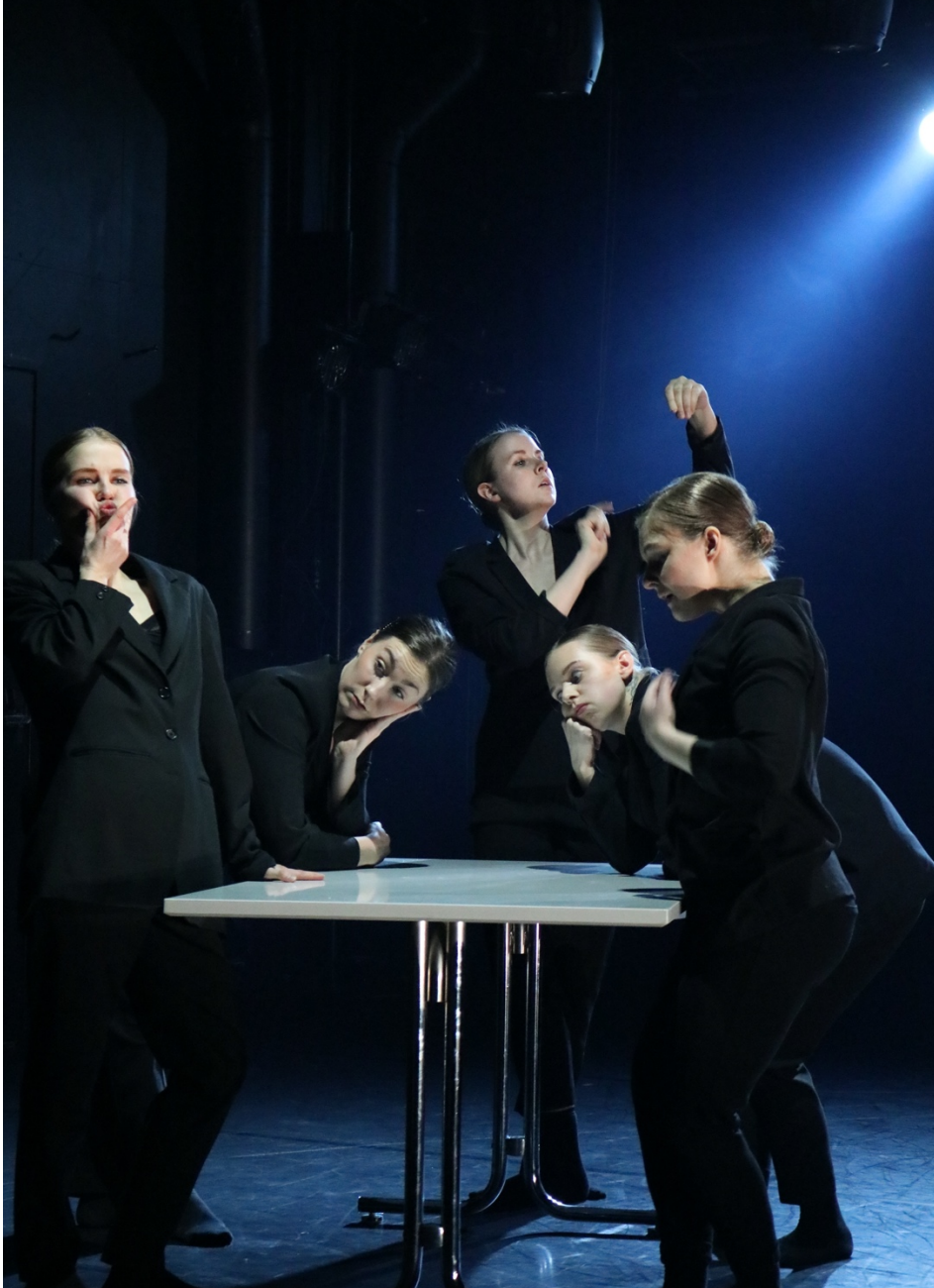
KUVA 7. Pöytäkohtauksen mimiikkaa korostettiin kohdennetun valaistuksen avulla. (Suhonen 2020)