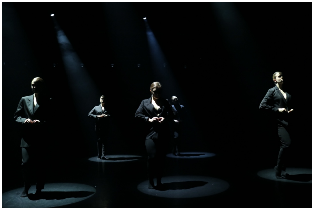
KUVA 8. Pukeutuminen (Suhonen 2020)

Alusvaatteisiin voidaan liittää helposti seksuaalisia ja provosoivia mielikuvia, mitä halusin välttää, joten pyrin löytämään mahdollisimman yksinkertaisen mutta elegantin ratkaisun. Päädyimme yhteisen pohdinnan kautta alusasujenkin osalta selkeään kokomustaan linjaan ja välttämään liiallisia ja provosoivia yksityiskohtia. Tieto alusvaatteista esiintymisestä aiheutti työryhmässä prosessin aikana keskustelua kehollisista paineista, ja jouduin pohtimaan useaan otteeseen valintojani. Harjoituskauden edetessä tunne alusvaatteiden perusteltavuudesta kuitenkin vahvistui ja harjoittelemisen sai vähissä vaatteissa olemisen muuttumaan vähitellen luontevaksi.