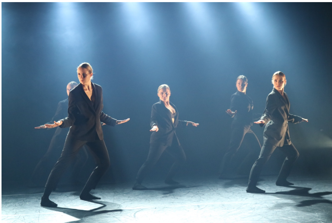
KUVA 6. Kylmä valo 2. kohtauksessa (Suhonen 2020)