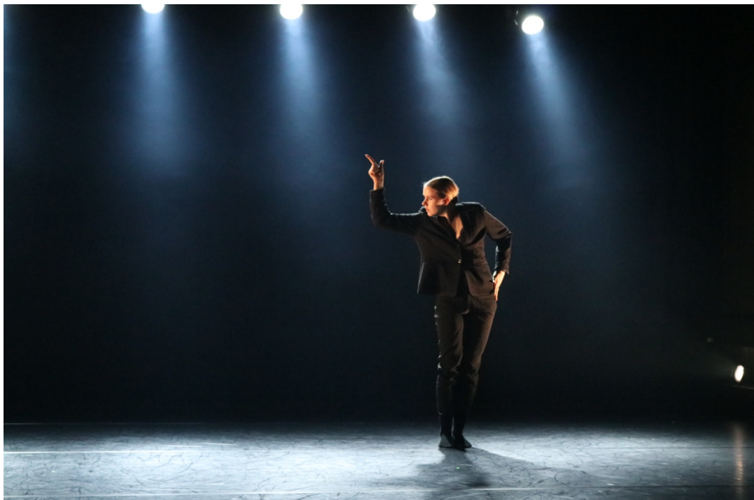
KUVA 4. Soolo (Suhonen 2020)

ahtaudesta ja vaatimuksista toimi pohjana myös tälle versiolle, eikä vaatinut muutoksia liikemateriaaliin. Liike hyödyntää edellisen kohtauksen tapaan elekieltä, mikä kuvittaa pomohahmon ristiriitaisia ajatuksia roolistaan johtajana. Toisaalta valta on kiehtovaa ja tuo vapautta, mutta toisaalta vastuu ahdistaa ja painaa harteilla. Hymy ja illuusio suoriutumisesta on kuitenkin säilytettävä.