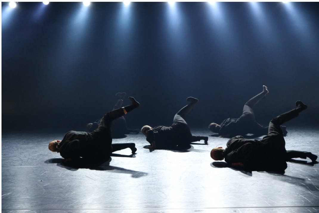
KUVA 2. Sovinnaiset (Suhonen 2020)

Tässä luvussa avaan tarkemmin valmiin teoksen kohtausten sisältöä ja kerron valosuunnittelusta sekä puvustuksesta. Lisäksi kerron poikkeuksellisesta esitystilanteesta ja sen herättämistä ajatuksista.