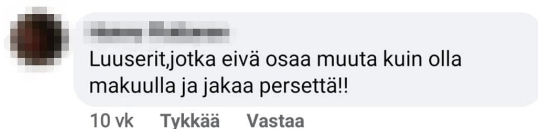
KUVA 2. Kuvakaappaus Sub:n Facebook-julkaisun kommenttikentältä (Sub, Love Island Suomi, 2020.)

Maaliskuussa 2020 Sub-televisiokanava julkisti Facebookissaan, että heiltä on tulossa uusi kausi syksyllä (mikä myöhemmin siirrettiin tulevaisuuteen). Vastaanotto oli pääosin positiivista, mutta mielensä pahoittajia mahtui totta kai sinnekin.