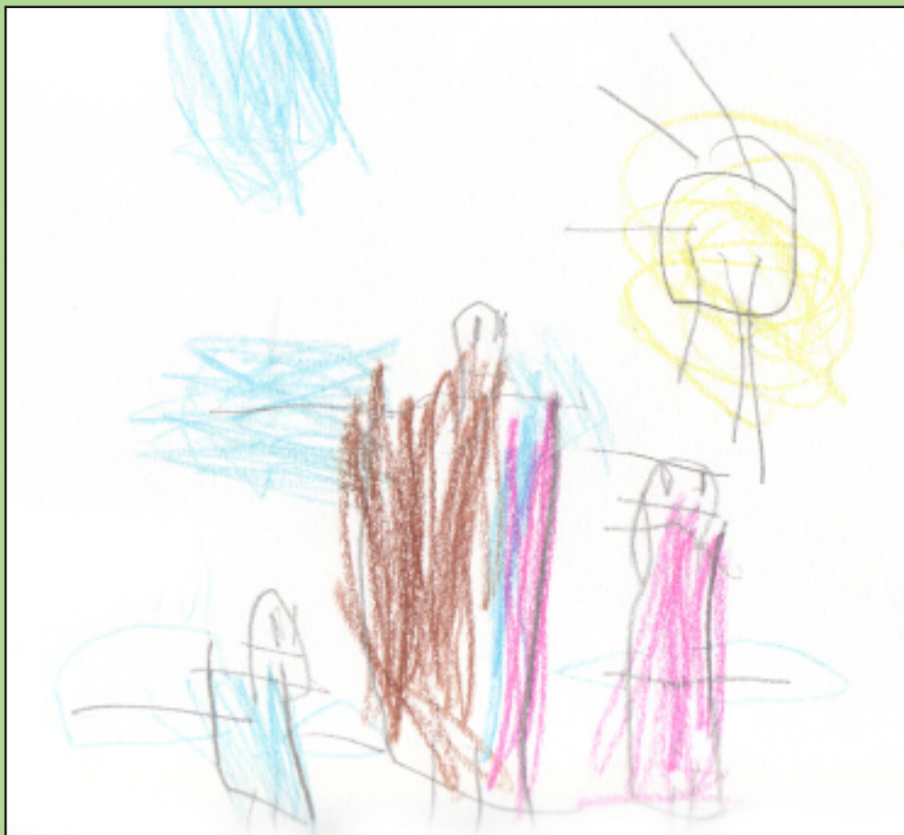
Minä, isä ja äiti

Lapsi käy elämässään prosessin, jossa hän muodostaa itsestään käsityksen ”olen tyttö/poika” ja tätä sanotaan sukupuolisosialisaatioksi. Lapsi oppii ympäristöstä tarkkaillen mitä sukupuolirooliodotuksia on tytöille sekä pojille. Jo vauvoille puhutaan, että hän on tyttö tai poika, mutta lapsi ymmärtää vasta noin neljän vuoden ikäisenä mitä tämä ero tarkoittaa, vaikka erot sukupuolten välillä lapsi huomaan jo noin kolmen vuoden iässä. Leikki-ikäisiä lapsia on hyvä kannustaa oman sukupuoliroolin mukaisiin odotuksiin, mutta poikamaisia tyttöjä tai tyttömäisiä poikia täytyy kohdella oman sukupuolensa edustajina, eikä vahvistaa heidän torjumaansa identiteettiä minkä he ovat syystä tai toisesta tehneet. Pikkuhiljaa he voivat hyväksyä oman sukupuolensa, vaikka heistä ei tulisikaan ”tyypillisiä tyttöjä” tai ”tyypillisiä poikia”. Lasten kiinnostuksen kohteet voivat joskus olla sukupuoliroolien vastaisia ja näihin asioihin vanhempien tulisi suhtautua hyväksyvästi. Lapsen sukupuolen ja persoonallisuuden piirteiden hyväksymättömyys vaikeuttaa lapsen minäkuvan ja sukupuoli-identiteetin rakentumista. Itsensä hyväksytyksi kokeminen ryhmässä auttaa identiteetin vahvistumiseen. Kun lapselle kasvaa hyvä itsetunto hän kykenee vastavuoroiseen suhteeseen ja uskaltaa lähestyä ja ottaa kontaktia muihin, joka myöhemmin on tärkeä taito.