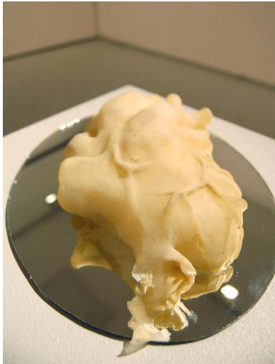
Kovia kokenut mutta puhdas | 2009, lateksi

Teokseen Synti ja viattomuus valitsemani väripari kuvaa mustavalkoista suhtautumista kyseiseen aiheeseen. Maailmassa ei osata erottaa todellista hyvää ja paha, ei katsota pinnan alle vaan tuomitaan asioita ja ihmisiä ulkoisten seikkojen perusteella. Letit kummallakin puolella kuvaavat pikku tyttöä, joka on viattomuuden symbolina paljon käytetty. Mutta lettien asettelu kertoo piiloviestin seksuaalisuudesta. Seksuaalisuus kätkee hyvin paljon sekä synnin että viattomuuden diskursseja.