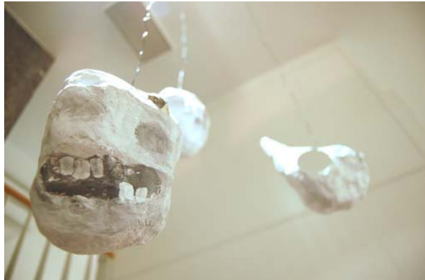
Äly ja kauneus | 2009, sekatekniikka Hyväsydäminen | 2009, sekatekniikka Itsetuntemus | 2009, sekatekniikka