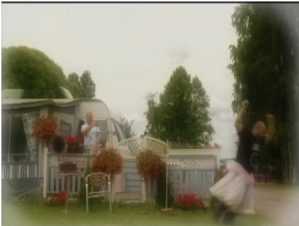
En gubbe skrattar åt motorcyklisten i balettklänning