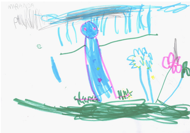
Miranda 4 år: "Lila tanten"