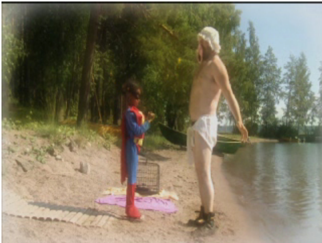
Motorcyklisten som baby