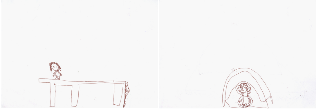
Frank 5 år: "Flickan" och till höger "Motorcyklisten som gråter"