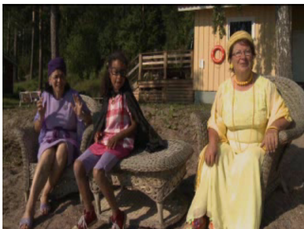
Rut och tanterna