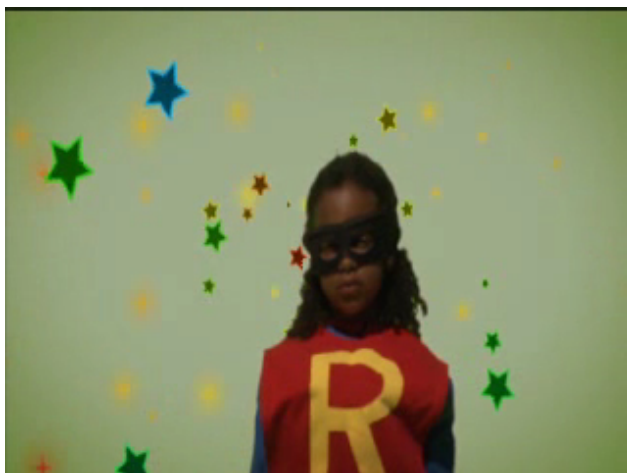
Rut i fantasin