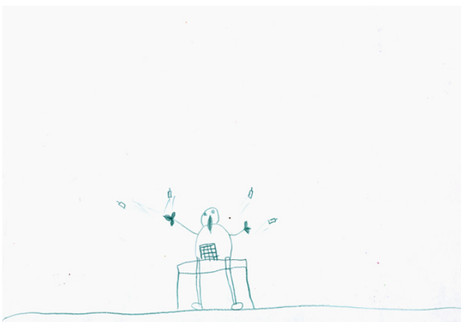
Felipe 6 år: "Motorcyklisten som slänger ljus från tårtan"