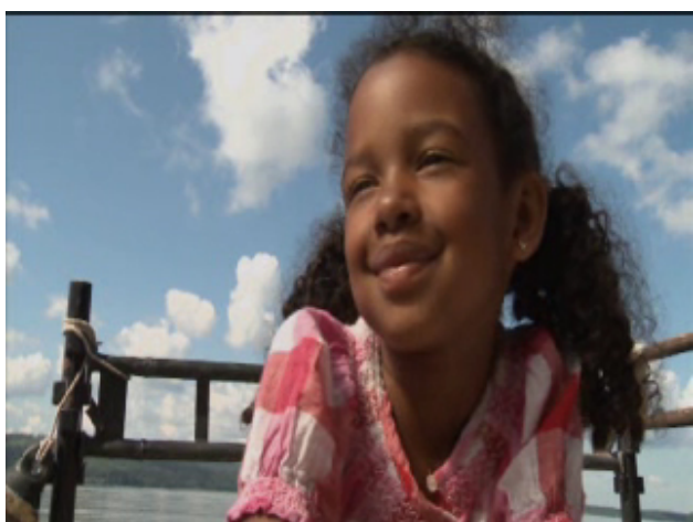
Rut i verkligheten