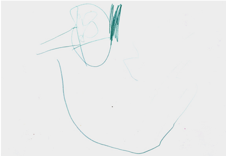
Dina-Irene 4 år: "Rut"