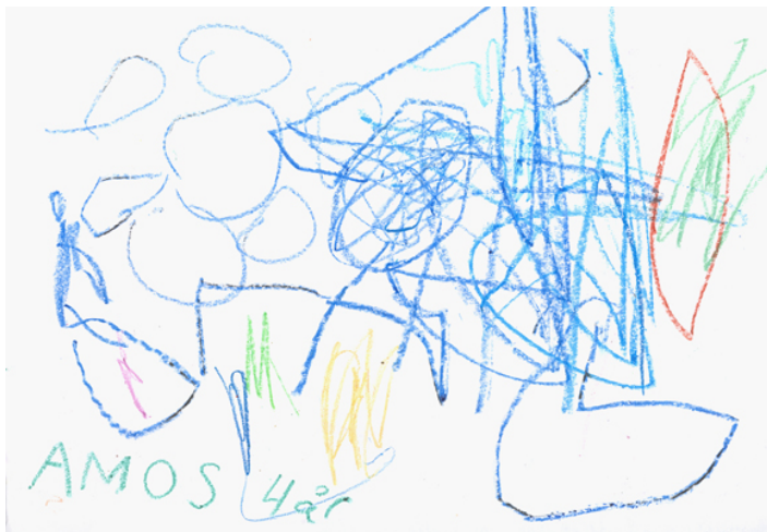
Amos 4 år: "Motorcyklisten med pulver i ögat"