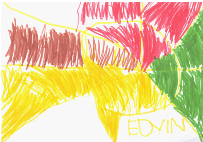
Edvin 4 år: "Ett spindelnät på bryggan"