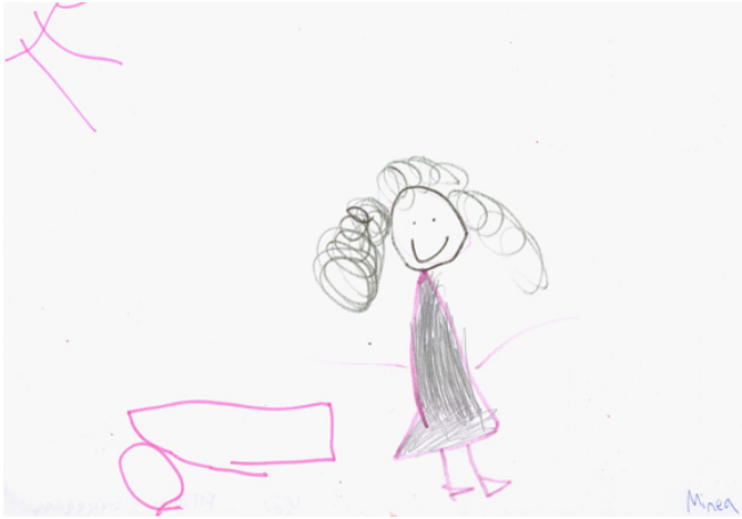
Minea 4 år: "Rut"