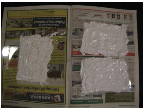
Kuva 40: Gessolaatat kuivumassa.