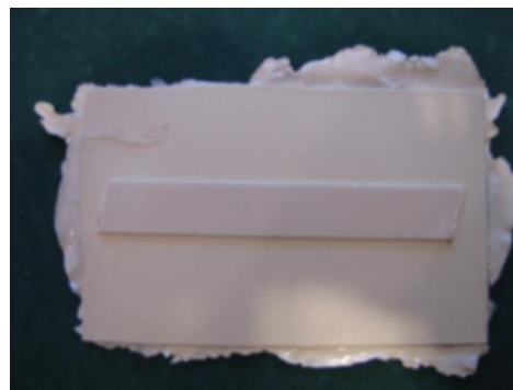
Kuva 43: Gessolaatta takaapäin.