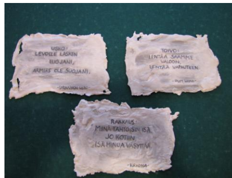
Kuva 41: Valmiit gessolaatat.