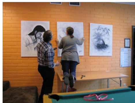
Kuva 45: Asetteluviimeistelyä.