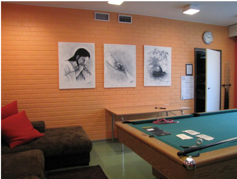
Kuva 47: Valmis kokonaisuus.