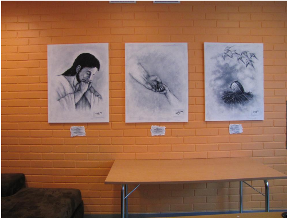
Kuva 46: Teossarja kokonaisuudessaan.