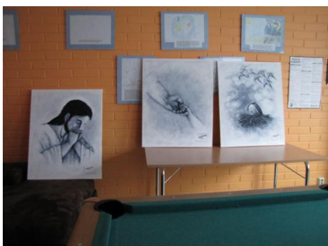
Kuva 44: Teosarja omassa tilassaan.