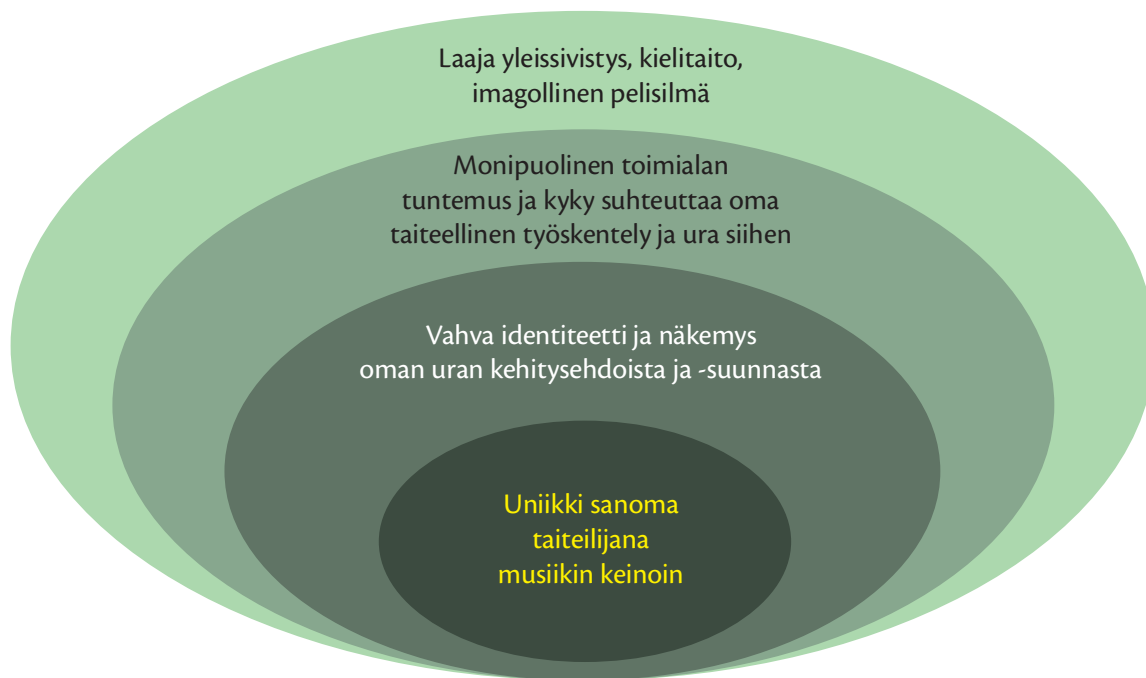
KUVA 2. Muusikon osaamisen eri ulottuvuudet kehinä

Keskiössä oleva persoonallisen taiteilijuuden alue sisältää instrumenttihakinnon ohella myös taidon kommunikoida yleisölle. Kommunikoinnin ensisijainen reitti on musiikki: teoksen tulkinnassa pitää olla jokin omasta taiteilijuudesta kumpuava sanoma, jonka taiteilija haluaa välittää yleisölleen.