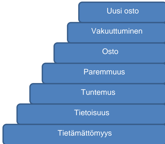
Taulukko 2 Dagmar- malli (Bergström, Leppänen 2009, 331).

Dagmar-malli ei juuri eroa AIDASS-mallista. Ensimmäisellä tasolla asiakas ei tiedä mitään tuotteesta ja hänet on saatava tietoiseksi tuotteen olemassa olost. Kolmannella portaalla asiakas tuntee tuotteen ja oppii tietämään millä tavoin se on kilpailevia tuotteita parempi. Ostopäätöksen jälkeen asiakas vakuutetaan tuotteen laadusta ja asiakaspalvelusta. Kun asiakas on tyytyväinen saamaansa palveluun, hän ostaa lisää. (Bergström, Leppänen 2009, 331.)