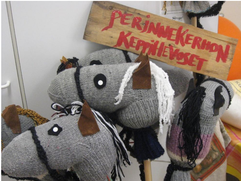
Kuva 6. Kepparit esillä kevätjuhlassa.

Keppihevosek saatiin sopivasti valmiiksi juuri ennen päiväkodin kevätjuhlaa, jonne myös lasten vanhemmat oli kutsuttu. Sain oivan tilaisuuden mainostaa perinnekerhon toimintaa laittamalla hevosek näyttille osana laulusalin muuta koristelua.