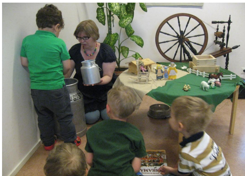
Kuva 8. Maidon mittaaminen oli tarkkaa puuhaa.

Tarina eteni niin, että naapureiden saatua maitonsa talon emäntä suunnitteli vielä valmistavansa piimäjuustoa, kun kerran talon miesväki oli veistellyt niin hienoja puisia juustomuotteja. Esittelin samalla juustomuotit yleisölle ja kysyin onko heistä joku tehnyt tällaisia puusta. Kuten arvelinkin, yksi nikkarointitaitoinen vanhus oli sellaisia aikoinaan veistellyt. Varsinainen esitys päättyi tähän. Lapset saivat kuitenkin jokainen kokeilla maidon mittaamista tonkasta ja suuren maitotonkan kantamista. Vettä oli tonkassa noin kymmenen litraa, joten kantamus oli painava. Tosin saimme kuulla, että karjakkona toiminut vanhus oli muinoin nostellut neljänkymmenen litran maitotonkkia.