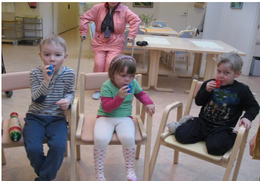
Kuva 3. "Sitten alkoi laulukoulu, tiri, tiri, teijaa".

Ensimmäinen vihje oli lintu, joten aloitimme Peipon pesä - laululla. Tähän lauluun olin muistin virkistämiseksi kirjoittanut aikuisille sanat, joiden lisäksi jokaisesta säkeistöstä oli sanoihin viittaava kuva, muun muassa koivu ja linnun pesä. Tämän laulun myötä saimme myös tutustua uusiin äänimaisemiin. Kolmannen säkeistöön, jossa lauletaan "kävi siinä vierahissa naapurista rastas" , olin varannut soittimeksi quiron räkättirastaan ääneksi. Soitin oli kaikille vieras ja sen rahiseva ääni herätti hilpeyttä. Neljännen säkeistön aikana pääsi neljä innokasta lasta soittamaan vesikukkopillejä: "Sitten alkoi laulukoulu, tiri tiri teijaa" . Nämä veden kanssa viritettävät kukkopillit, joista kuuluu ihanaa linnun viserrystä, osoittautuivat menestykseksi ja otimme kolmannen ja neljännen säkeistön uudestaan, jotta kaikki pääsivät niitä kokeilemaan. Lisäksi soiton oikea-aikaisen aloittamisen tarkkailu oli hyvää harjoitusta lasten keskittymiskyvylle.