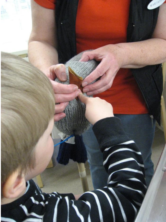
Kuva 4. Korvien kiinnittämisessä kuumaliimalla tarvittiin aikuisen apua.

Keppihevosten tekemisessä oli monia haastavia vaihteita, kuten esimerkiksi korvien liimaaminen kuumaliimalla ja harjan kiinnittäminen virkkuukoukun avulla. Meitä ohjaavia aikuisia oli kuitenkin kolme, jonka lisäksi avoimen päivätoiminnan asiakas työskenteli varsin itsenäisesti kahden lapsen apuna. Työ edistyi hyvään tahtiin ja kaikilla oli kivaa. Jälkikäteen myös yksi vanhuksista, jolla oli välillä vaikeuksia toimintaan motivoitumisessa, totesi, että ”kivaa se oli, lapset olivat niin innoissaan.”