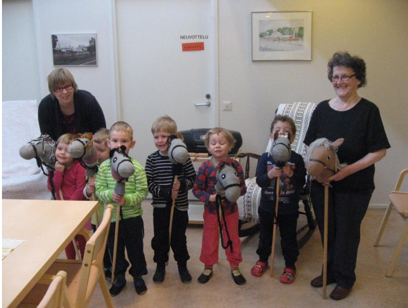
Kuva 5. Kunniakierrosta odottamassa: "Hopoti hoi!"

Keppihevosek saatiin sopivasti valmiiksi juuri ennen päiväkodin kevätjuhlaa, jonne myös lasten vanhemmat oli kutsuttu. Sain oivan tilaisuuden mainostaa perinnekerhon toimintaa laittamalla hevosek näyttille osana laulusalin muuta koristelua.