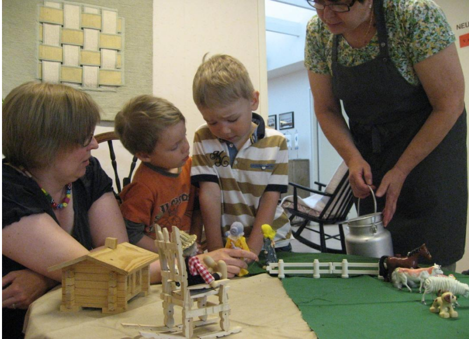
Kuva 7. Naapurin emäntä maitoa hakemassa.

Tavoitteena tässä tuokiossa oli tutustua entisajan maatilan elämään elämyksellisin keinoin. Pöytäteatterinukkejen ja eläinten lisäksi tarinassa oli musiikkia, kun maatilan kaikki eläimet esittäytyivät ”Eläinystäväni” – kappaleen tahdissa. Aidon tuntuisen maidonhakumatkan mahdollisti omilta sukulaisilta saamani 20 litran maitotonkka, litran mitta ja kahden litran kannu, joita kaikki lapset pääsivät vielä lopuksi kokeilemaan. Lisäksi mukana oli muutama puinen juustomuotti, joita Kunnaksen kirjassakin oli kuvattuna. Näiden esineiden mukanaolo viritti myös vanhuksia oman lapsuutensa tunnelmiin. Tuokion lopuksi sai vielä makuaistikin osansa tässä varsin moniaistillisessa kokonaisuudessa.