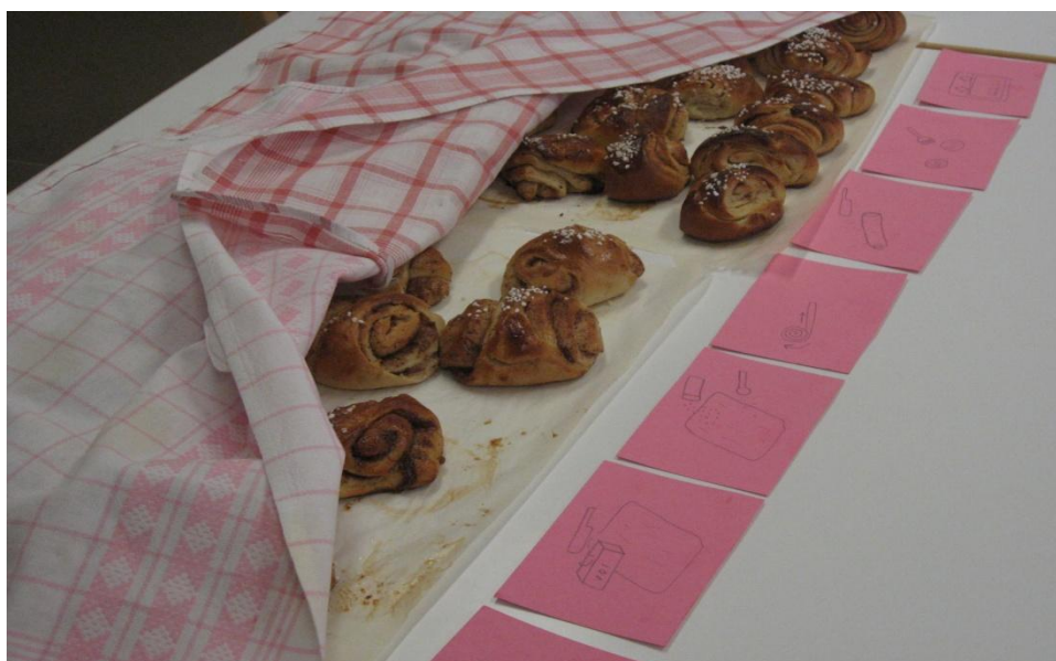
Kuva 2. Valmiit korvapuustit ja työvaihekortit.

kertynyt runsain määrin leivottavaksi, kun vuoroin piti lisätä jauhoja ja vettä, ja aina jompaakumpaa oli liian vähän!