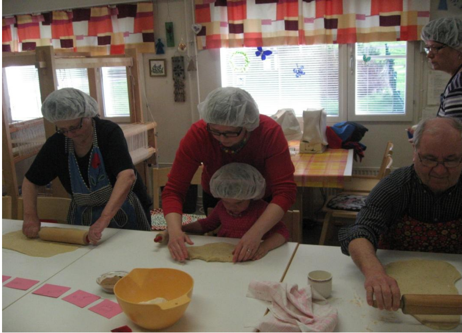
Kuva 1. Jokaisella oli oma taikinapala kaulittavaksi.

Yksittäisten työvaiheiden jälkeen käänsimme jo suoritettua työvaihekortin nurinpäin. Haasteena oli edetä työvaiheissa edes suunnilleen samaan tahtiin – toiset jäivät tutkimaan taikinaa, kun taas muutama leipuri jo rullasi ja leikkasi. Lapset tarvitsivat apua erityisesti voin levittämisessä kaulitun taikinan päälle, sekä kanelin ja sokerin sirottelemisessä. Mutta apua tarvitsivat myös vanhuksot, joten meillä ohjaajilla riitti puuhaa. Olimme sopineet jo etukäteen, että kun korvapuustit saadaan pellille ja ensimmäiset pullan tuoksut kantautuvat uunista, päätämme päivän kerhon, jotta lapset ehtivät vielä aamupäivällä ulkoilemaan. Lasten osalta herkuttelu siirtyi lounaan yhteyteen, mutta se ei tuntunut haittaavan.