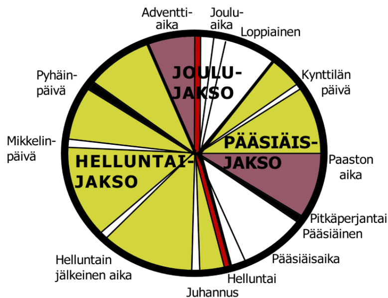
Kuva 1. Kirkkovuosiympyrä (mukaillen Hyvönen, i.a.)

Kirkkovuosi Suomen evankelisluterilaisessa kirkossa on jaettu kolmeen jaksoon: joul-, pääsiäis- ja helluntaijaksoihin. Ne jäsentävät ja rytmittävät kirkon jumalanpalveluselämää. (Kuva 1.)