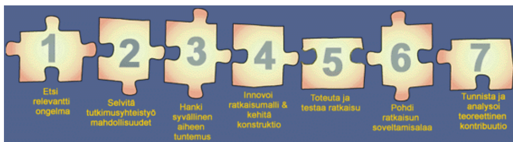
Kuva 1. Konstruktiiviselle tutkimukselle tyypillinen tutkimusprosessi. (Lukka 2001.)

Konstruktiivinen tutkimusprosessi muodostuu seuraavista kohdista (kuva 1):