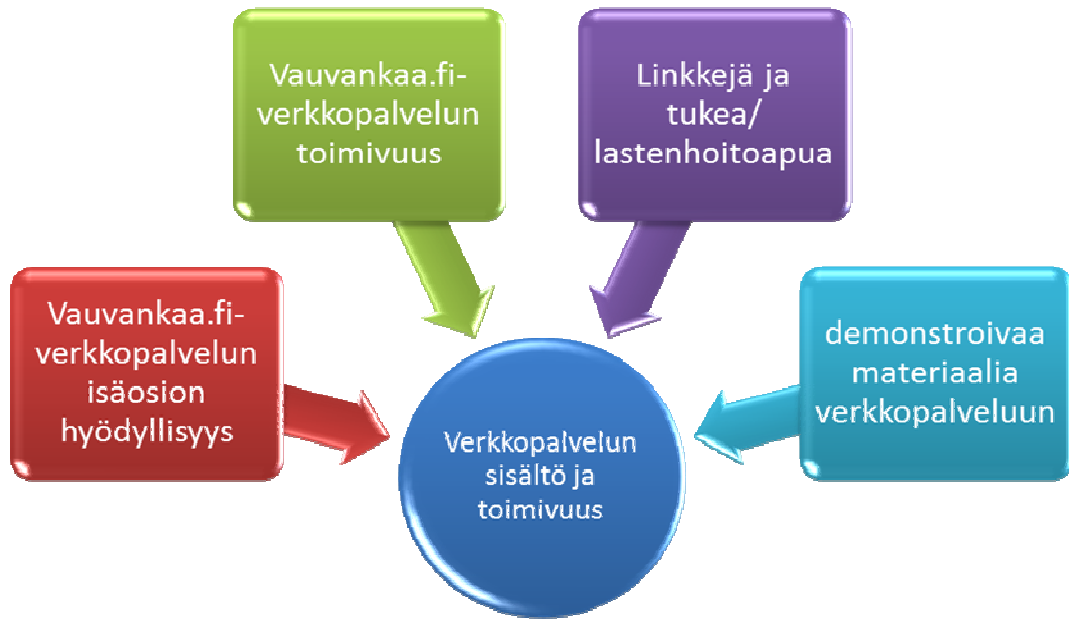
Kuvio 3. Verkkopalvelun sisältö ja toimivuus.