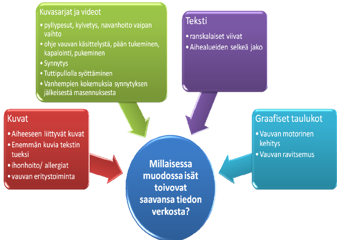
Kuvio 5. Isien toiveita verkkopalvelun sisällön kehittämisestä.

Isät kaipaavat enemmän ohjeistusta hoivaajan roolissa olemisesta, jotta voittavat oman jännityksen ja arkailun lasta käsitellessään. Isillä on hoivavietti ja halua ylläpitää perheen hyvinvointia. Kuvaamme isien toiveita verkkopalvelun sisällön kehittämisestä Kuviossa 5.