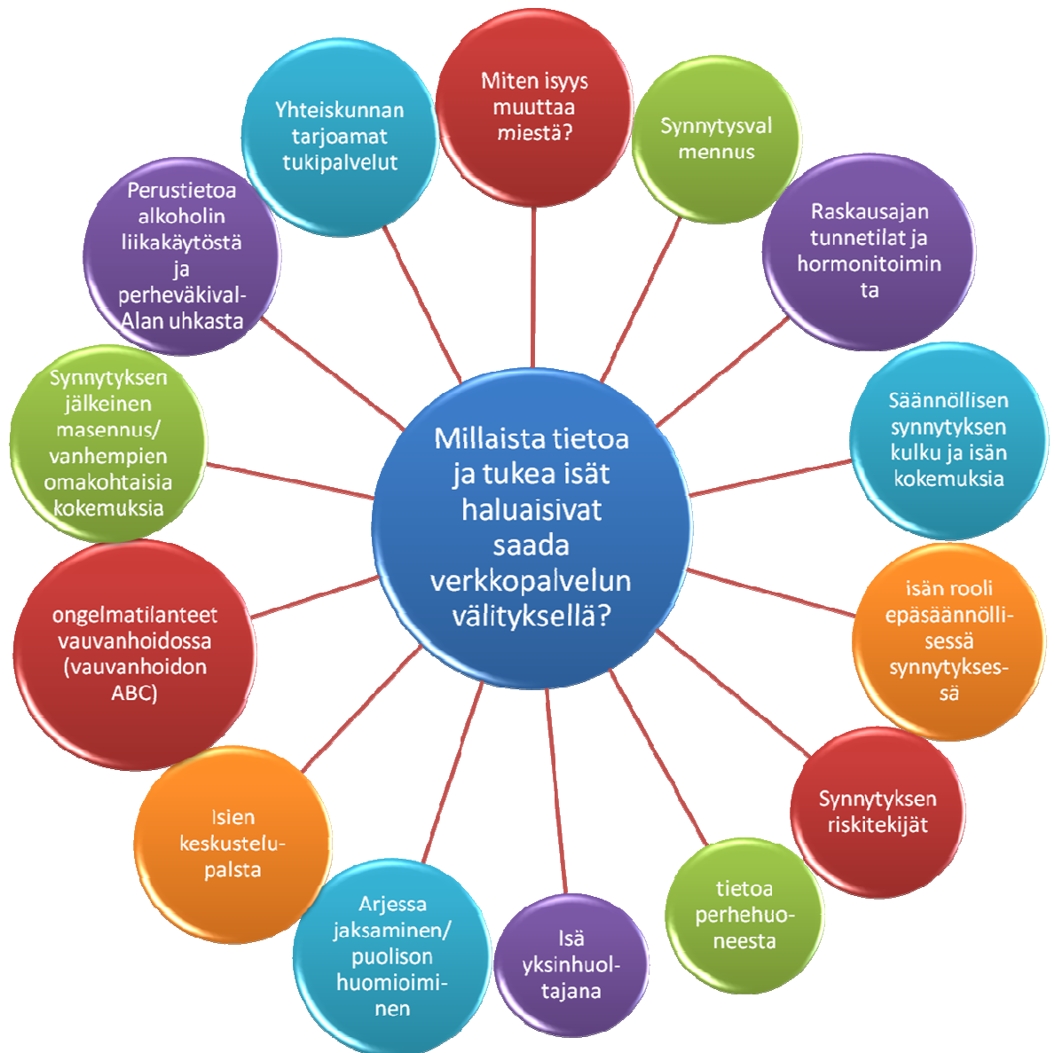
Kuvio 4. Isien toiveita verkkopalvelun sisällöstä.

Haastatteluista nousi esiin, että isät kaipaavat ytimekkäitä vinkkejä, joita voi löytää nopeasti verkkopalvelusta, jos on esimerkiksi yksin lapsen kanssa kotona. Isät haluavat tarvitsemansa tiedon selkeänä ja yksinkertaisena ilman lukuisia vaihtoehtoja, joista on lopulta vaikea valita oikeaa ja parasta. Isät pitävät pääsääntöisesti kuvallisesta ja videomuodossa olevasta materiaalista. Jos tietoa jaetaan vain tekstimuodossa, se ei saa isiä kiinnostumaan asiasta.