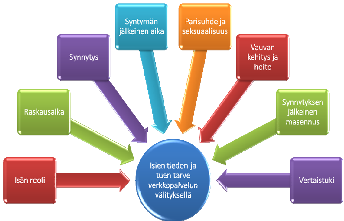
Kuvio 2. Isien tiedon ja tuen tarve verkkopalvelun välityksellä.

Isillä oli useita tiedon ja tuen tarpeita asioista, joista he halusivat tiedon verkkopalvelun välityksellä. Näitä olivat isän rooli, raskausaika, synnytys, syntymän jälkeinen aika, parisuhde ja seksuaalisuus, vauvan kehitys ja hoito, synnytyksen jälkeinen masennus ja vertaistuki (Kuvio 2).