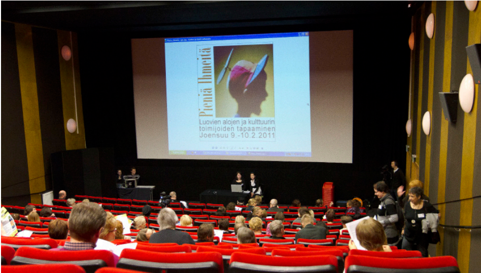
Kuva 2. Pieniä ihmeitä - luovien alojen ja kulttuurin toimijoiden kansallinen tapaaminen Joensuussa 9.-10.2.2011.

Projektisuunnitelman valmistuessa käytiin neuvottelut alueen toimijakentän nk. kohderyhmän edustajien kanssa sekä jo Creative Managers -valmisteluhankkeessa yritysconsortiossa mukana olleiden toimijoiden kanssa. Touko-kesäkuussa 2009 solmittiin aiesopimuksia 12 kpl luovien alojen toimijoiden sitoutumisesta projektin toteutukseen. Rahoituspäätös olisi mahdollistanut projektin aloittamisen 1.8.2009, mutta hallinnoija satoi henkilöstöresurssia projektiin vasta lokakuussa. Tällöin työvuastuussa oli jo Creative Managers -valmisteluhankkeessa mukana ollut konsultti, joka pyrki luomaan CM-projektista kompetenssien kehittämis- ja koulutusohjelman. Näkemyksenä oli, että erilaiset luovan talouden konseptia toteuttavat pilotit muodostavat ohjelman ajurit. Tällaista terminologiaa eivät kohderyhmän edustajat kokeneet omakseen. Projektirahoituksessa palkkakustannusten tukikelpoisuusvaateena on niiden kohtuullisuus. Konsultti ei ollut valmis muuttamaan Pohjois-Karjalan alueelle, joten hänen jatkaessaan projektin rasiitteena olisi ollut kustannusten kertyminen yli budjetoinnin matka- ja palkkakuluihin.