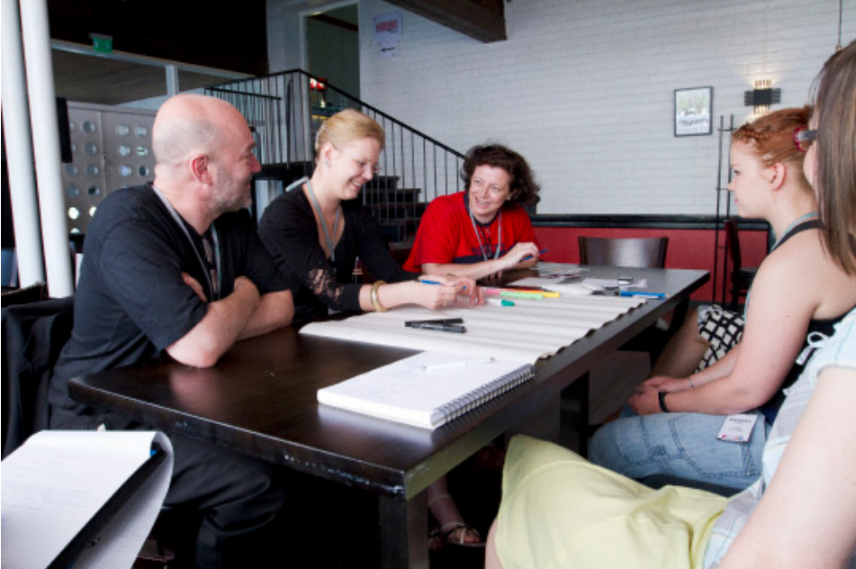
Kuva 8. Ryhmätöitä Ilmiö-seminaarissa, tässä on Joensuu Cafe -konsepti syntymässä.

Luovien alojen managerointi ja alueellinen kehitys : kokemuksia Pohjois-Karjalasta (Jari Kupiainen & Marja-Liisa Ruotsalainen toim.) -julkaisu on artikkelikokoelma CM:n valmennettavien puheenvuoroin omista oppimisprosesseistaan ja kouluttajien substanssialoista. Julkaisu on omanlaisensa lisäys Pohjois-Karjalan luovien alojen näkyväksi saattamisessa. Julkaisun jakelu PKAMK:n internet-sivujen kautta sähköisesti takaa helpon saatavuuden, joten sen hyödynnettävyys mm. lähdeaineistona on helppoa. Stereoskooppiset - ja 3D-opetusmateriaalit ovat niin ikään sähköisessä muodossa ja niiden jalostaminen ja käyttö opetusaineistona toteutuu PKAMK:n viestinnän koulutusohjelmassa sekä PKKY:n pelialan yrityshautomossa. Kuvausmateriaalia kertyi paljon projektissa toteutetuista testi- ja harjoittelujaksoista.