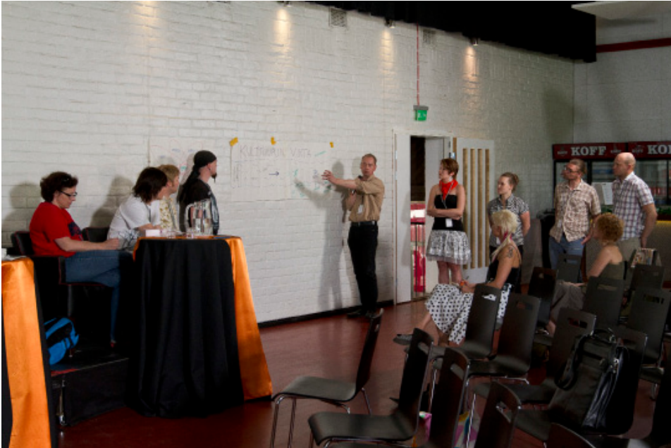
Kuva 7. Ilmiö-seminaari 9.-10.6.2011 järjestettiin PKAMK:n kolmen hankkeen yhteistyönä; TONIC -Tonal Innovation Center, AKI Living Lab ja Creative Managers.

ILMIÖ eli kolme ESR-projektia (AKI-Living Lab, Creative Managers ja TONIC) järjesti uusia kaupallisia polkuja luoville aloille luotsaavan seminaarin kesäkuussa 2011. Laadukas seminaari pystyttiin toteuttamaan huomattavasti edullisemmin kustannukset jakamalla, kuin jos se olisi toteutettu erillisinä tapahtumina. ILMIÖ-seminaarissa syntyi Café Joensuu - projektiaihiio, joka tekisi karjalaisesta ruokaperinteestä teknologisten etäyhteyksien mahdollistamana yhteisöllisyyttä ja sosiaalista pääomaa kasvattavan brändäyksen.