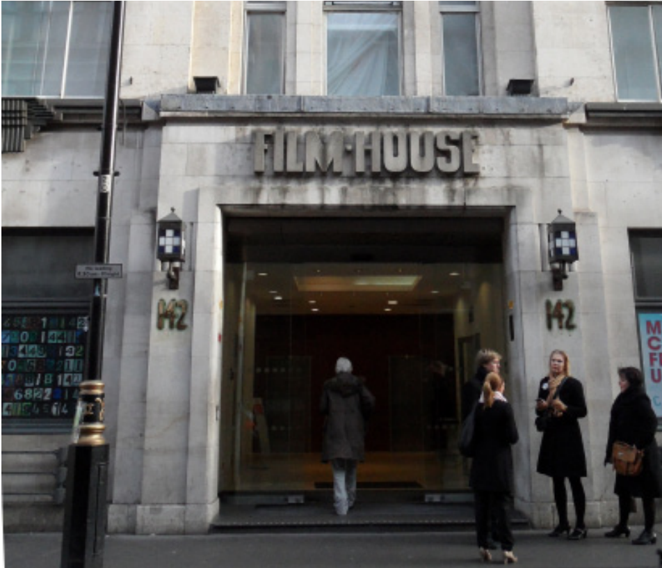
Kuva 5. Benchmarking-matkaalla Lontoossa.

Creative Managers -projektin toteutuksen myötä on tehty näkyväksi luovan talouden mahdollisuudet Pohjois-Karjalassa. Luovien alojen kehitysprosessi on kulkenut rinnan projektin kanssa ja osaamispääoman kasvu tulee näkyväksi viiveellä uusien tuotantojen myötä. Projektilla pyrittiin lisäämään luovilla aloilla työskentelevien ammattilaisten osaamista. Näkökulmana oli kyetä vastaamaan kansainvälisen tuotanto- ja palvelutoiminnan tarpeisiin sekä kehittämään digitaaliseen teknologiaan liittyvää osaamista. Panostamalla ja vankistamalla yritysosaamista alueella vahvistetaan erikoisosaamista ja tehostetaan toimijoiden työllistymismahdollisuuksia.