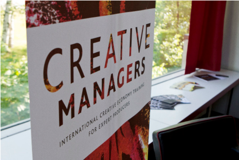
Kuva 3. CM-projektin visuaalinen ilme.

Projektin julkisuusvaade huomioiden kilpailutettiin projektin graafinen ilmeen suunnittelu ja aloitettiin verkkosivuston työstäminen. Tiedotussuunnitelma valmistui kevättalvella 2010. Projektin näkyvästä ja omaleimaisesta ilmeestä saatiin myönteistä palautetta, se koettiin helposti tunnistettavaksi ja mieleen jääväksi. Markkinoinnin näkökulmasta projektista tiedotettiin monipuolisesti ja kattavasti. Sosiaalisen median käyttö heti alusta pitäen oli edelläkävijyyttä ESR-projektitoiminnassa kansallisestikin. Vuonna 2009–2010 aloitti toimintansa kansallinen Luova Suomi -tiedotuskanava, joten CM-projektin ei tarvinnut palvella luovien alojen kokonaisvaltaista viestintää, vaan se keskittyi erityisosaamisen painopisteisiin itäsuomalaisesta näkökulmasta.