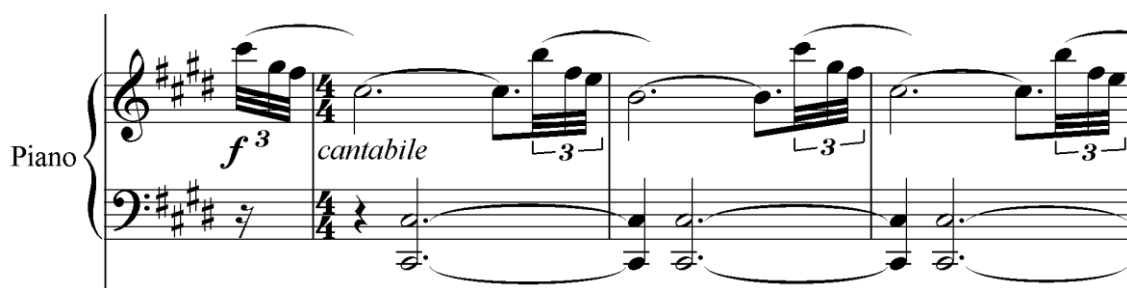
Kuvio 3. Overture 2012 – pianoteema

Olin päättänyt säveltää konsertille alkusoiton. Otin lähtökohdaksi konsertin viimeisestä kappaleesta rytmisen aiheen, ja lähdin laajentamaan sitä, käyttäen inspirationa Hans Zimmerin Inception -elokuvan soundtrackin kappaletta Mombasa (Zimmer 2011, äänite). Päätin tehdä kappaleesta boleromaisen 1 . Pienestä alkavan ja jatkuvasti kasvavan teoksen, joka lataisi jännitettä toisen kappaleen alkuun. Start Something – kappaleessa oli levyversiossa tunnelmaltaan utuinen piano-outro. Päätin sivuuttaa sen ja laittaa tilalle kertauksen Overture 2012 Ensimmäisestä musiikillisesta aiheesta. (ks. Liite 3.) Näin konsertti alkoi ja loppui samaan teemaan. Tosin lopussa aihe soitettiin puoli sävelaskelta ylempää.