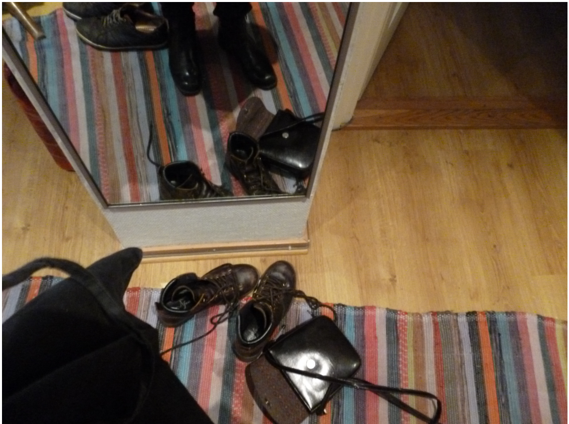
Kuvio 2. Tosi esitys 10.1.2013.