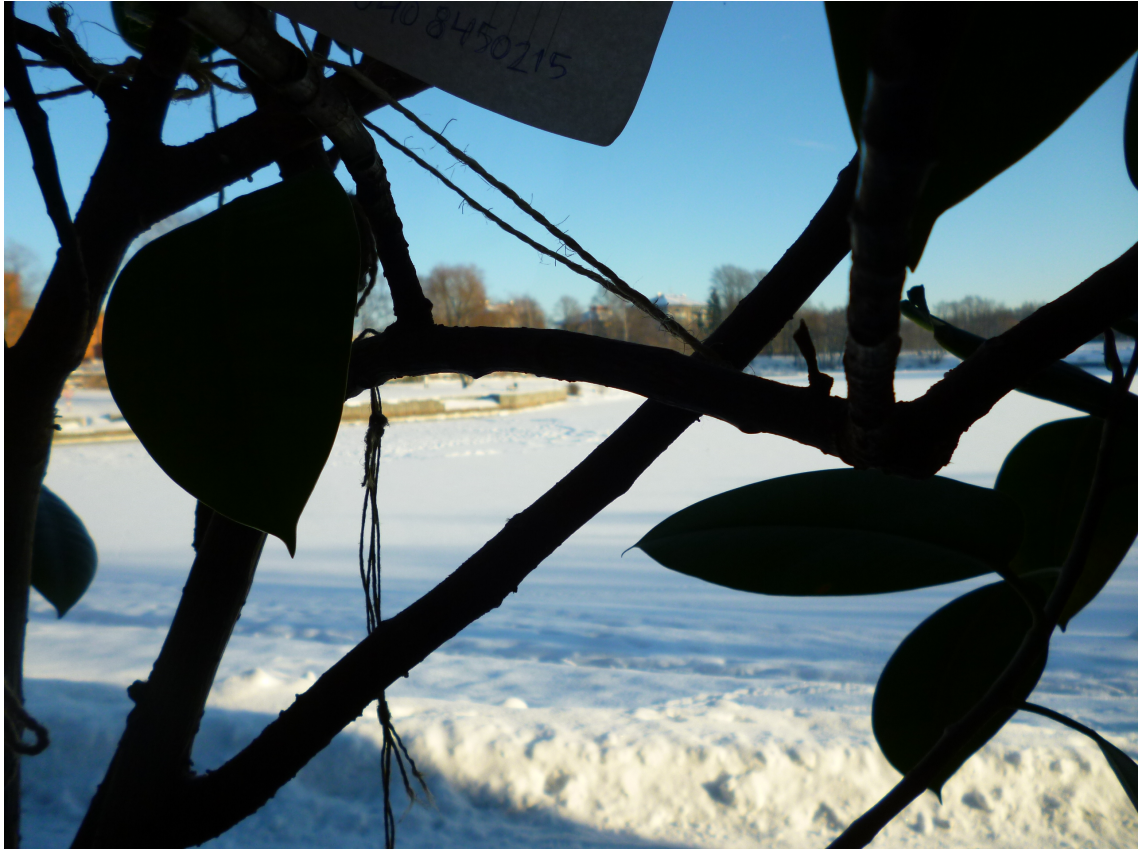
Kuvio 3. Tosi esitys 18.1.2013.