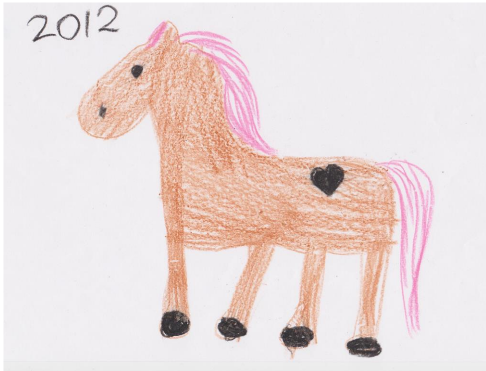
KUVA 1. ”Eläimet” toive kerhon aiheeksi

senäisiä ratkaisuja. Tavoitteena on myös harjaantua kirjallisessa sekä suullisessa ilmaisussa. Lopullisena tavoitteenani on saattaa opinnäytetyö valmiiksi, jotta voisin valmistua ohjaustoiminnan koulutusohjelmasta AMK-artenomiksi.