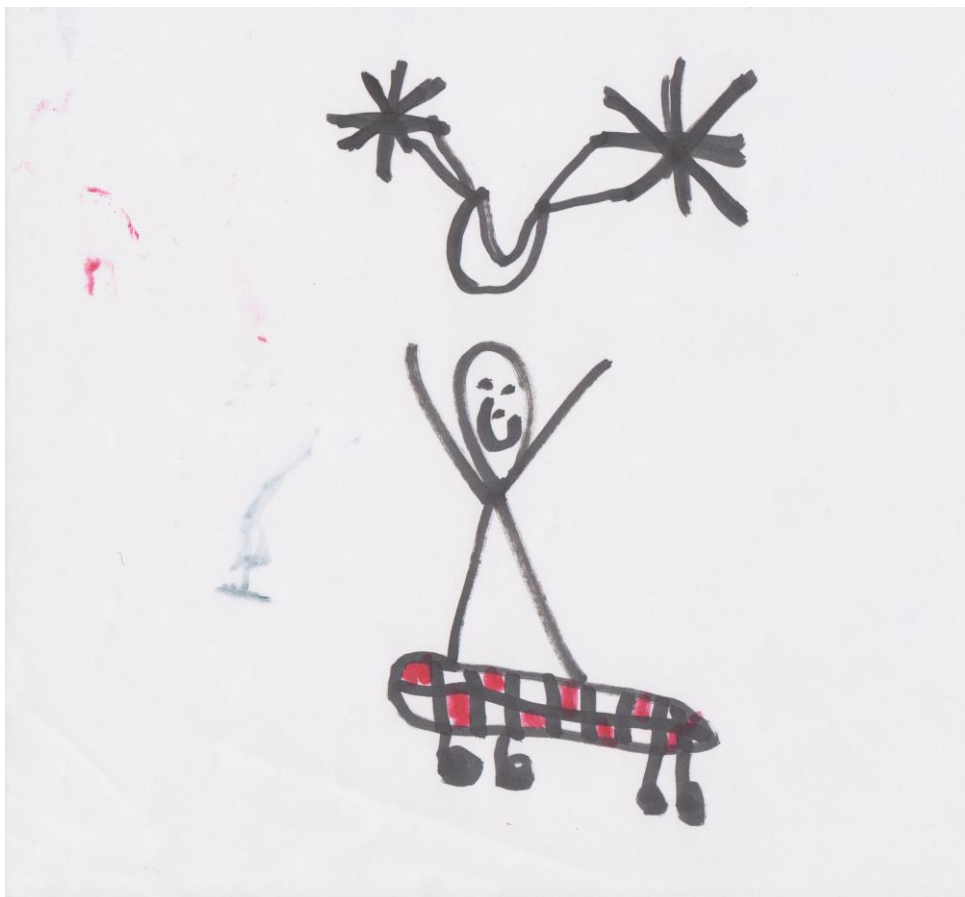
KUVA 4. ”Kesä” toive kerhon aiheeksi