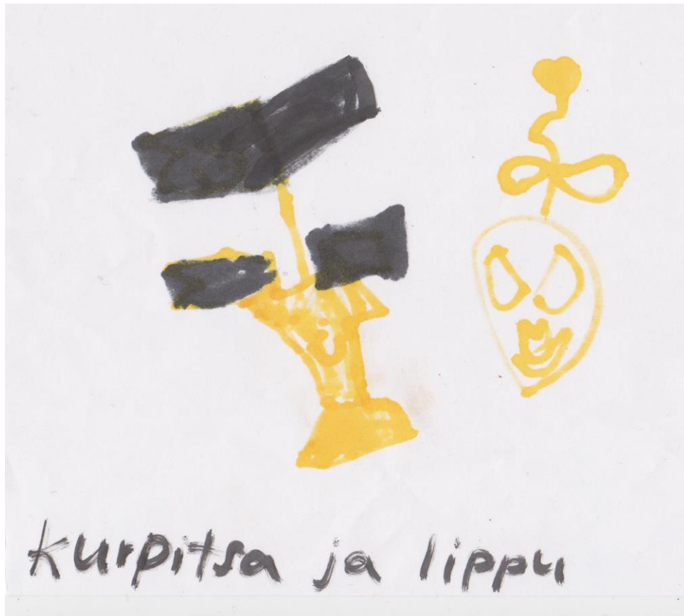
KUVA 2. ”Kurpitsa ja lippu” toive kerhon aiheeksi