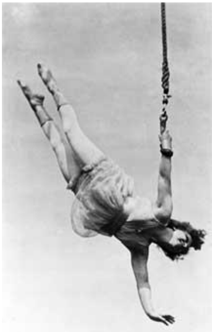
Kuva 4. Lillian Leitzel suorittamassa yhden käden ympärämenoa.

paikoilleen. Oikean käden ranne hiertyi rikki jokaisessa esityksessä, ja kun Lillian laskeutui alas maneesille, hänen ranteensa vuosi verta. Hän esitti olevansa pökerryksissä korostaakseen esityksensä rajuutta. Yleisö oli todennäköisesti samanaikaisesti kauhuissaan ja haltioissaan, kun nainen poistui maneesilta pökerryksissä ja verta vuotavana. Leitzelin oikean käden ranne oli hiertynyt rikki jokailtaisesta pyörimisestä. Vapaa-aikanaan hän peitti hiertyneen ranteensa koruilla tai huiveilla. (Encyclopedia of World Biography 2010.)