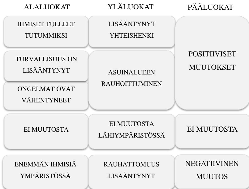
KUVIO 1. Lähiympäristön muutosanalyysi

Pyrimme teemojen avulla selvittämään, että onko asukastupa vaikuttanut lähiympäristöön jollain tavalla. Muutosta koskevissa kysymyksissä asiakkailta tiedusteltiin esimerkiksi, että millainen Linnanpellon asuinalue oli heidän mielestään ennen asukastupaa ja, millainen se on nyt asukastuvan perustamisen jälkeen. Muodostimme muutoksista kolme pääluokkaa, jotka olivat positiiviset muutokset, ei muutosta ja negatiiviset muutokset (ks. Kuvio 1).