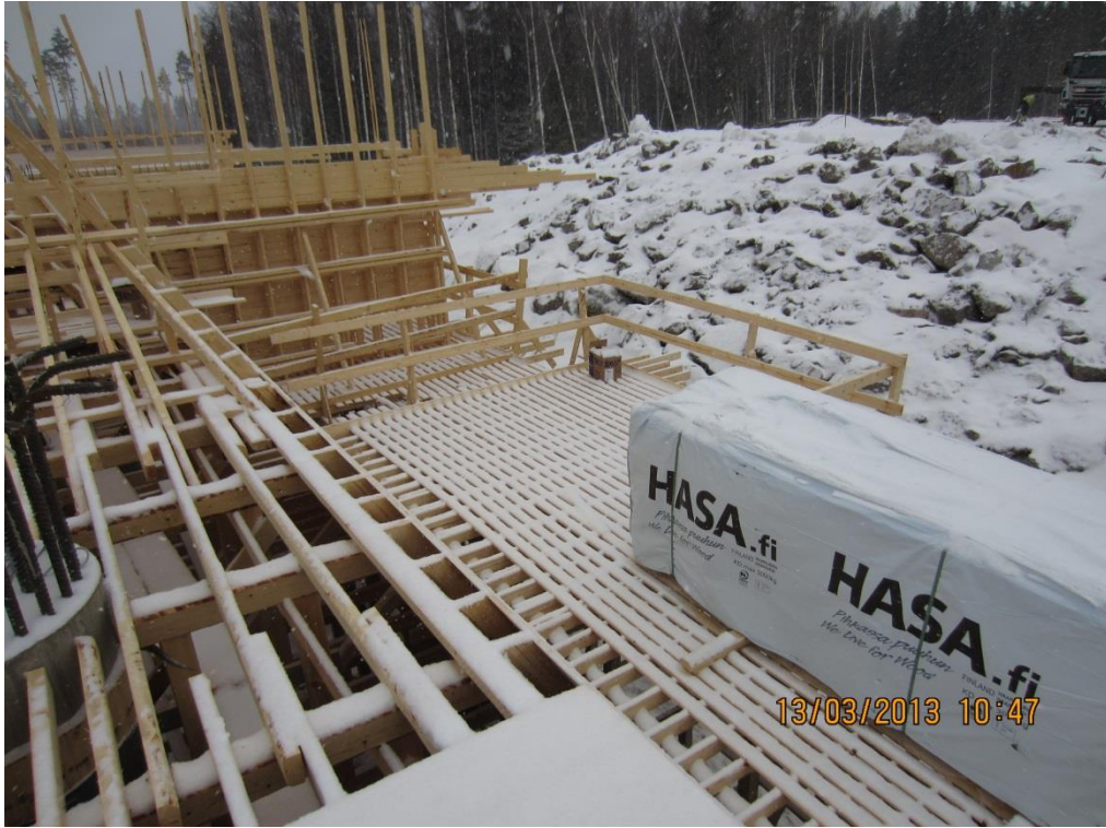
Kuva 8. Sillan päätytasanne