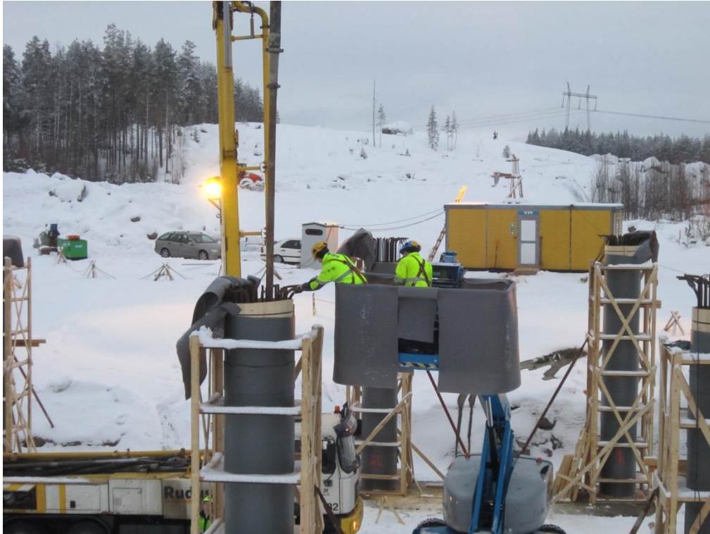
Kuva 9. Nivelpuominostinta käytetään pilarin betonoinnissa