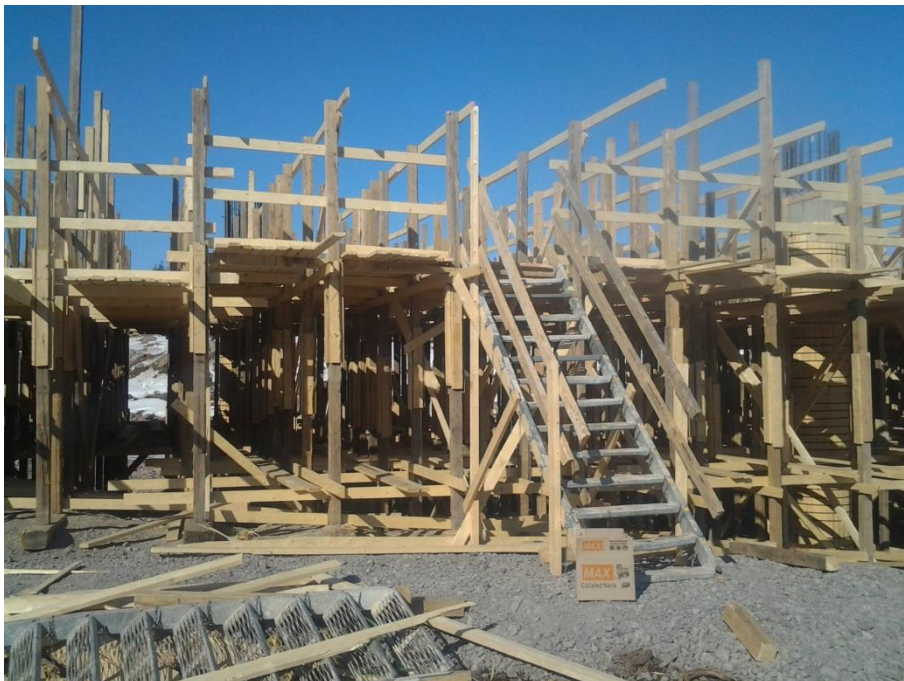
Kuva 3. Reevatason umpilankutus, kaiteet, nousutie Vepe-askelmilla