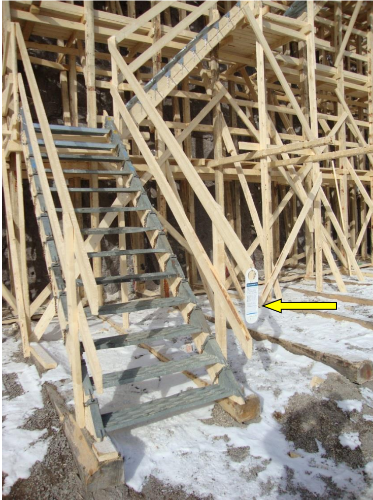
Kuva 7. Vepe-askelmilla toteutettu porrastorni. Huom. tarkastuskortti