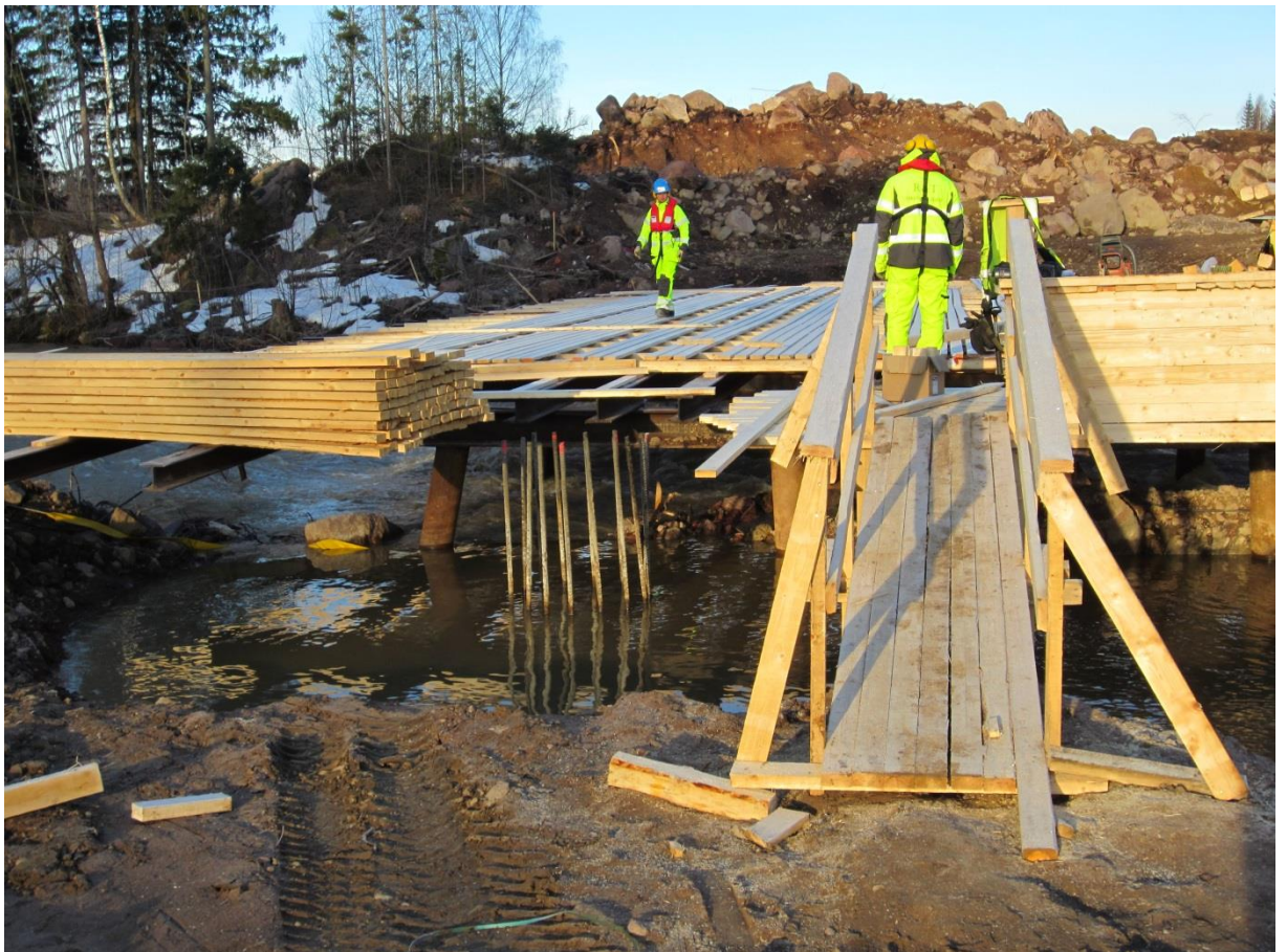
Kuva 5. Paukkuliivit käytössä vesistösilan työsillan rakentamisen aikana

Vesistösilloilla työskennellään usein myös virtaavien vesistöjen äärellä, jolloin käytössä tulee olla heittoliinalla varustettu pelastusrenkas tai vastaava sekä pelastusvene veteen pudonneen pelastamista varten.