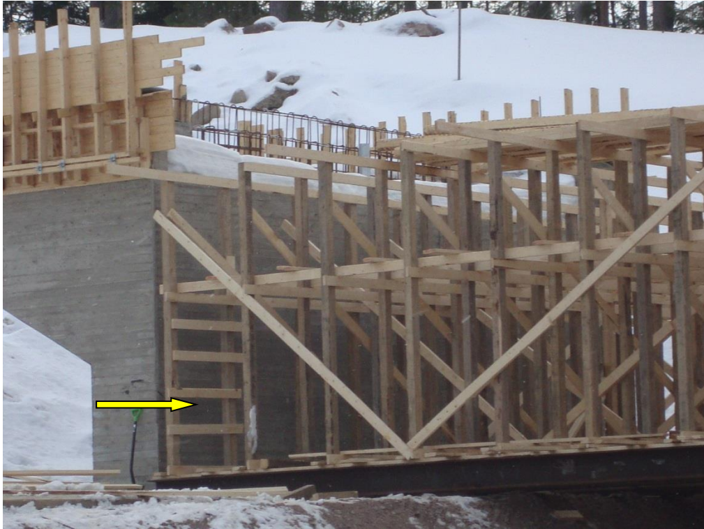
Kuva 6. Vanhalla kulttuurilla toteutettu kulkutie reevatasolle