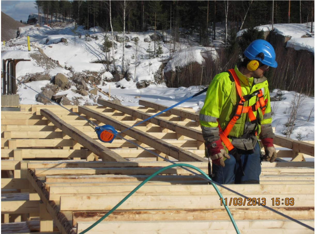
Kuva 4. Turvavaljaat käytössä vaijeriradan ja kelautuvan tarraimen kanssa