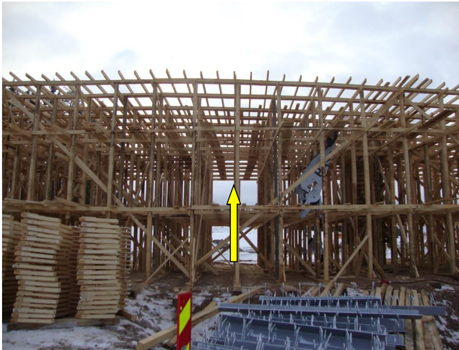
Kuva 2. Vanhaa "tukitelineekulttuuria" kolme lankkua reevatasolla, kaiteet puutuvat